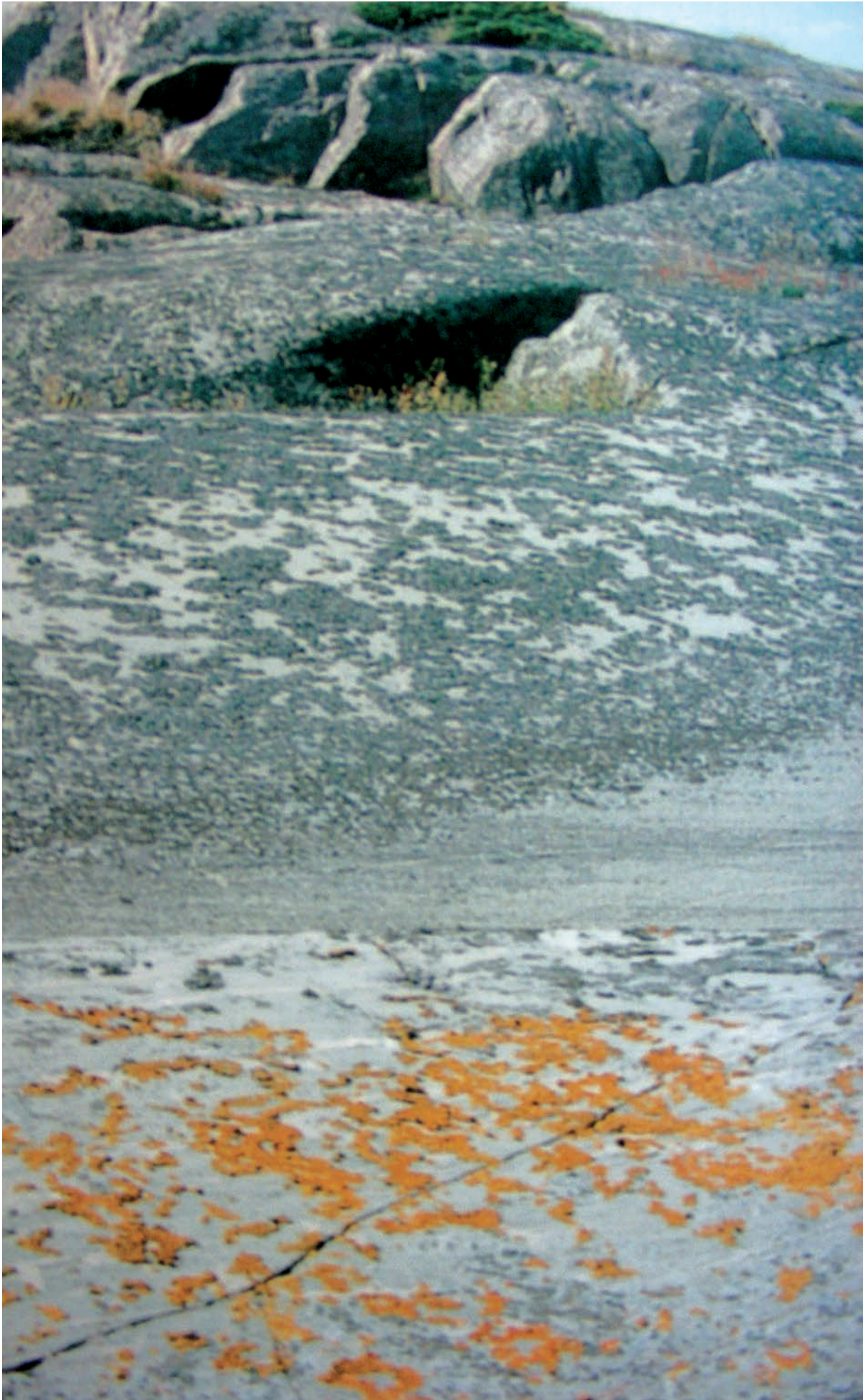
Figura 4 Formaciones rocosas en el archipelago sud-oeste del Golfo de Finlandia.