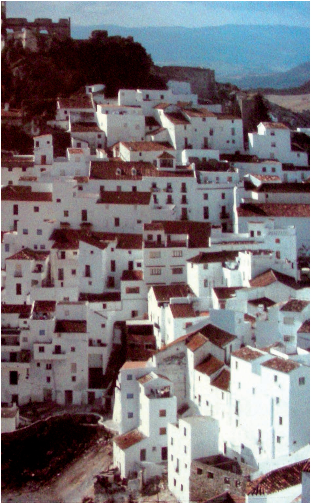
Figura 3 El pueblo de montaña de Casares, España del Sur.