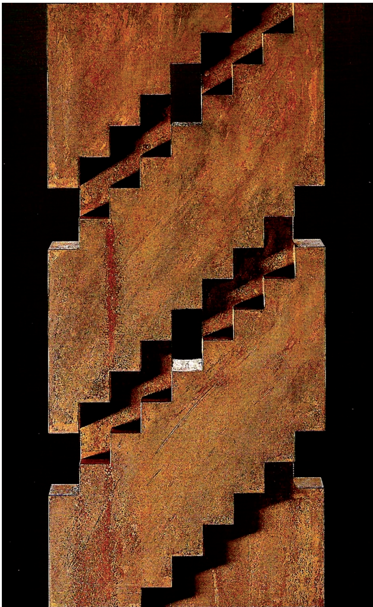
Figura 2 Juahni Pallasmaa, objeto arquitectónico, 1991. Acero oxidado