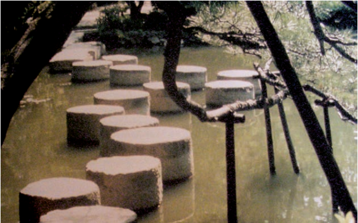
Figura 1 El sawatari-ishi, “pasos por el pantano” en el jardín del lugar sagrado de Heian en Kyoto.