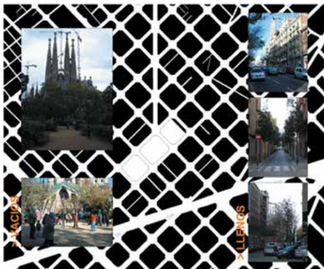
Fig. 3 Llenos y vacíos (Elaboración propia)

Los habitantes del Ensanche encuentran en las plazas frente al Templo su espacio de esparcimiento mientras que el turismo se mueve en torno al Templo sin perturbar la vida cotidiana de los habitantes del Ensanche (Ver Fig. 5).