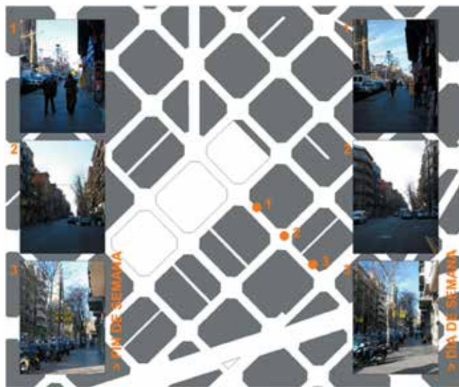
Fig. 4 Movimiento de personas entorno al Templo Sagrada Família (Elaboración propia)