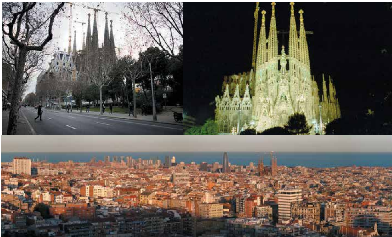
Si bien el Templo de la Sagrada Familia ha perdido contundencia como “hito urbano”, en razón de la variación de proporciones y altura de las construcciones del entorno, sigue siendo un elemento de referencia del barrio y de la ciudad de Barcelona.

1989; Castells, 1996; Borja, Castells, 1997; Montaner, 1999; Borja, 2005; Capel, 2005).