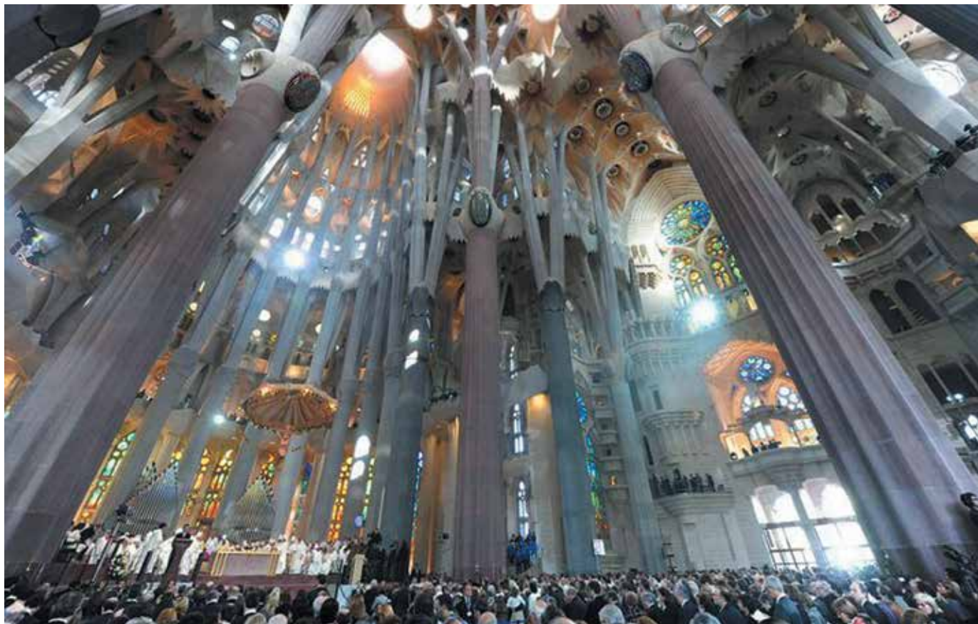
El Templo Expiatorio de la Sagrada Familia acrecienta su incidencia urbana al convertirse en catalizador de encuentros ecuménicos de carácter internacional y también como un atractor masivo de turismo. Interior del templo y una numerosa feligresía

En 1992, con los Juegos Olímpicos, Barcelona inició su exposición mediática a nivel mundial. La mediatización se ha convertido en el mecanismo generador de su desarrollo. La globalización impone el espacio de los flujos como el espacio de las organizaciones económicas y funcionales. Las personas viven en lugares mientras que el poder domina mediante flujos. El espacio de los flujos, interconectado y ahistórico, busca imponerse al espacio de los lugares, disperso y fragmentado. Lo local requiere articularse en red para obtener competitividad y posicionamiento mientras que la globalización no podría existir sin la localización. La visión del mundo como una red no considera estas escalas como antagónicas sino como dos maneras de aproximarse a la misma red espacial. La escala global es aquella definida por el espacio de los flujos mientras que la escala local es aquella definida por el espacio de los lugares. (Castells,