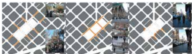
Fig. 5 Habitantes-Turistas-Comercios (Elaboración propia)