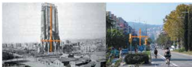
Fig. 2 Antes (Elaboración propia sobre foto de Monge, 1979) – Ahora (Elaboración propia)

El proceso de expansión urbana de Barcelona se apoyó en el plan de saneamiento que realizó el ingeniero Pere García Faria en 1981. Este plan representó el complemento decisivo sobre el cual se apoyó todo el proceso de expansión urbana. En 1910 el Arq. Léon Jaussely recibió el encargo del plan de enlaces de Barcelona con los núcleos urbanos vecinos y solicitó a Gaudí la realización del entorno del Templo para