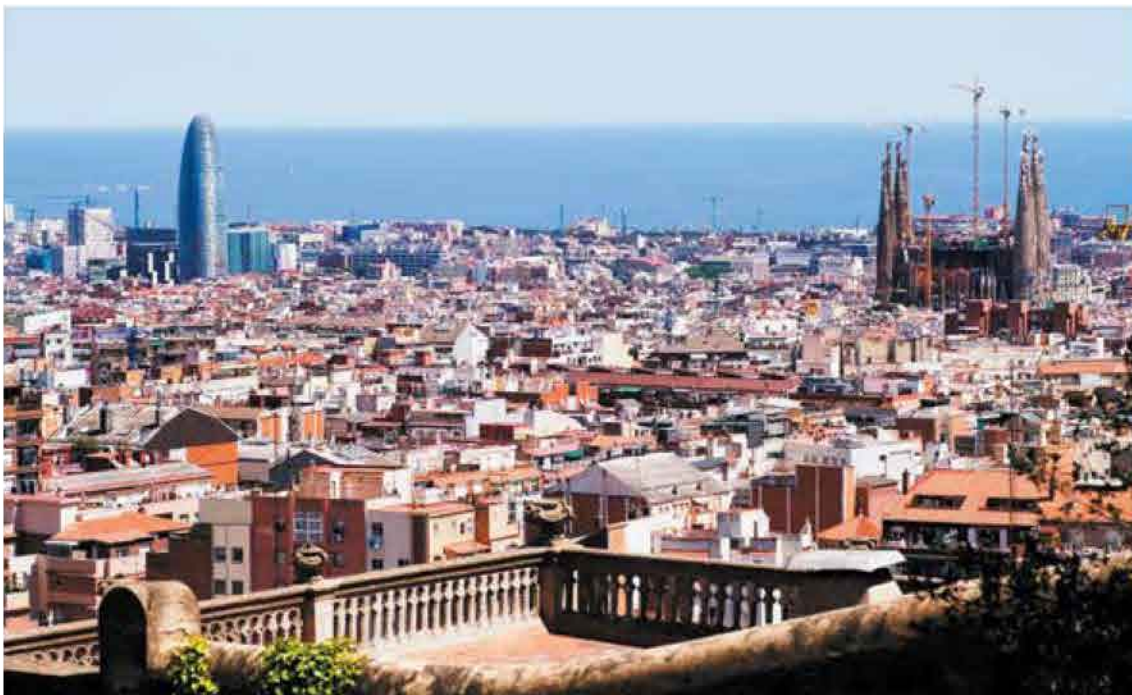
Sagrada Familia. Ubicado en el centro geométrico de Barcelona, el Templo Expiatorio de la Sagrada Familia se encuentra a igual distancia tanto del mar, de la montaña y del río Besòs que de Sants.

KEYWORDS: Global-local, Sagrada Familia Temple, neighborhood scale