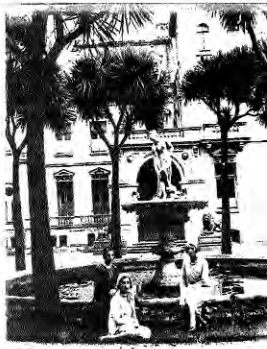
El Palacio del Parque en 1891.