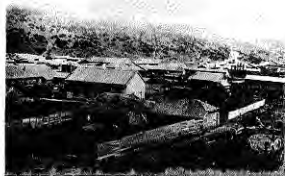
Lota Bajo, 1856.

El desarrollo de la Compañía Carbonífera conlleva el desarrollo de Lota. El nacimiento de Lota Alto, da nueva vida al hasta entonces caserío de Lota Bajo. Se inicia la fundición de cobre y fabricación de ladrillos.