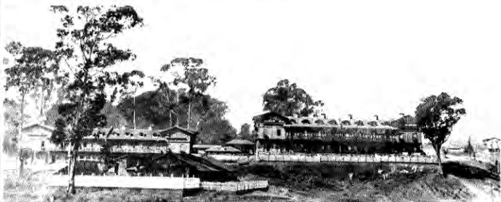
Lota Alto. Habitaciones para obreros.