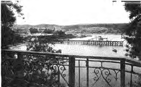
Muelle de Lota.