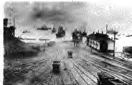
Embarque de carbón. Lota, 1896.