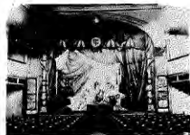
Vista interior del Teatro de Lota.