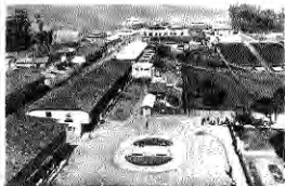
Plaza Bienestar. Lota Alto, 1942.