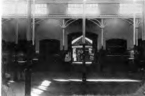
Vista interior Mercado Lota Alto.

1857 La producción ha pasado de 5.348 toneladas en 1852, a 140.934 en 1857.