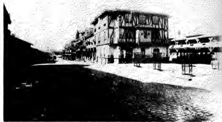
Pabellones para obreros en Lota Alto. En el 2º piso del edificio central se puede apreciar una casa de proyección, para exhibir películas al aire libre.