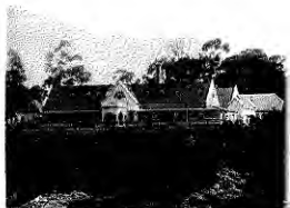
Hospital de Lota Alto.