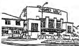
Teatro Lota Alto.