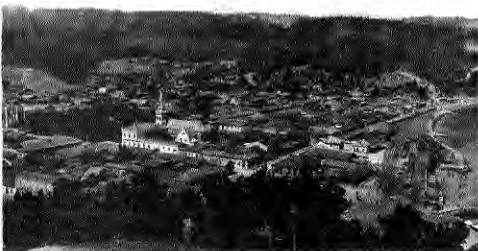
Vista general de Lota Bajo hacia principio de siglo.