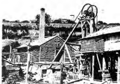
Fique en la quebrada. Lota, 1866.