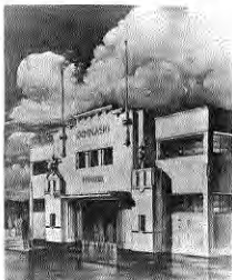
Perspectiva para el Gimnasio de la Compañía Carbonífera e Industrial de Lota.