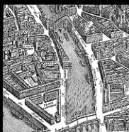
Plan. 1ª mitad del siglo XIX.