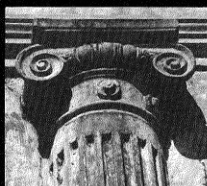
Detalle columna en Concepción.