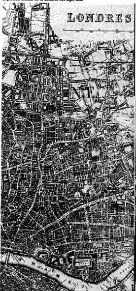
Explotación urbana en el Londres del siglo XIX.