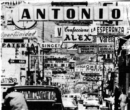
Hoy día la sociedad urbana está evolucionando hacia una sociedad de la información.

NUESTRO PAIS SE DESARROLLO HISTORICAMENTE SIN HABER CONSTITUIDO UN SISTEMA CONTINUO Y ARTICULADO DE CIUDADES. MUCHOS HECHOS IMPOSIBILITARON SU OCURRENCIA, UNO DE LOS MAS SIGNIFICATIVOS FUE LA DESTRUCCION DE LAS 7 CIUDADES AL SUR DEL RIO BIOBIO, A FINES DEL SIGLO XVI.