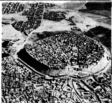
Un ejemplo de las primeras concentraciones urbanas lo podemos encontrar en Edilil, la antigua Arbil, en Irak.