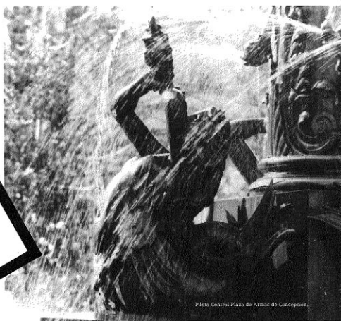
Plaza Central Plaza de Armas de Concepción.

La preocupación por la significación urbanística y el valor patrimonial en la arquitectura debiera estar íntimamente relacionada con la estabilidad estructural de las edificaciones. Estas características deberán ser los valores permanentes de nuestra cultura arquitectónica, en donde lo bello y lo representativo es al mismo tiempo también lo seguro y lo permanente.