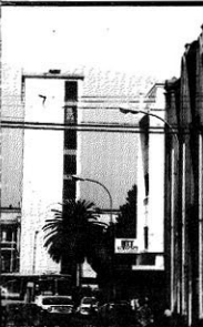
En un rincón de Concepción.