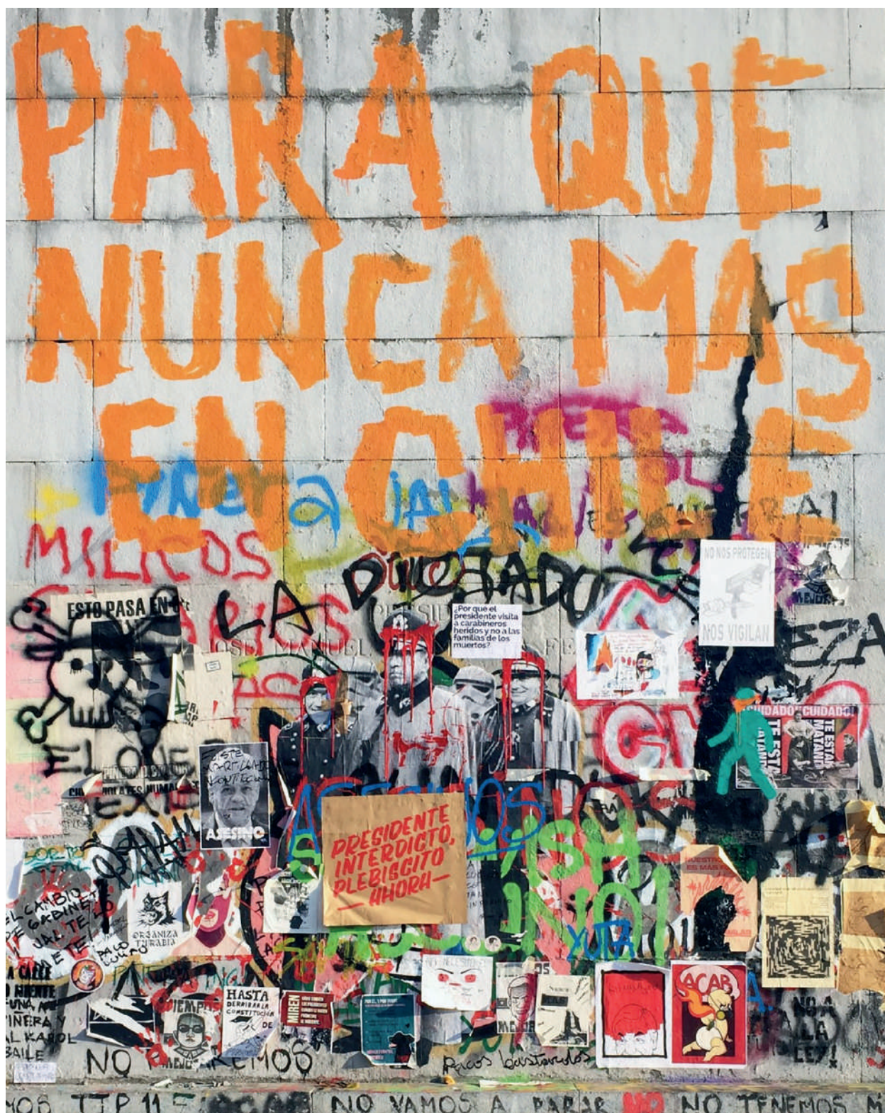
Figura 1 Zócalo Balmaceda.