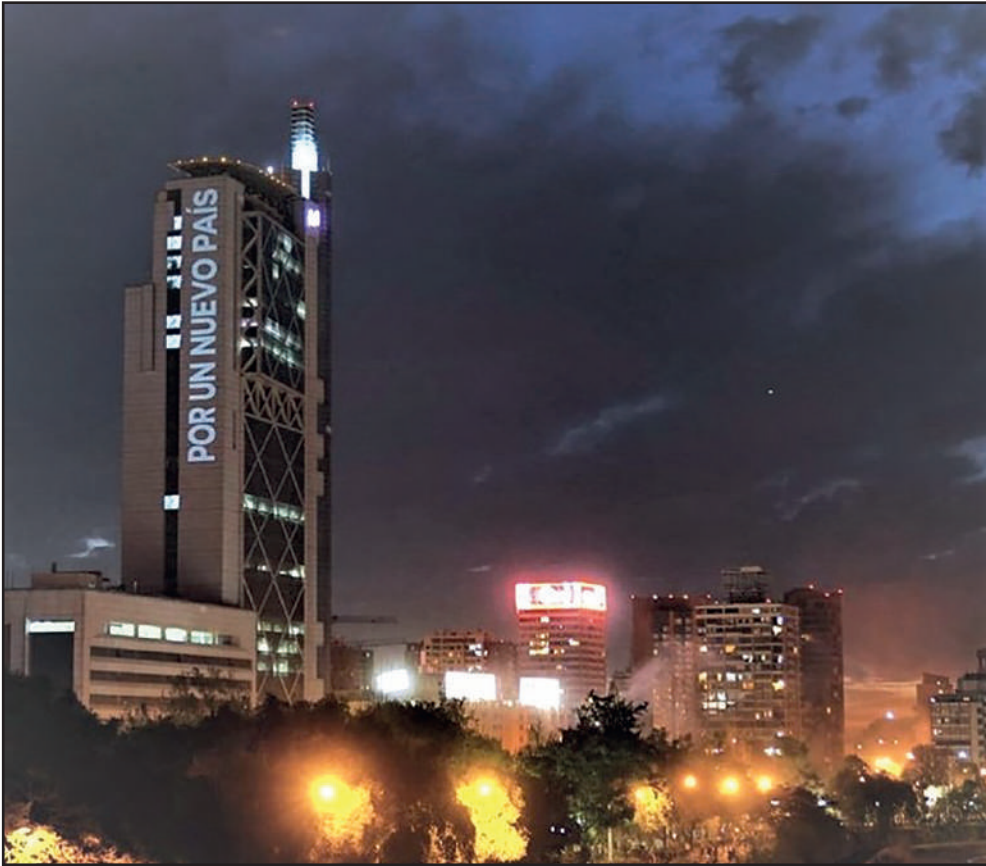
Figura 9 Por un nuevo país, Edificio Telefónica Chile, Santiago de Chile, Delight Lab Estudio, https://www.instagram.com/p/B40eQle-JT1r/?igshid=a5go-7de5x4wa

de las demandas ciudadanas, dejando sobre el Monumento al General Baquedano la palabra "PAZ". El horario en que se instala es al amanecer, por lo que no existió una interacción con la ciudadanía. Su fugaz existencia es conocida mediante un registro fotográfico y un video. La Academia de Líderes Católicos de Chile podrían ser sus autores.