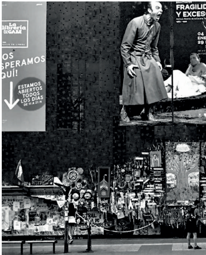
Figura 3 GAM blanco y negro, fotografía Fernando Dowling https://www.instagram.com/p/B7pQbPi-ppLj/ 2020