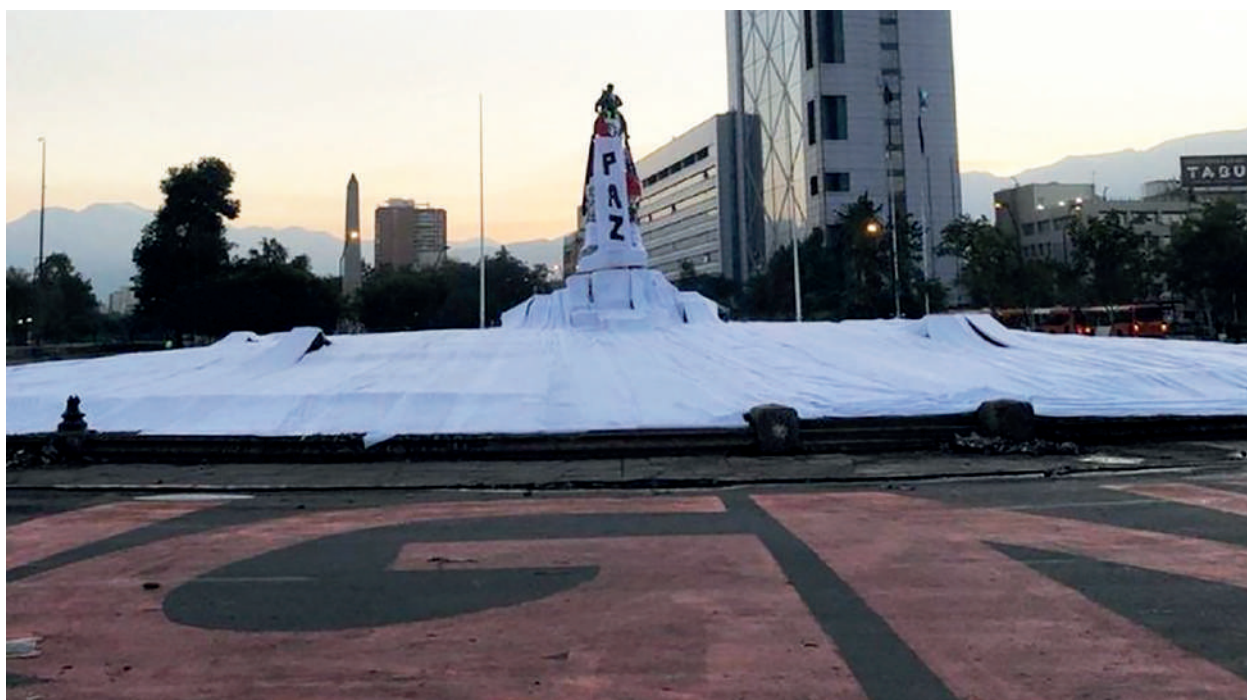
Figura 10 Instalación PAZ, autor desconocido, Santiago de Chile, https://twitter.com/T13/status/1195315357134790657

El interés de esta puesta en escena radica en la posibilidad de significarla de manera casi opuesta, conforme a la cultura y la perspectiva del observador.