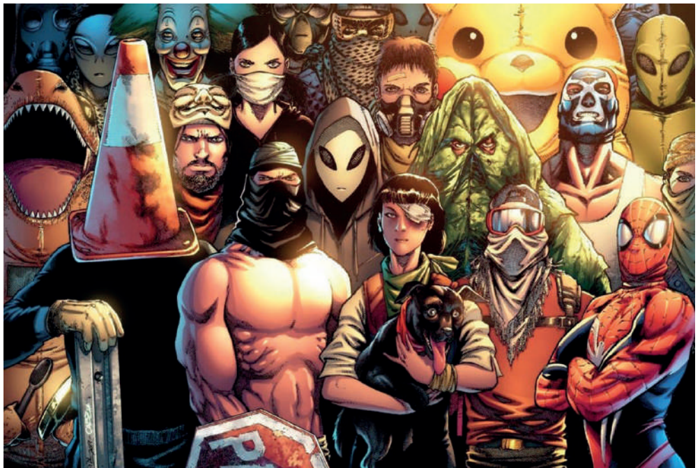
Figura 7 Los Avengers chilenos. Dibujo de CABZ y Mr. Marsupial, https://www.chvnoticias.cl/trending/negro-matapacos-pareman-baila-pikachu-manifestaciones-chile_20191116/ , 2019