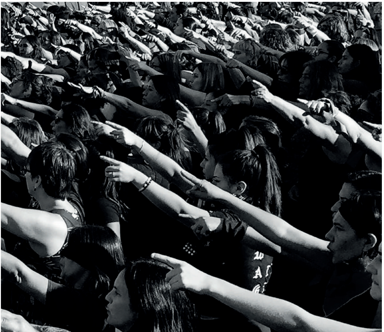
Figura 5 El Violador en tu Camino, Colectivo Las Tesis. Foto- grafía Fernando Dowling, 2019

Por cierto que el fenómeno comunicacional de LasTesis, es bastante más complejo de analizar que solo mediante su expresión performática. En tal sentido, la repercusión que ha tenido a nivel mundial es la capacidad de identificarse con el mensaje. Prueba de aquello es que en cada país donde se ha reproducido, ha sufrido adaptaciones adecuándose al contexto local, universalizando aún más su mensaje.