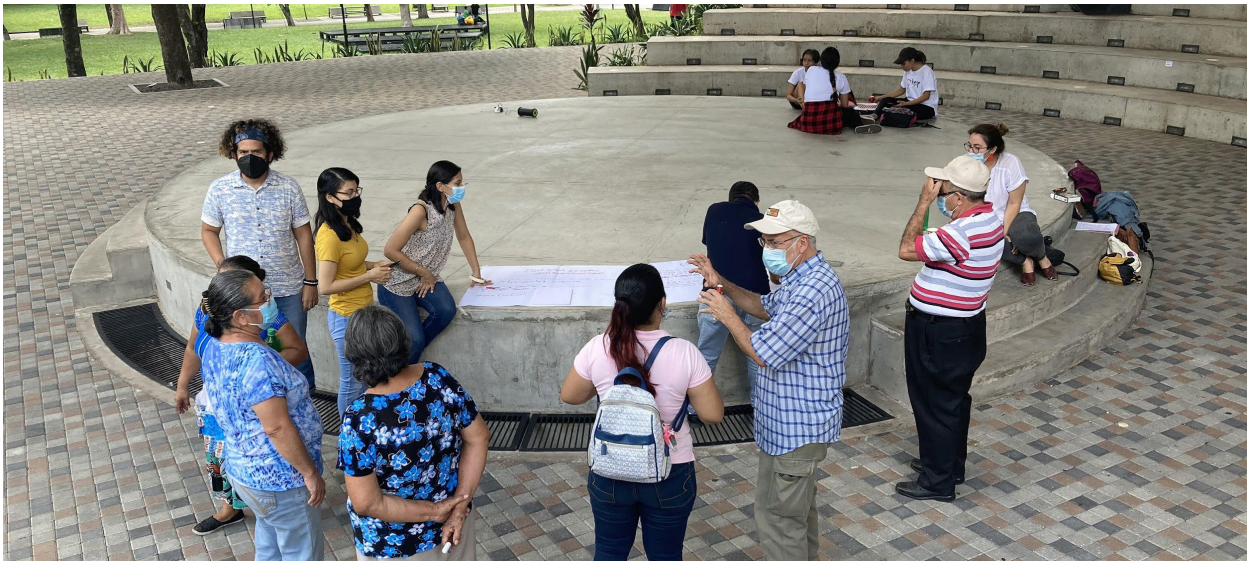
Figura 3. Habitantes de la comunidad Santa Lucía durante la dinámica de grupo focal. Fuente: Archivo fotográfico del proyecto “Barrios vivos” (5 de junio 2021).