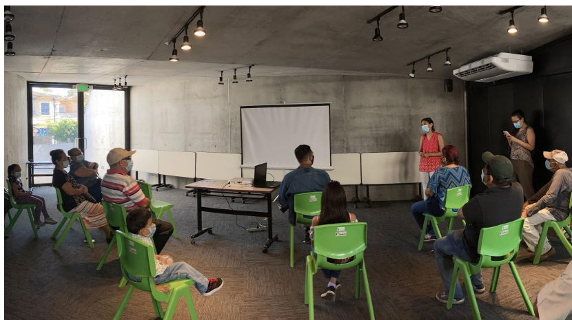
Figura 6. Habitantes de la comunidad Santa Lucía durante presentación de corto documental.

necesidades principales: (a) realizar una intervención de arte urbano en el ingreso de la comunidad y (b) gestionar apoyo gubernamental o institucional para mitigar el riesgo de inundación por la Quebrada La Mascota (Figura 5). Durante este taller se elaboró una primera propuesta del mural, en la cual fueron incorporados elementos como la figura de Santa Lucía, la quebrada la Mascota, el nombre de la comunidad y un "mapa de ubicación" con los puntos de interés dentro de la comunidad.