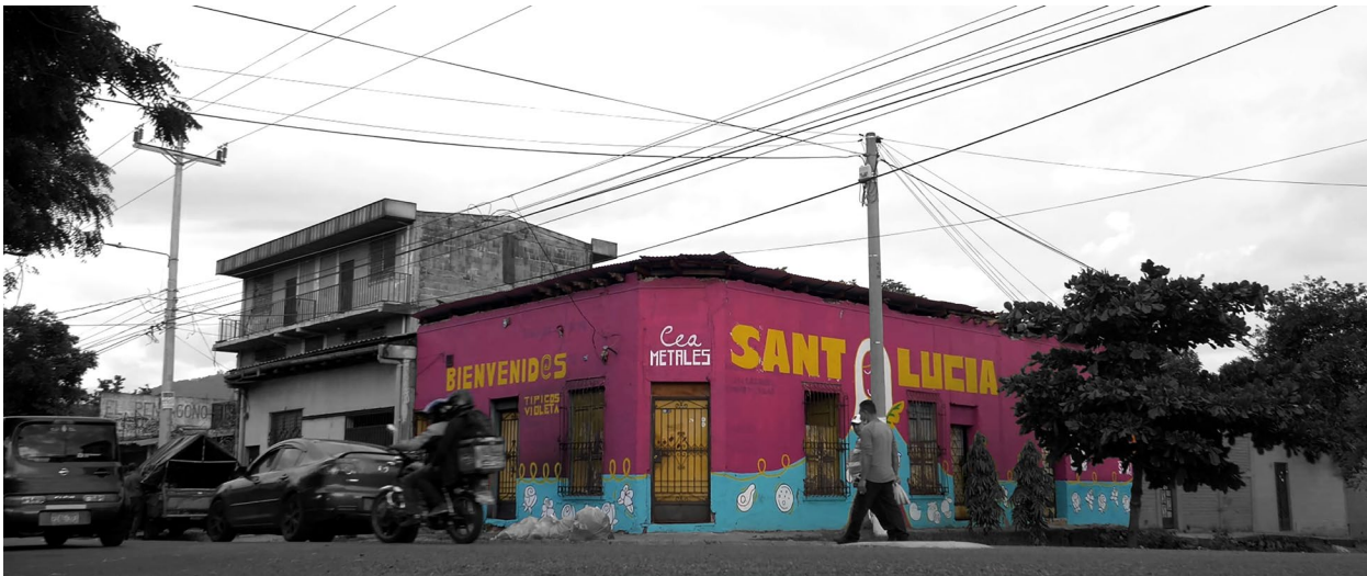
Figura 7. Jornada participativa de elaboración del mural "A los ojos de Santa Lucía".