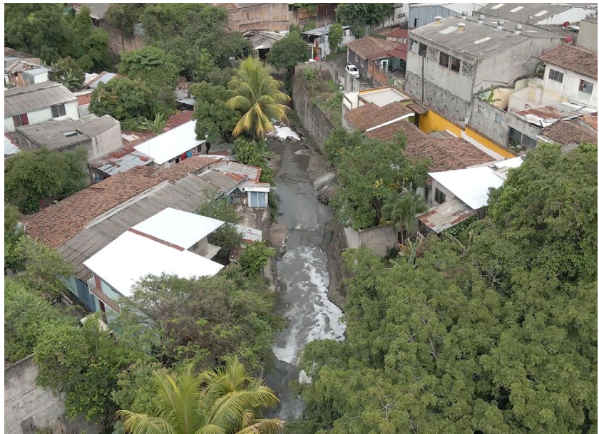
Figura 2. Vista aérea de Quebrada La Mascota y de las viviendas colindantes. Fuente: Archivo fotográfico del proyecto "Barrios vivos" (12 de junio 2021).

de la comunidad, materializando tanto sus miedos como sus esperanzas, y la realización de un corto audiovisual.