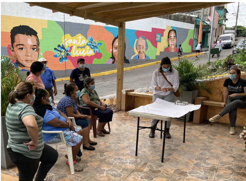
Figura 4. Habitantes de la comunidad Santa Lucía durante el taller participativo. Fuente: Archivo fotográfico del proyecto “Barrios vivos” (12 de junio 2021).

comunicación previa. Los primeros encuentros, concretados entre mayo y junio de 2021, fungieron como espacios para compartir entre la comunidad y el equipo de voluntarios, estableciéndose un ambiente de confianza y un diálogo permanente. A través de entrevistas semiestructuradas y un grupo focal (Figura 3), fue posible construir colectivamente la percepción de las y los habitantes, tanto de su comunidad como de las intervenciones previas desarrolladas por Glasswing International, además de aprender sobre sus propios procesos organizativos, sobre la percepción de su situación actual y sus necesidades a futuro.