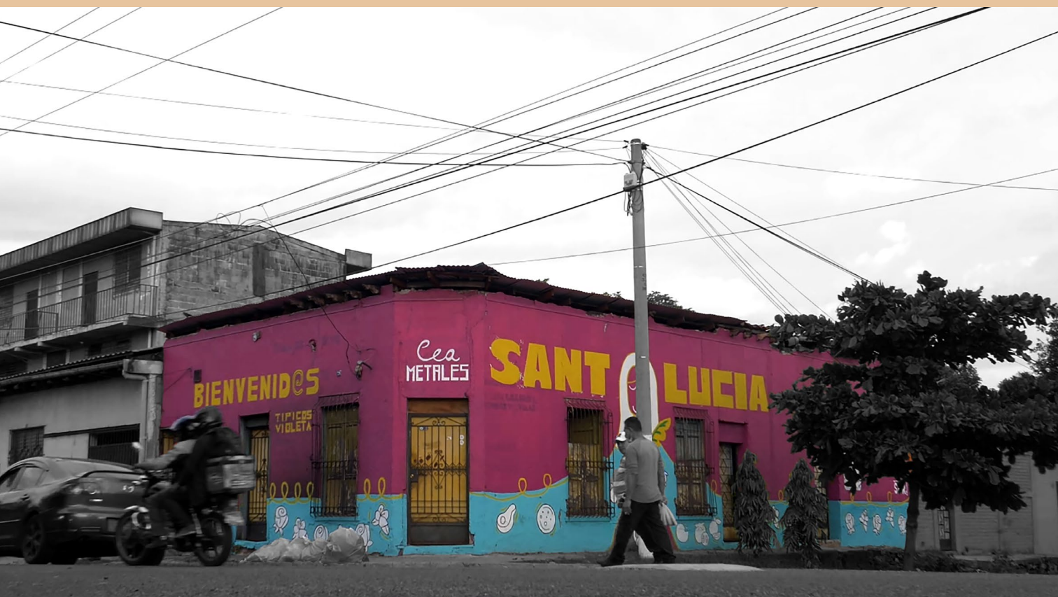
Figura 0. Fotografía panorámica del mural finalizado. Fuente: Archivo fotográfico del proyecto "Barrios vivos" (18 de julio 2021).

Aos olhos de Santa Lucía: arte urbana e organização comunitária no Centro Histórico de San Salvador.