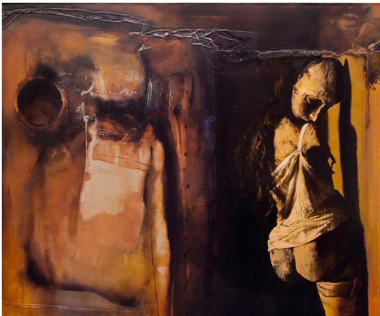
Figura 5. "La muñeca de Bellmer", (c. 2011). Fuente: cortesía del autor Álvaro Huenchuleo, técnica mixta sobre tela.