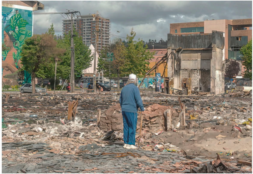
Figura 7. Ruinas de la tienda Homecenter Sodimac ubicada en calle Orompello. Fotografía del estallido social en Concepción, octubre-diciembre, 2019.