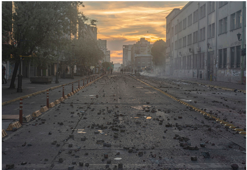
Figura 8. Calle O'Higgins. Fotografía del estallido social en Concepción, octubre-diciembre, 2019.

“En la pared blanqueada a la cal nos pusieron un recorte de revista vieja, una reproducción resquebrajada de los aquelares de Goya.” (Harris, 1992, p. 37)