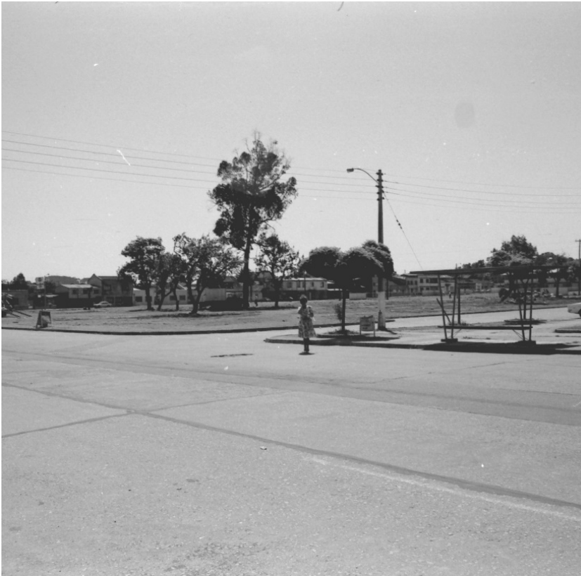
Figura 3. Espacio baldío desde esquina Ongolmo - Los Carreras. Al fondo, calle Orompello. Fuente: Archivo de Arquitectura UBB (c. 1990)