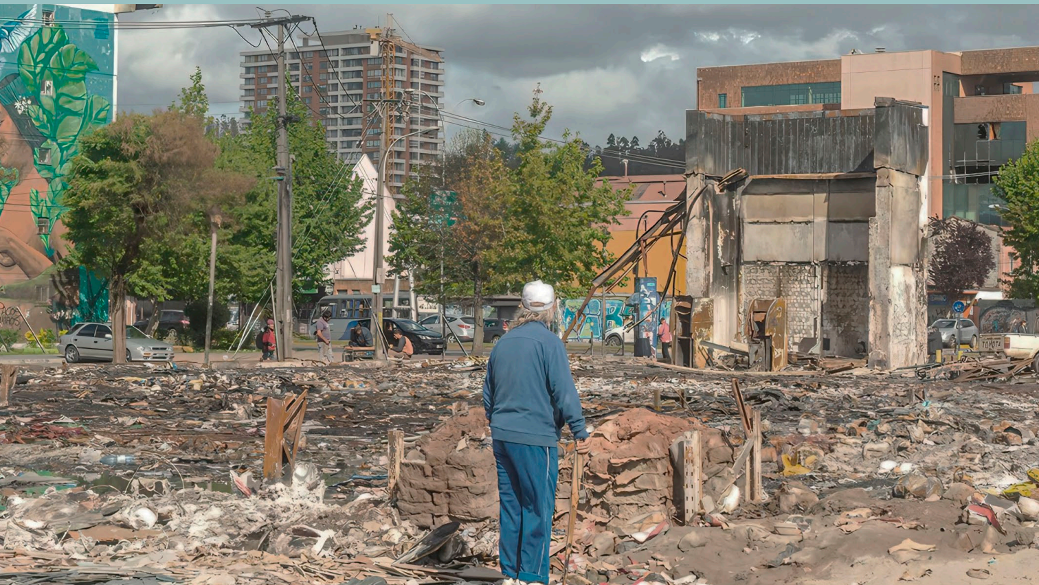
Figura 0. Ruinas de la tienda Homecenter Sodimac ubicada en calle Orompello. Fotografía del estallido social en Concepción, octubre-diciembre, 2019.

IMAGINÁRIOS DO LIVRO DE POEMAS CIPANGO DE THOMAS HARRIS. ESPAÇOS BALDIOS, REPRESSÃO E VIOLÊNCIA NA RUA OROMPELLO EM CONCEPCIÓN.