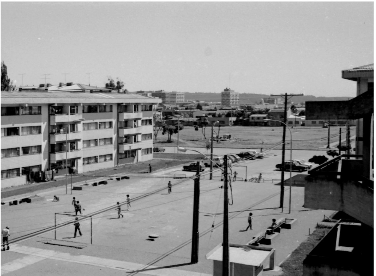
Figura 4. Vista hacia calle Orompello desde Remodelación Eleuterio Ramírez (CORMU, f. 1970-1973). Se puede observar el contraste entre lo construido y el espacio baldío.