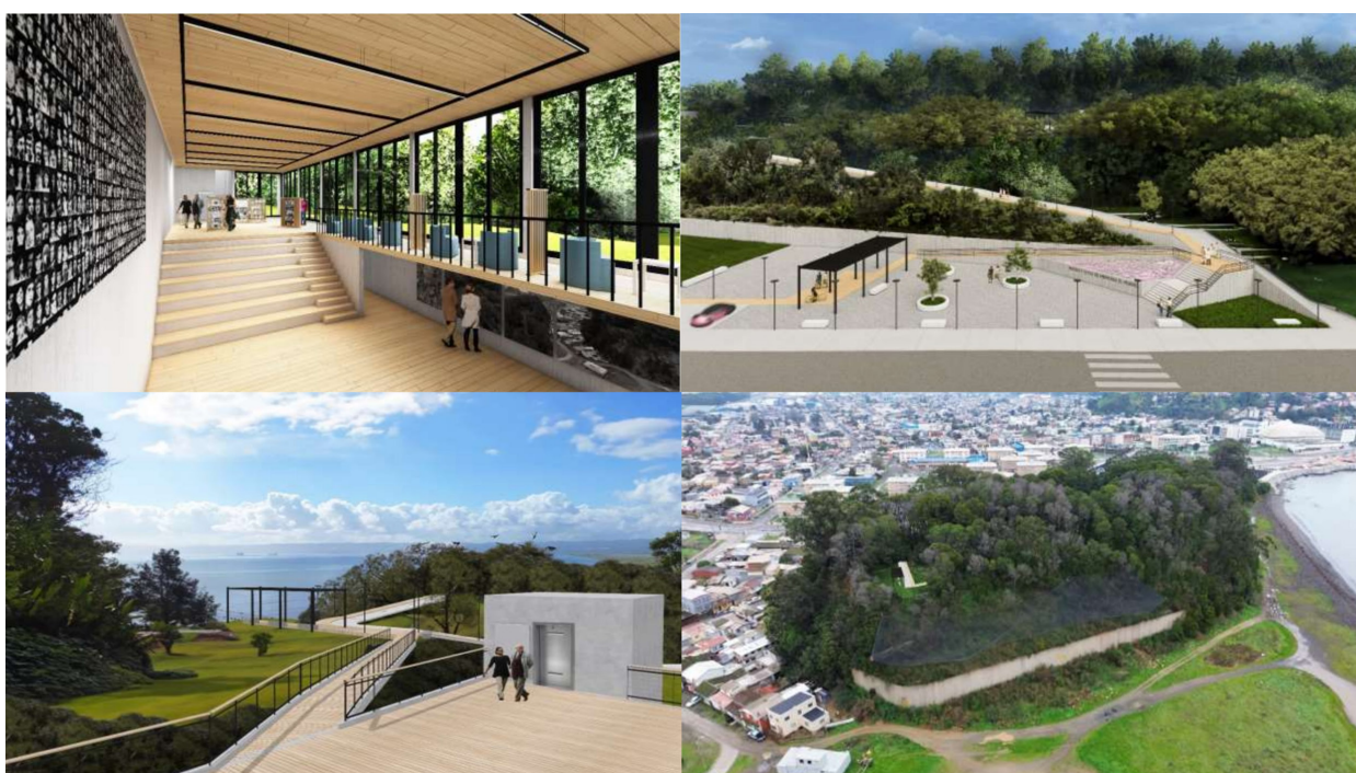
Figura 7. Museo interpretativo / Plaza de acceso / Senderos-mirador / Reforzamiento laderas.

tsunami. Los muros y espacios de este sitio cargan simultáneamente con estas memorias, convirtiéndose en archivos vivos que condensan biografías colectivas, al funcionar como el hilo conductor que integra los diferentes tiempos en una experiencia espacial única.