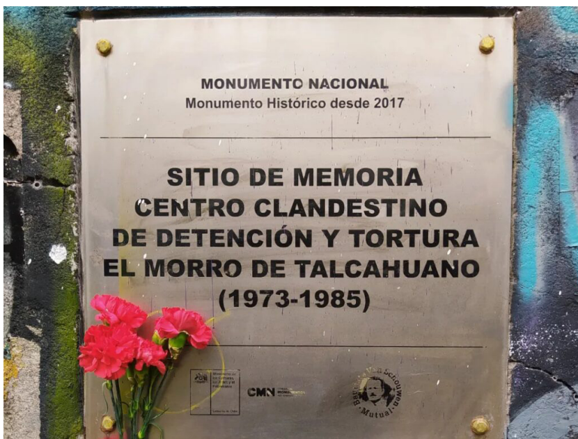
Figura 5. Exterior de El Morro, antes de la entrada que permite subir el cerro para llegar al sitio.

Figura 4. Placa Monumento Nacional.