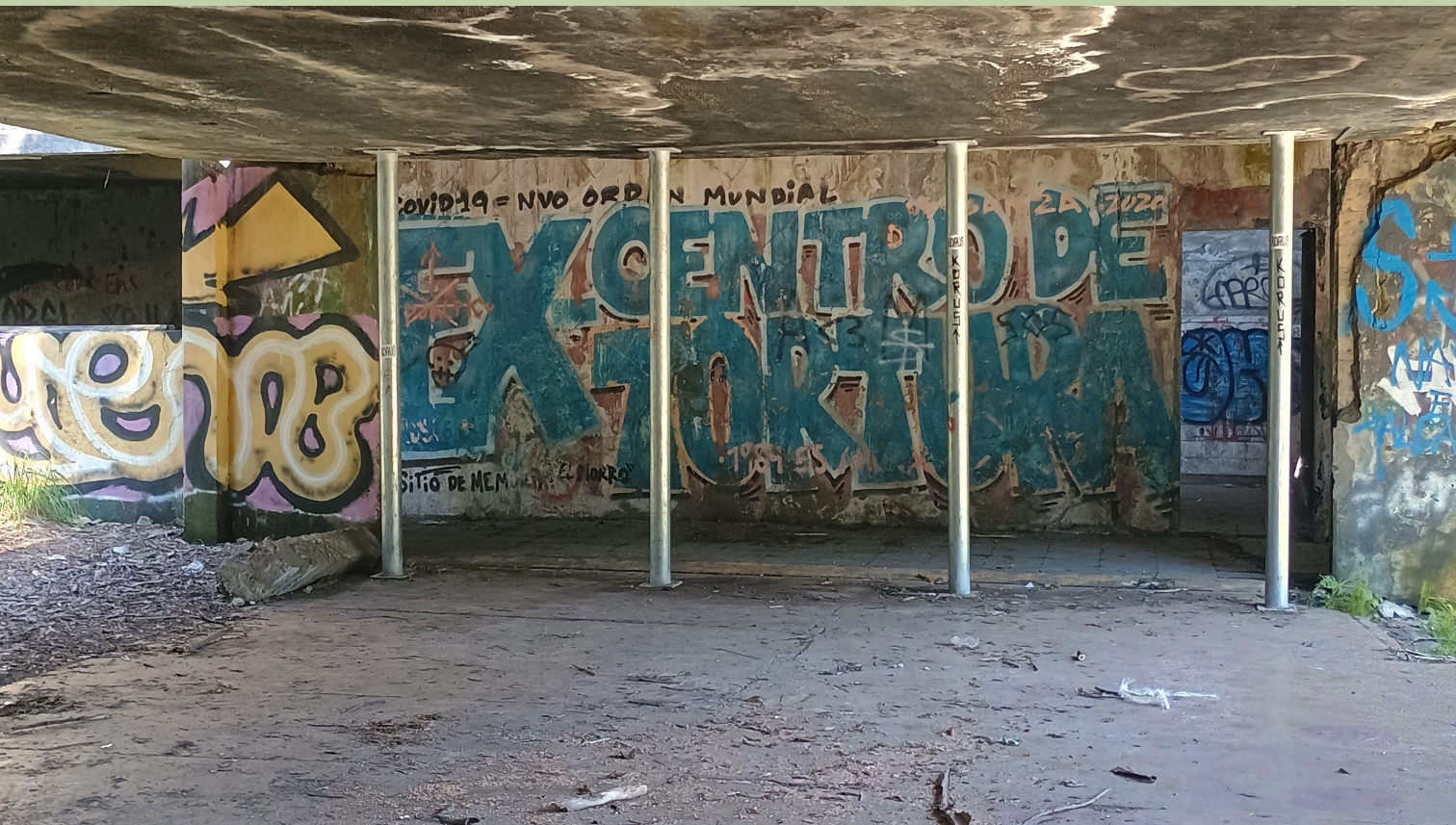
Figura 0. interior de El Morro.

TOPOGRAFIAS DA MEMÓRIA EM UMA PAISAGEM DE RESISTÊNCIA E TRANSFORMAÇÃO: O CASO DO ANTIGO FORTE EL MORRO EM TALCAHUANO, CHILE