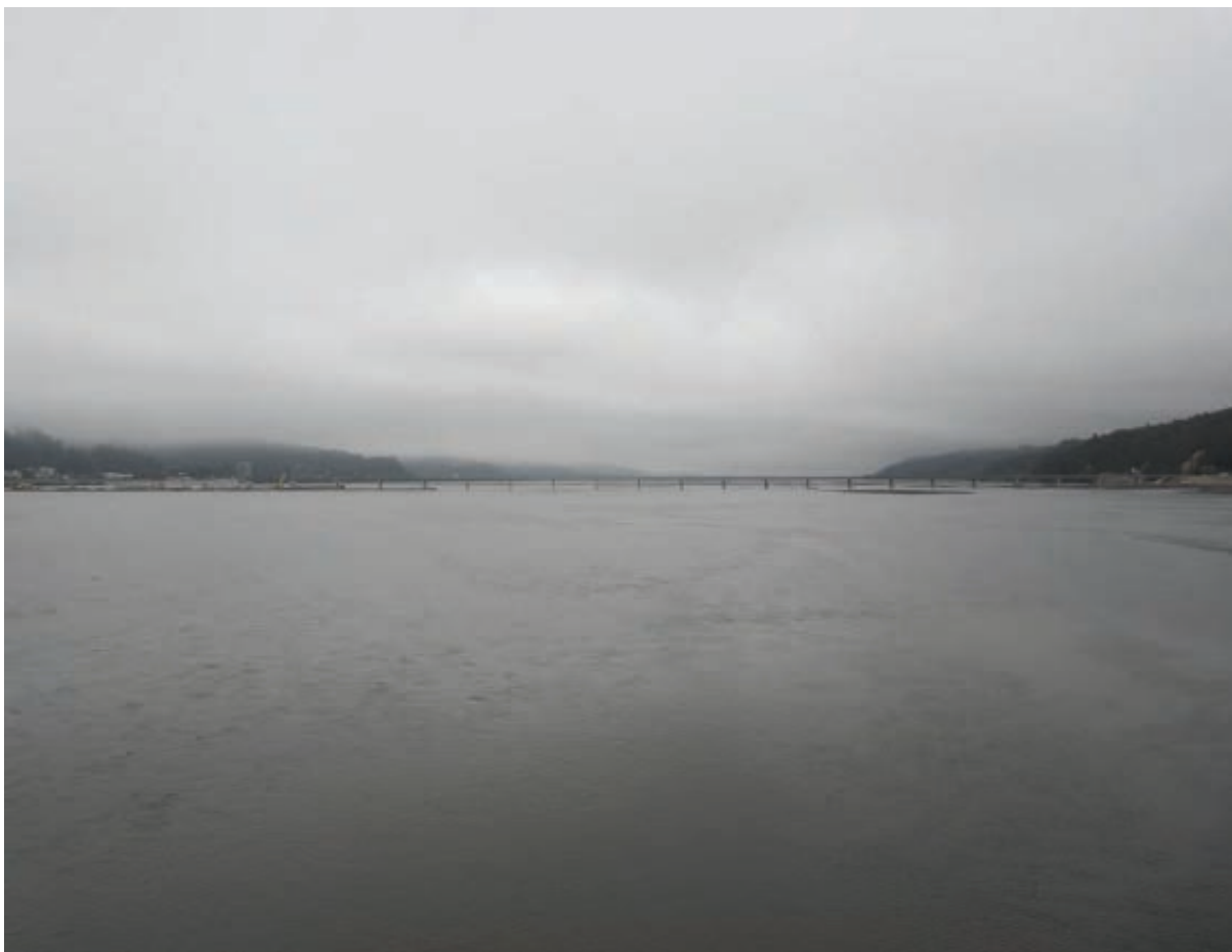
Figura 6 y 7 Serie Puentes y vacíos . (izquierda) Puente Viejo, fotografía digital. (derecha) Puente Mecano Chacabuco en Construcción, fotografía digital. Fotógrafo: Sady Mora. / Bridges and voids series. (left) Puente Viejo, digital photograph. (right) Chacabuco meccano bridge under construction, digital photograph. Photographer: Sady Mora.

MARZO Se reponen 3 pistas en el acceso norte del puente Llacolén a través de la instalación de dos puentes Mecano.