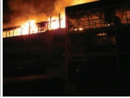
3: 58 am