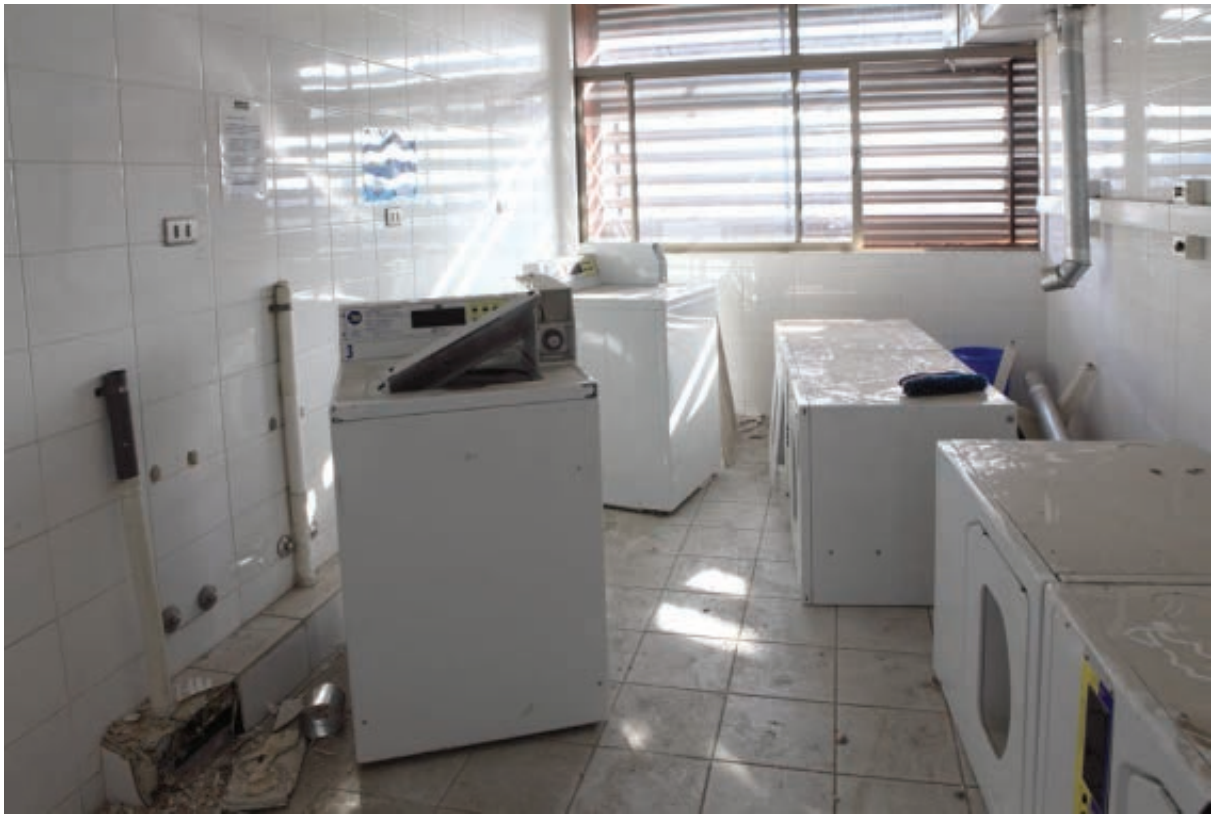
Figura 3 y 4 Serie Nueva Ruina . Fotografía digital. Interiores edificio Centro Mayor. Fotografía digital. Fotógrafo: Fernando Melo./ New Ruin series. Digital photograph. Interior shots of the Centro Mayor building. Photographer: Fernando Melo.

MARZO El ejército define perímetro de seguridad alrededor de los edificios dañados ABRIL El Ministerio decide hacerse cargo de los edificios con riesgo sobre el espacio público MAYO El MOP define cuáles son los edificios que quedarán a su cargo SEPTIEMBRE el DICTUC inicia estudio para determinar fallas y procedimientos NOVIEMBRE Se inicia demolición del Palacio de los Deportes en Talcahuano DICIEMBRE se inicia la estabilización de los edificios por parte del MOP MARZO 2011 Se proyecta terminar con todas las obras de estabilizaciones, mitigando temporalmente el riesgo inminente que representan los edificios del gran Concepción.