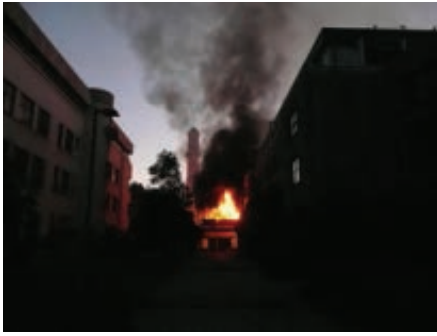
6: 08 am