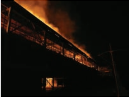
3: 56 am