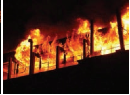
3: 59 am