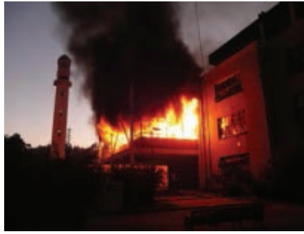
6: 11 am