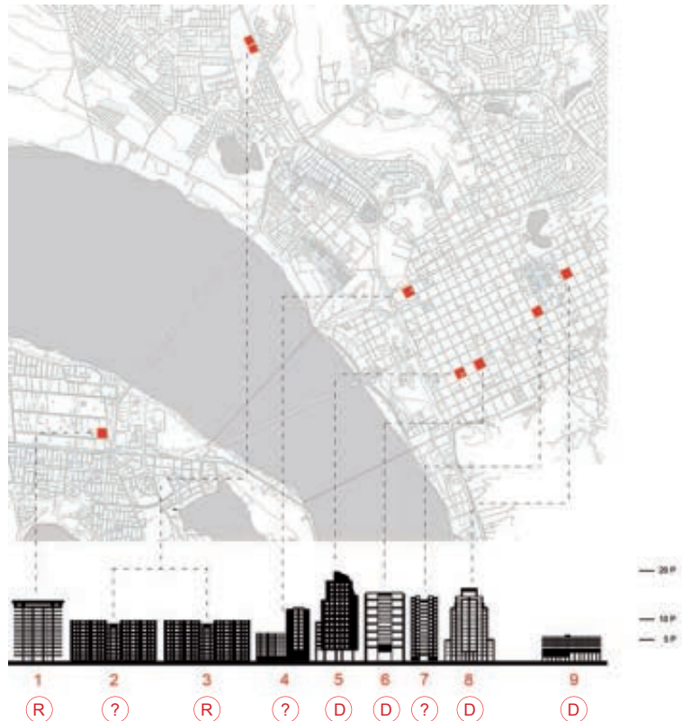
Figura 5 Ubicación de los nueve edificios inhabitables a cargo del MOP. (R) Reparar, (D) Demoler, (?) Costo reparación es equivalente al costo de reconstrucción. Fuente: Dirección de Arquitectura MOP, Región del Bío-Bío. Elaboración [AS] Arquitecturas del Sur / Location of the nine uninhabitable buildings in MOP charge. (R) Repair, (D) Demolish, (?) Reparation cost equivalent to reconstruction cost. Source: MOP Architecture Department, Bío-Bío Region. Drawn up by [AS] Arquitecturas del Sur.