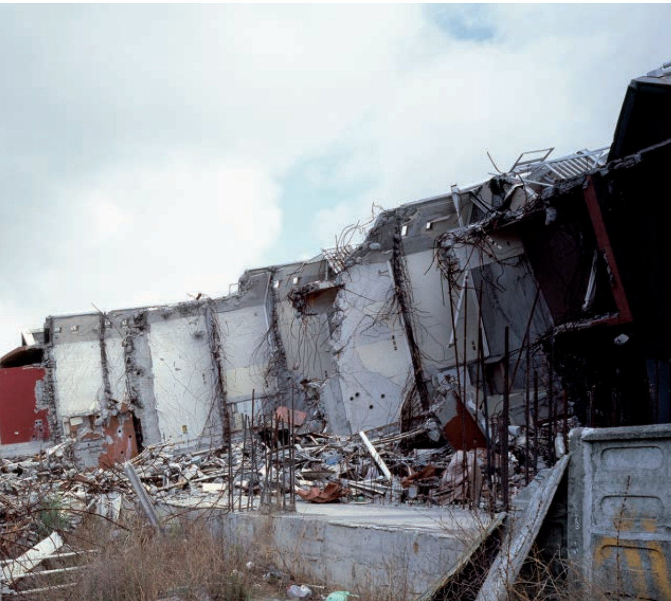
Figura 13 Serie Urbe. Vista ruinas edificio Alto Río. Concepción. 91x185cm. Fotografía Análoga digitalizada. / City series. View of the ruins of the Alto Río building, Concepción. 91x185cm. Digitalised analogue photograph.