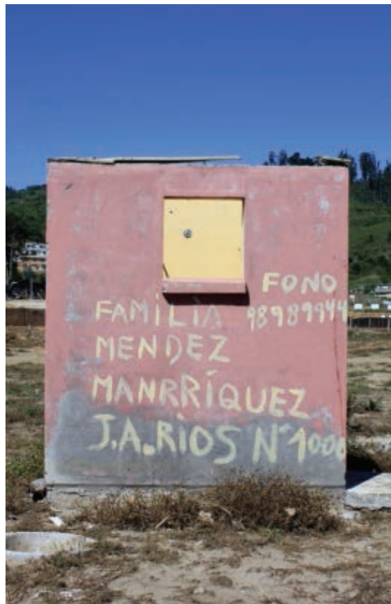
Figura 9 Serie vestigios – habitaciones. Borde costero Región del Bío Bío. Fotografía digital. / Remains – habitations series. Coastline of the Bío Bío region. Digital photograph.