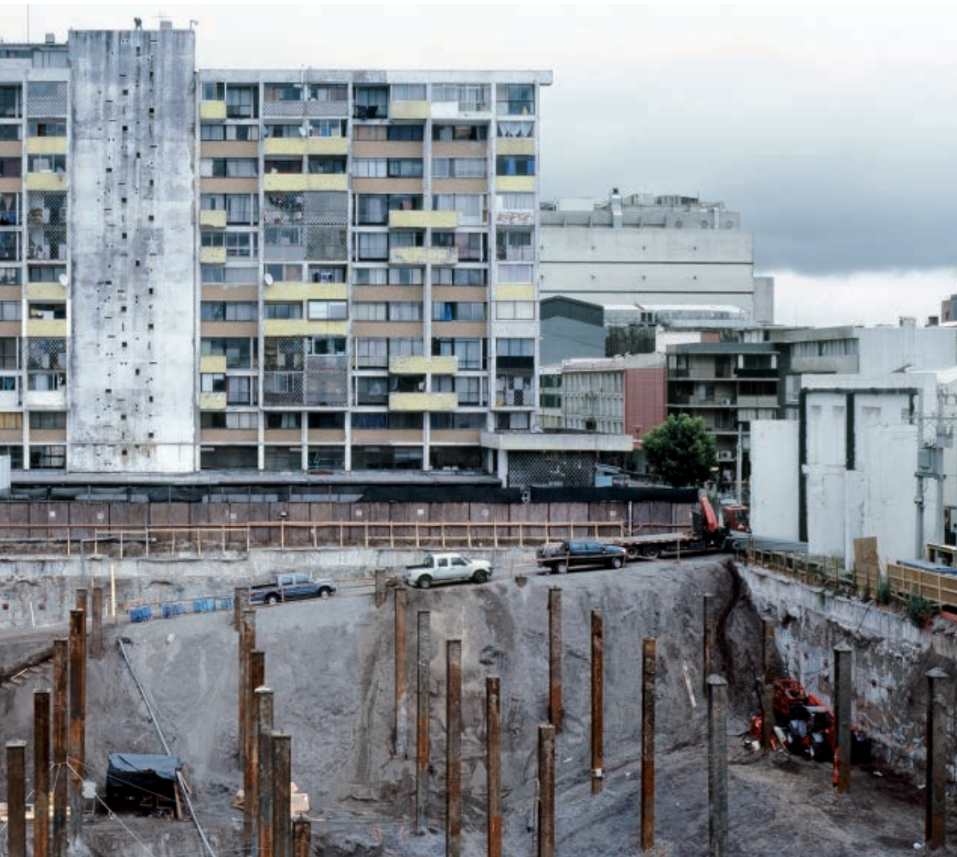
Figura 15 Serie Urbe . Concepción. 91x185cm. Fotografía Análoga digitalizada. / City series. Concepción. 91x185cm. Digitalised analogue photograph.