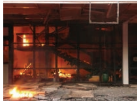
6: 20 am

In September, the DICTUC began the study, which included tasks such as compilation of background information, design review (structural modelling for each project to ensure compliance with regulations), verification of construction quality (on-site verification that built work complied with architectural plans), soil mechanics and detailed plans of structural faults. In November, the DICTUC handed a report to the Ministry of Public Works with the results of the studies by way of expert testimony so the relevant parties could decide upon the judicial path to pursue. The study determined that seven of the nine high-rise buildings must be stabilised in order to ensure the safety of public spaces. The state is financing the stabilisation of five buildings (Torre O'Higgins, Torre Libertad, Alto Arauco, Rodrigo Triana and Plaza del Río). In the case of the buildings Alto Huerto and Centro Mayor, the costs of this operation will be assumed by the property developers themselves.