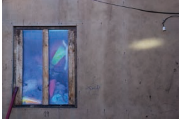
Figura 11 Serie Des-Habitados . Moradas de Emergencia región del Bío Bío. Fotografía digital. / Un-Inhabited series. Emergency dwellings in the Bío Bío region. Digital photograph.