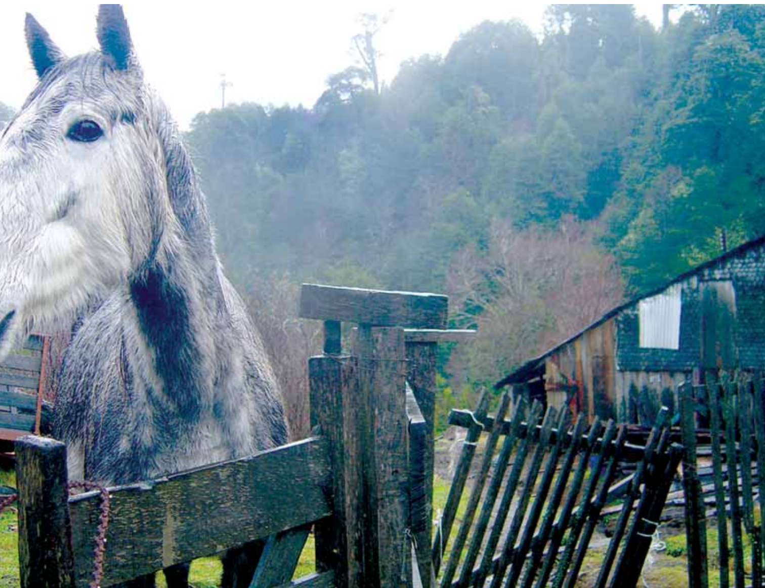
MAR06JUN / 11:30AM / vivienda rural / altos de Coñaripe