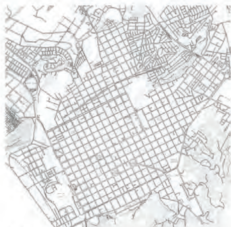
CASCO URBANO DE LA CIUDAD DE CONCEPCIÓN

R1: RECORRIDO N°1, CP01-CP02 (CAUPOLICÁN- LOS CARRERAS-PAICAVÍ)