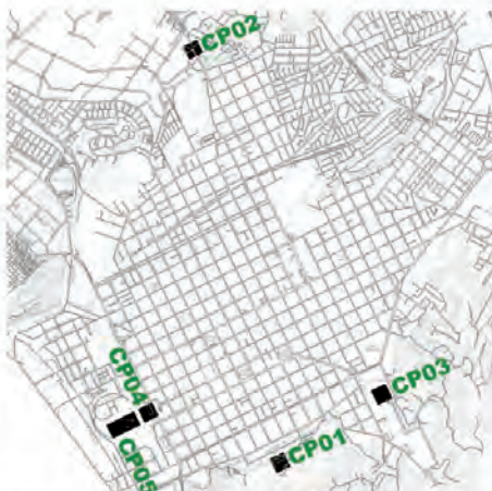
UBICACIÓN CONCURSOS PÚBLICOS