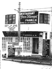
JOSE LUIS SUBIBARRÉ

Derivado de esto último, llama la atención la proliferación de carteles en la vía pública anunciando en dos idiomas excursiones, viajes, alojamiento, etc., con una expresión más propia de actividades circenses que turísticas y que para nada se integran al paisaje urbano llegando, incluso, la fachada de algunos restaurantes a convertirse en