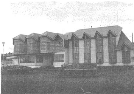
• Hotel Juan Ladrilleros. Arquitectos: Moris - Ursalovic.