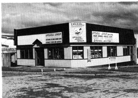
• Centros Comerciales "Afrontonados".