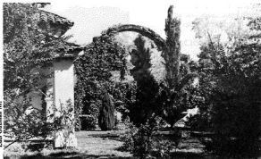
Hacienda Zemita, frontis de la antigua capilla.

No obstante el fallecimiento de don Andrés Errázuriz en 1987, el proceso de restauración y conservación ha sido llevado a cabo con progresiva fidelidad por Andrés Lo-