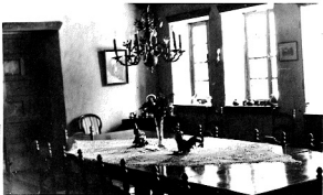
Hacienda Zemita, Comedor principal.

Esta clasificación nos ofrece, desde luego, la ventaja de ubicar ordenadamente, para su estudio y descripción, la secuencia correspondiente para cada conjunto arquitectónico investigado.