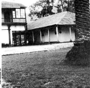
Casas en hacienda Cucha-Orejola.

salmente. Este espacio constituye el atrio, que antiguamente servía como sitio de espera a quienes acudían a la liturgia dominical. En este ámbito destaca el diseño del frontón de la capilla, el que culmina en medalluna en su parte superior, a semejanza de los pórticos mexicanos o españoles. Sus puertas, hoy desvencijadas, muestran aún adornos metálicos como aldabes, visagras y cerrojos de hierro forjado en la misma hacienda.