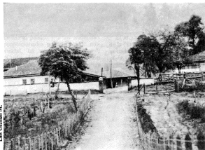
Acceso a hacienda Cucha-Orejola.

La más importante de todas ellas es una casa central de dos pisos emplazada de norte a sur, cuyo estilo en alquería muestra los rasgos característicos de fines de siglo, lo cual obedece a los cambios que hacia esta época se introdujeron en el gusto y concepción de las construcciones rurales.