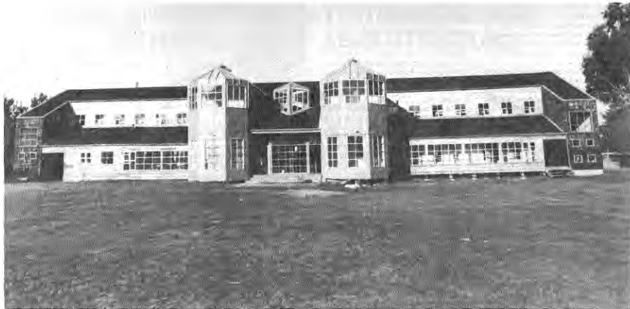
Inserción Campesino San Francisco de Castro. 1988. Arquitectos Edward Rojas e Ivánna Golos.