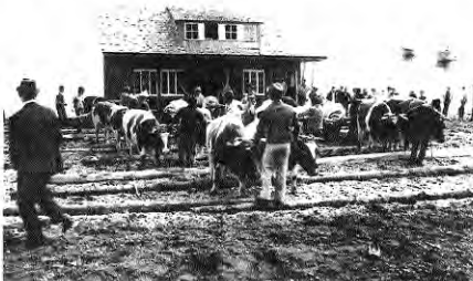
Minga de tiradura de casa. 1. La casa es desmontada de sus cimientos y lanzada al agua. 2. Flotación y traslado por el mar. 3. Nuevamente en tierra y trasladada a su nuevo lugar.

Cuestiones que permitirán medir finalmente las transformaciones que la "modernidad" impuesta muchas veces a presión" está generando en ella para así poder actuar en consecuencia, e intentar una propuesta de síntesis con las tensiones presentes en cada región.