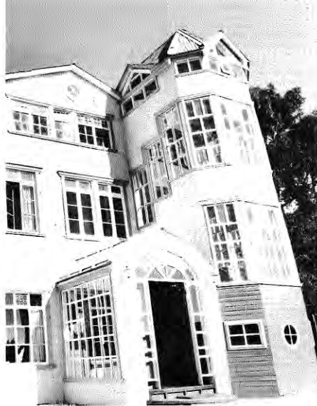
Hotel Ultramar. Castro. Arquitecto Edward Rojas.

Ponencia presentada en el IV Seminario de Arquitectura Latinoamericana. Tlaxcala, México/1989