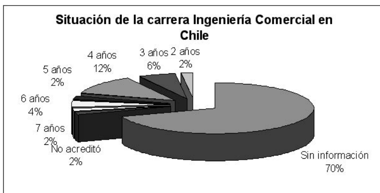
Gráfico 3: Resultado de proceso acreditación de la Carrera Ingeniería Comercial en Chile: Julio 2007

A fines de julio de 2007, de los 49 programas de Ingeniería Comercial existentes en país, sólo se contaba con 15 informes emanados de la CNAP en relación a su acreditación, equivalente al 30,6%, no contándose con información sobre el 69,4%. Entre los programas cuyo resultado de acreditación ha sido entregado, los resultados eran: 14 programas acreditaron por períodos que están entre los 2 a los 7 años, y una carrera (2,0%) no acreditó. En términos porcentuales, del total de carreras Ingeniería Comercial existentes en el país, el 28,6% tiene una acreditación: el 2% acreditó por 7 años (1 programa), al igual que por 5 y 2 años, el 4,1% acreditó por 6 años (dos programas), el 12,2% (seis programas) por 4 años y 6,1% por 3 años (tres programas). Ver Gráfico 3.