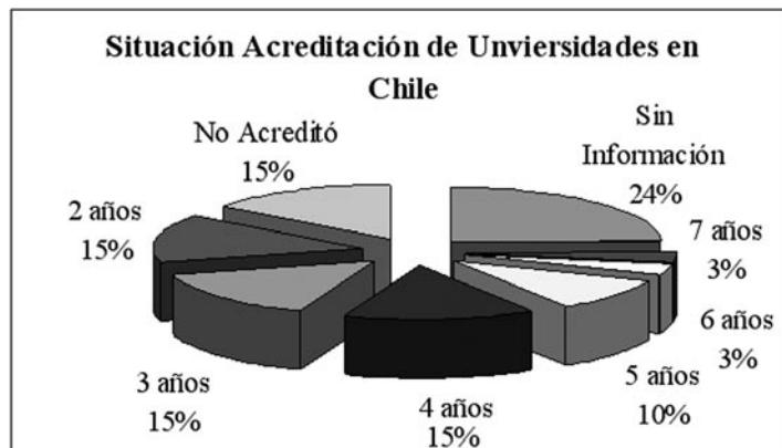
Gráfico 1: Resultado de proceso acreditación del total de universidades en Chile: Julio 2007

Entre las universidades que participaron en el proceso de acreditación se puede hacer un análisis con respecto al tipo de institución: el total de instituciones pertenecientes al Consejo de Rectores (o universidades tradicionales) se presentaron al proceso de acreditación institucional, logrando ser acreditadas 22 de ellas (88,0%) por períodos que van desde los 7 a los 2 años y tres (12,0%) no lograron ser acreditadas. En cuanto a las 36 universidades privadas existentes en el país, únicamente se cuenta con el resultado de acreditación de 21 de ellas (58,3% del total): 15 (41,7% del total de universidades privadas), lograron acreditar por períodos que van entre los 5 y 2 años y 6 no acreditaron (16,7%).