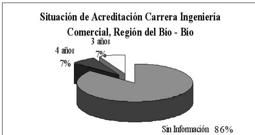
Gráfico 4: Situación de Acreditación de la carrera Ingeniería Comercial en la Región del Bío – Bío: julio 2007

Del total de universidades que sí ofrecen la carrera Ingeniería Comercial en la Región, sólo dos han sido acreditadas por 3 y 4 años cada una, ambas son universidades que pertenecen al Consejo de Rectores (Universidad de Concepción y Universidad del Bío – Bío), las cuales corresponden a universidades que también fueron acreditadas institucionalmente. Ver gráfico 4.