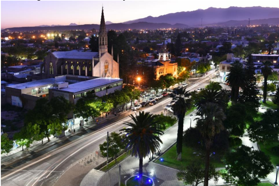
Figura 4. Ciudad de Godoy Cruz en la Provincia de Mendoza.