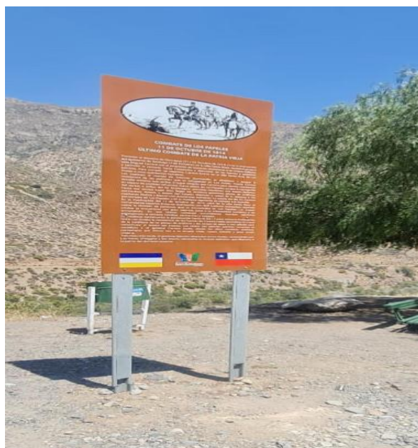
Figura 8. Foto personal sobre el Combate de los Papeles.