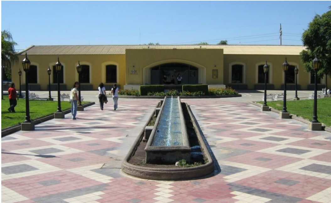
Figura 1. Museo Área Fundacional de Mendoza.