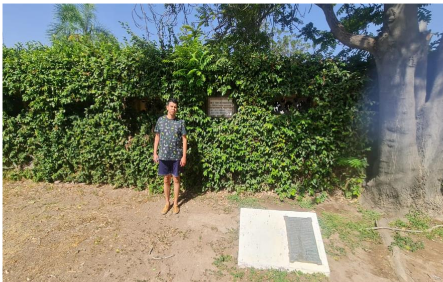
Figura 6. Foto personal del autor en el muro donde fueron fusilados los hermanos Carrera en Mendoza.