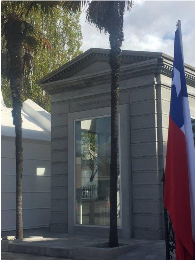
Figura 2. Panteón de la Patria en Concepción.