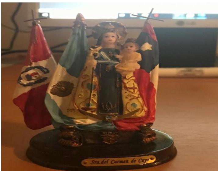
Figura 9. Foto personal del autor sobre figura de la Virgen del Carmen de Cuyo.