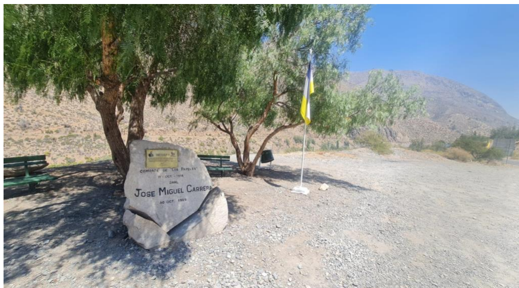
Figura 7. Foto personal sobre el Combate de los Papeles.