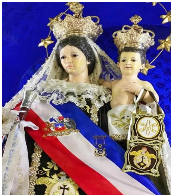
Figura 10. Virgen del Carmen del Ejército de Chile.