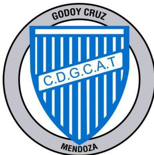
Figura 5. Escudo del Club Atlético Godoy Cruz Alejandro Tomba.