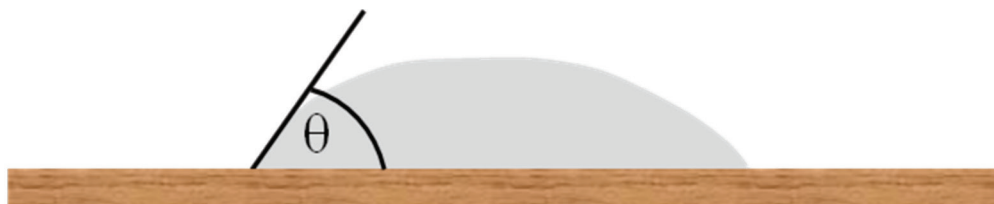
Figura 1. Humectabilidad: Determinación del ángulo ( \theta ) formado entre la gota de ureaformaldehído (65 % de sólidos) y la partícula de madera de L. philippiana .