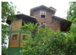
Residência 01, EMPRESA A