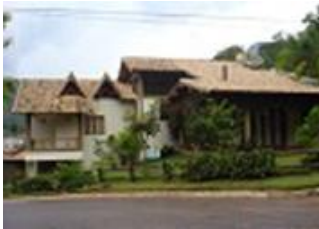
Residência 01, EMPRESA B