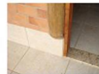
Possíveis medidas construtivas para afastar as peças de madeira do solo