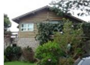
Residência 03, EMPRESA B