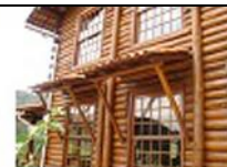
Proteção das janelas com coberturas exclusivas

As esquadrias são locais propícios ao acúmulo de água quando expostos a ação da chuva. Sendo assim, a sua proteção torna-se medida desejável para o bom desempenho do subsistema.