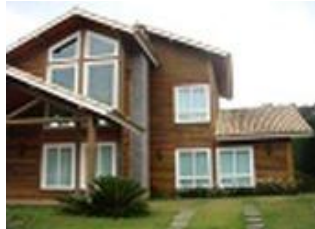
Residência 02, EMPRESA B