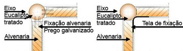
Ligação entre estrutura e alvenaria com prego galvanizado

A ligação da madeira com outro tipo de material, como a alvenaria de vedação, é considerado como ponto crítico no correto desempenho da edificação. No caso da residência 01B, é possível identificar que o projeto especifica detalhadamente esse encontro de materiais, porém na avaliação técnica foram observadas inúmeras frestas internas aparentando um “descolamento” entre a estrutura e a vedação, fato que causa desconforto visual em relação aos conceitos estéticos. Já a residência 02A não possui projeto específico para a construção em madeira. As figuras apresentam as propostas desenvolvidas para solucionar o problema detectado.