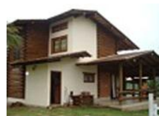
Residência 03, EMPRESA A