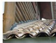
Sistema de drenagem de águas pluviais utilizados em algumas residências avaliadas