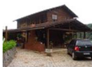
Residência 02, EMPRESA A