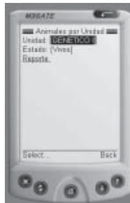
Figura 2. Presentación del simulador M3Gate con formato de PDA.