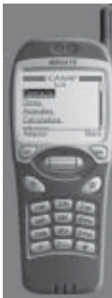
Figura 1. Presentación del simulador M3Gate con formato de teléfono.

Para el almacenamiento de la información se utilizaron bases de datos relacionales, implementadas en Microsoft Access 2000, pues este sistema para el nivel de profundidad que tiene el sitio WAP es suficiente y brinda grandes facilidades para conformar las bases de datos, mantiene buena integridad de los datos, las relaciones se crean de manera visual, etcétera. También pudo haberse utilizado otro gestor de bases de datos como el SQL Server y el Oracle.