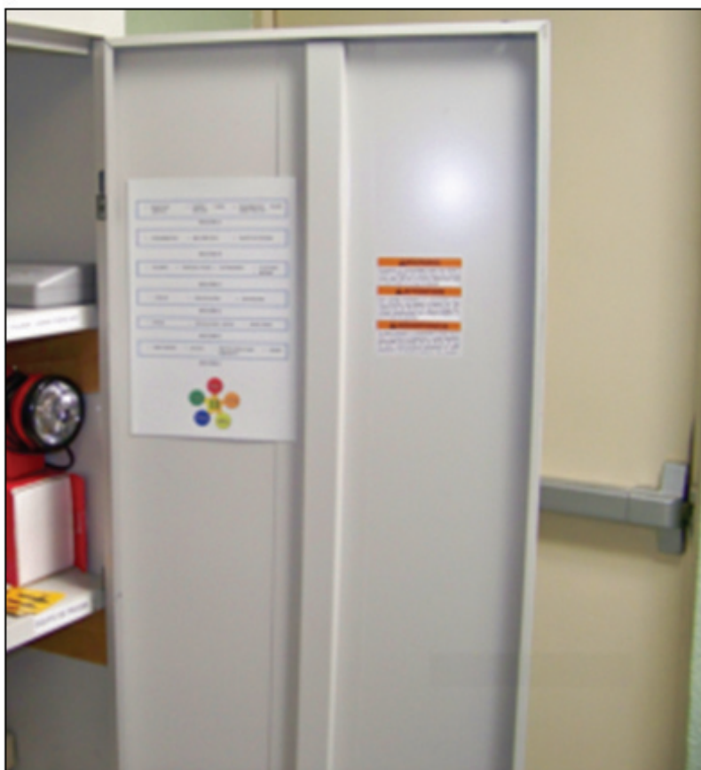
Figura 2. Salida de emergencia en incumplimiento con norma.

Respecto a los niveles 2 y 3, las rutas de evacuación cumplieron con lo establecido por los términos de referencia y las listas de verificación antes mencionadas; sin embargo en los señalamientos hubo ligeros cambios debido a que no cumplían con lo establecido en la normativa. Ejemplo de esto son las alturas de colocación, lugar de ubicación, colores de señalamientos, claridad en las imágenes, por mencionar algunos. Otra de las directrices con las cuales no cumplían la normativa los niveles 2 y 3 fueron las salidas de emergencia, debido a que la norma establece que las salidas de emergencia no deben estar obstruidas por objetos (Figura 2), también prohíbe que las salidas se encuentren bloqueadas por cerraduras.