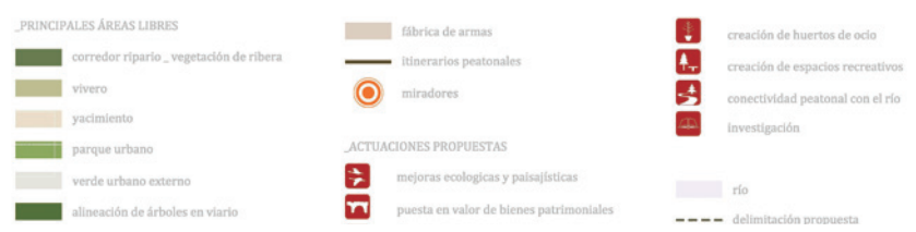
Figura 3 Actuaciones propuestas