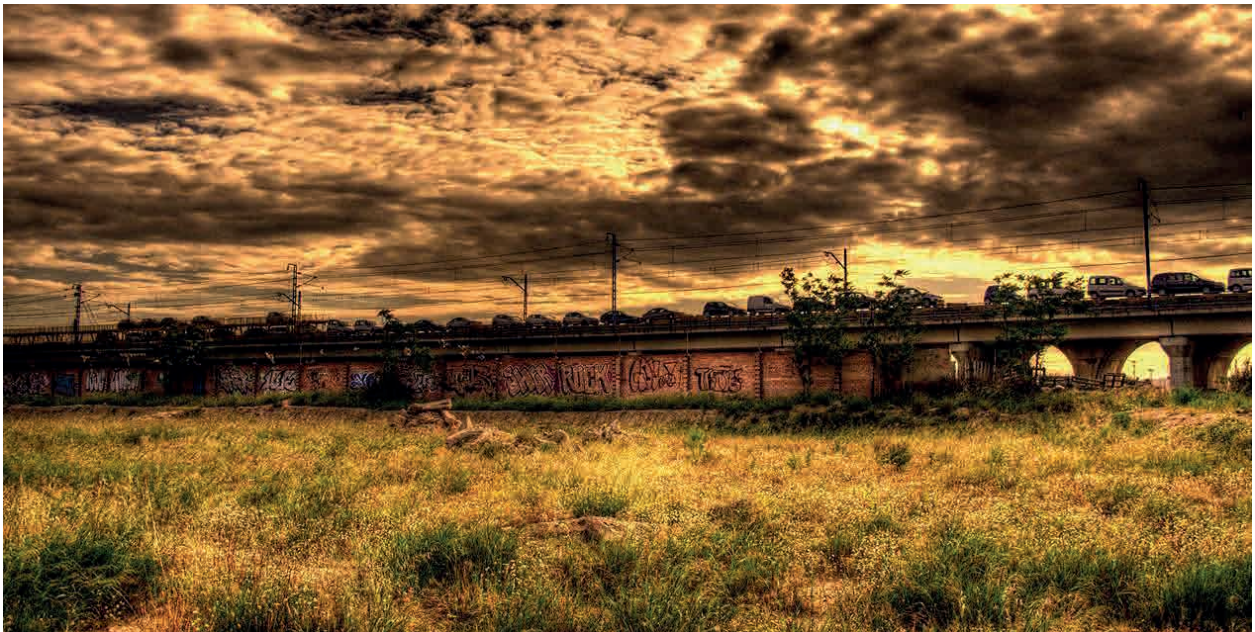
Figuras 2. Vacío Urbano de Zaragoza. Área 3.

provocado la expansión urbana de manera que la forma esta ha ido adquiriendo está cada vez menos ligada a factores físicos. Además, han aparecido nuevos desarrollos urbanos que resuelven sus usos y necesidades de un modo autónomo de la ciudad centralizada, basados en conceptos como la conectividad, las sinergias o realidades ya no físicas.