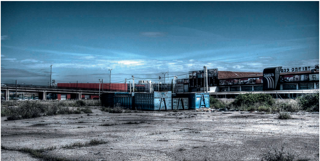
Figuras 1. Vacío Urbano de Zaragoza. Área 1.