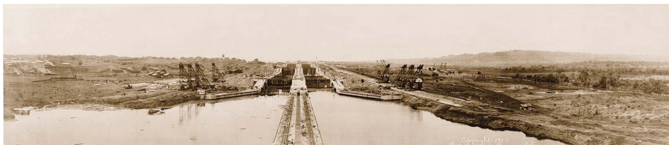
Construcción de esclusas en el canal en 1913.

La nueva República de Panamá, representada por Bunau-Varilla, concede a EE. UU. los derechos a perpetuidad