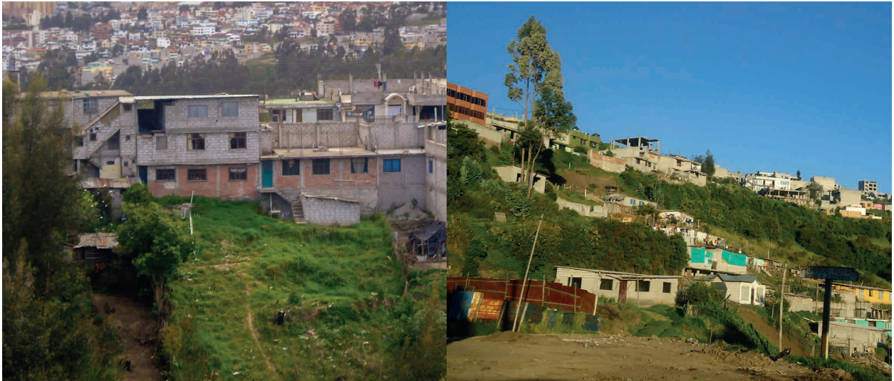
Figuras 1. y 2. Barrios periféricos espontáneos en Bogotá (Colombia) y Quito (Ecuador) respectivamente.