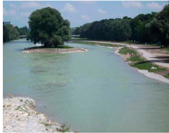
Figura 1. Río Isar (Munich). Antes y después de la restauración.