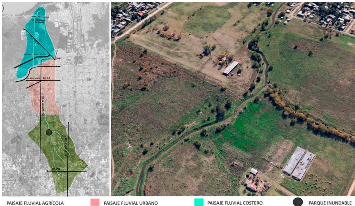
Figura 4. Estrategia proyectual (sectores) y parque inundable.