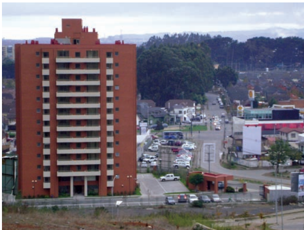
Avenida Los Canelos en Concepción.

anteriores, si consideramos, como promedio de elaboración 420 días corridos y comparando con los resultados de este estudio, para el caso de los PRC inconclusos, el 76% de estos debieron haber sido terminados según las fechas de inicio registradas en este estudio (Cuadro 3).