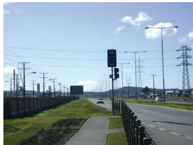
Sector Hualpén en Concepción

En este marco, este estudio permitió conocer, la percepción de algunos de los actores involucrados. En el caso de profesionales de la Secretaría Regional Ministerial de Vivienda y Urbanismo de la Región del Biobío, manifiestan una percepción positiva con respecto a las bondades del PR en temas relacionados con la conectividad y accesibilidad vial, así como en aspectos ambientales, los que en general, estarían cubiertos en el PRC. Sin embargo, las vías principales o estructurantes de algunas comunas como San Pedro de la Paz, en horas pick quedan colapsadas, situación que podría estar dando cuenta de que los IPT no estarían respondiendo a las necesidades actuales (Cuadro 5). Estos problemas del transporte urbano no se resolverán si son ignorados en las políticas habitacionales y en las de localización de equipamiento y fuentes laborales (Betsalel 2001). En este marco el reciente terremoto de febrero de 2010 tendrá serias implicancias en el próximo plan regulador.