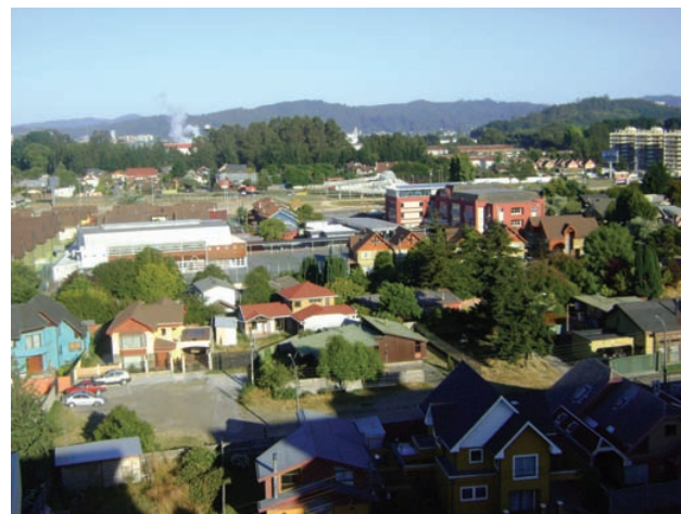
La planificación urbana facilita la coherencia en la organización de las actividades en los distintos espacios

Dada la importancia de los PRC, a comienzos de los años 90 y como una de las principales tareas que se planteó el gobierno de la época fue iniciar un proceso de actualización y modernización de la administración pública en todos sus niveles, en él se plantearon dos objetivos principales (1) hacer más eficientes los servicios públicos y (2) fortalecer la democracia por medio de una gestión pública participativa (Comité Interministerial de Modernización de la Gestión Pública 1994-2000 en Montecinos, 2006). Para dar cumplimiento a estos objetivos, los municipios fueron integrados completamente, y a partir del año 1994 la Subsecretaría de Desarrollo Regional y Administrativo (SUBDERE) a través del Programa de Fortalecimiento Institucional Municipal (PROFIM), comenzó la modernización de tres instrumentos de planificación local para incorporar en éstos nuevas tecnologías y fortalecerlos, dichos instrumentos son, según la Ley Orgánica Constitucional de Municipalidades N° 18.695, (1) El plan Regulador Comunal, (2) el Presupuesto Municipal y (3) el Plan de Desarrollo Comunal (ver Montecinos, 2006).