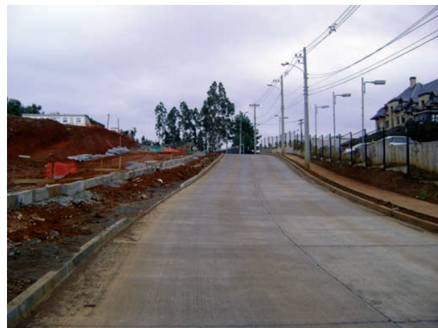
Urbanización fundo El Venado en Concepción

Para disminuir la brecha de las comunas sin PRC se requiere un esfuerzo especial de los organismos públicos,