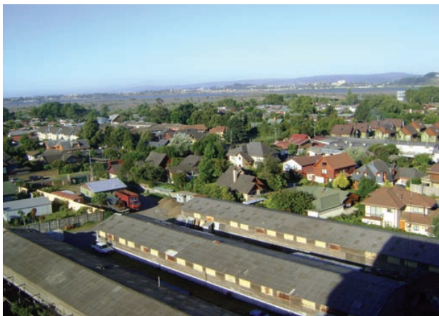
Urbanización cercana al río Biobío, aledaña al puente Juan Pablo II en Concepción

Contar con un PRC actualizados permite, en el ámbito normativo (1), fomentar la construcción de casas y departamentos en barrios que hoy lucen abandonados y deteriorados, (2) ampliar la facultad de los municipios para expropiar viviendas y así mejorar por ejemplo, la conectividad vial, (3) normar mayores alturas para que así las inmobiliarias inviertan en terrenos y los propietarios puedan acceder a otros barrios, (4) recuperar los barrios antiguos, (5) desincentivar la construcción de edificios insertos en sectores residenciales en donde prevalecen las casas (Revista Se Construye, 2009 9 ). Asimismo, los planes reguladores actualizados permitirían en el ámbito económico: (1) atraer inversión que busque valorizar las cualidades de la comuna (DDU 2009), y (2) responder a la necesidad de proyectar adecuadamente el crecimiento de las ciudades en el futuro, incorporando criterios de integración, sustentabilidad y participación social (Declaración Ministerio de Vivienda y Urbanismo, 11 abril 2007, refiriéndose a la actualización del PRMS 10 ). Bajo estas consideraciones se cumpliría con un requisito importante mencionado en la circular 55 de la DDU (2009): ser oportunos. En este contexto, en algunas comunas del gran Santiago se están acelerando los procesos de aprobación de Planos Reguladores, puesto que de lo contrario estas crecen sin normas y con aumentos crecientes de los conflictos urbanos que se instalan sin una regulación adecuada.