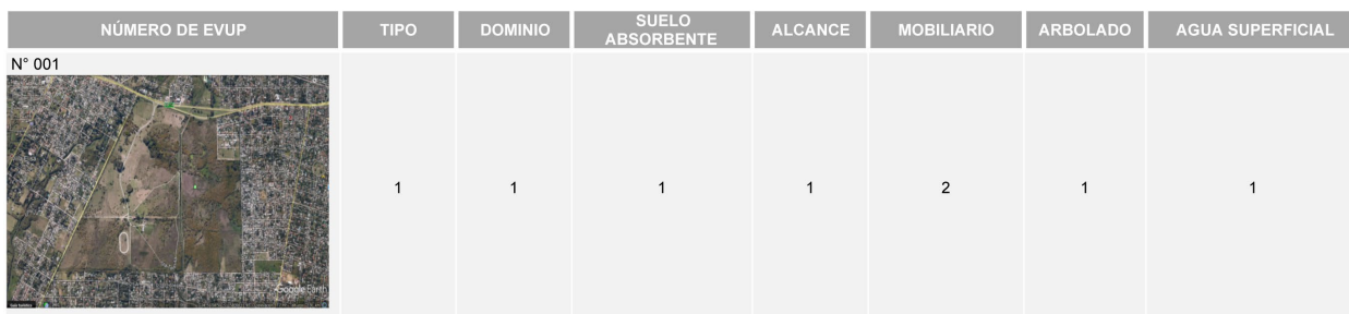
Tabla 3: Ejemplo matriz de datos con un EVUP.