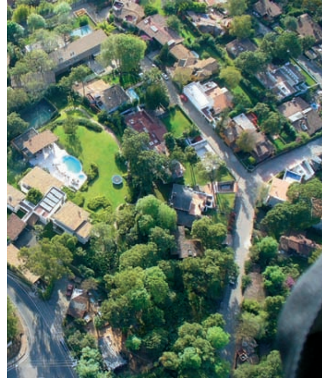
Vista de un sector residencial de la urbanización de Valle de Bravo. Ser observa la ocupación, crecimiento y expansión natural del suelo urbano.

Una vez que el suelo ha adquirido un valor, a éste se le puede atribuir una plusvalía, que según Marx (1988) define como el resultado de todas las mejoras que a un bien le asigna valor; esto es, el excedente de valor que sus propias mejoras le otorgan. Por lo que el valor asignado a un bien, en función de mejoras en su entorno equivaldría a la capacidad que éste tiene para generar plusvalía; de esta forma, dicha condición se convertiría en un factor determinante para quien se interese en realizar una transacción la pueda llevar a cabo, es decir, al momento de realizar una compra-venta de una mercancía; en este caso nos referiríamos al suelo. Al ser retomados estos puntos por Harvey (1988) al área ur-