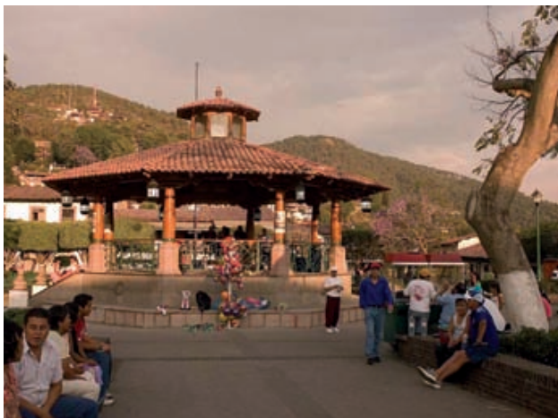
Plaza de Valle de Bravo, centro del desarrollo urbano y turístico del municipio.

que es a partir de 1970 cuando se consolida con tasas de crecimiento superiores al 4.0% anual (Estadísticas INEGI, 1970).