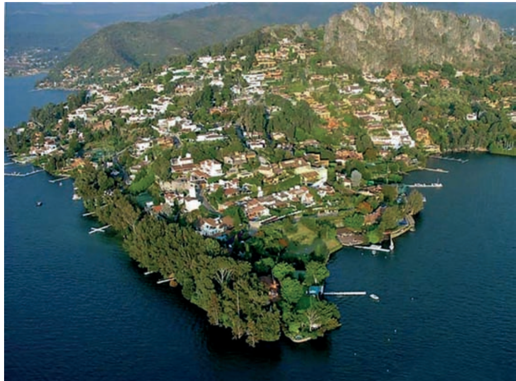
Ciudad típica de Valle de Bravo a orillas del lago artificial Avándaro, inserta dentro del sistema hidroeléctrico Miguel Alemán, al SO de Ciudad de México.

Keywords: Soil housing, value, foreign agents, economic activities.