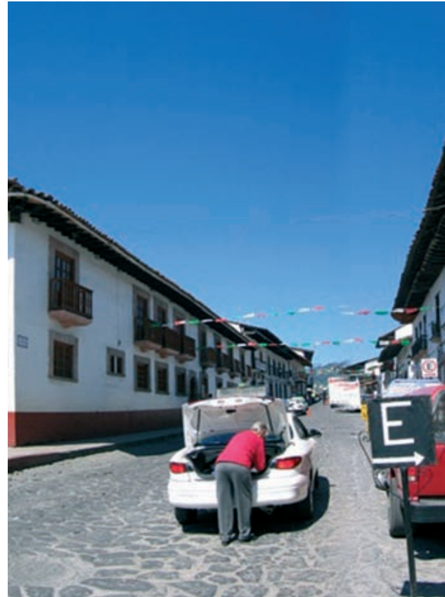
Callejuelas coloniales conforman en el centro de la localidad, una interesante oferta de uso de suelo habitacional de gran valor.

La administración municipal deberá asumir un papel más activo pasando de ser un espectador a ser concertador de acciones y decisiones que según sus atribuciones de gobierno local lo permitan.