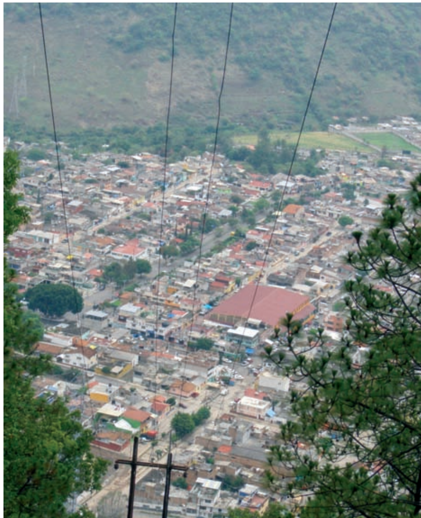
Localidad de Colorines, situada en el Municipio del Valle de Bravo, fundada en tiempos de la "revolución eléctrica" de México, con el proyecto hidroeléctrico de Ixtapahongo.

Si bien en 1960 se empieza a explotar el atractivo turístico, abriéndose a la oferta de suelo urbano y vivienda e inversiones en infraestructura urbana; el crecimiento es poco significativo, ya