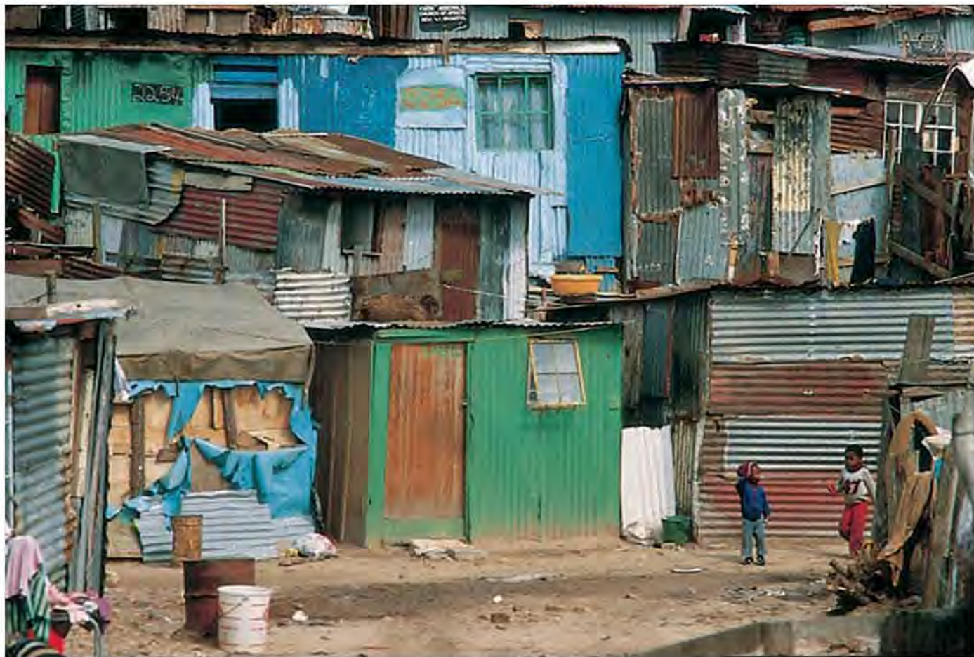
Un hecho que golpea fuertemente la conciencia de las personas lo constituye la realidad de familias que viven en las áreas urbanas en condiciones de extrema marginalidad y desvinculadas del mercado de bienes y servicios.

situaciones de exclusión, o de vulnerabilidad se hacen más visibles, surge la inquietud social, se plantea de nuevo la necesidad política de abordar el tema de alguna manera, y se acude a nuevas teorizaciones de las causas del malestar que se ha de abordar.