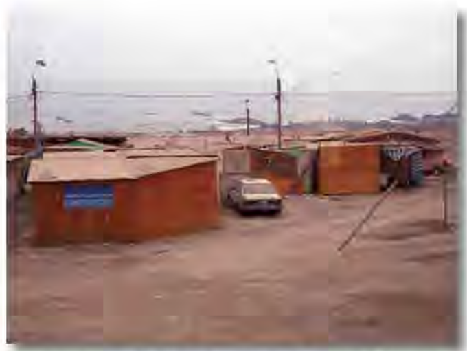
Barrio transitorio en Tocopilla, viva expresión de un sector desfavorecido en la ciudad con una creciente insostenibilidad ambiental.

La ciudad se organiza espacialmente con una segregación funcional de barrios "unidimensionales" que no permiten la vida local cotidiana ni satisfacer muchas necesidades sociales en el entorno próximo.