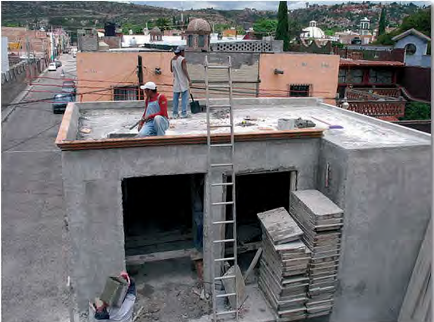
La caracterización de barrios pobres y desfavorecidos permanece incluso en los casos de realojo o mejoramiento de las viviendas en su calidad, dado que la población no tiene los mismos problemas sociales y económicos.

Salvo que se produzcan renovaciones de la parcelación y/o la edificación, los barrios tienen unas posibilidades limitadas de transformación de sus viviendas y por lo tanto tendrán una distinta capacidad para soportar la ocupación por otros grupos sociales a lo largo del tiempo. En general, los barrios con viviendas de peor