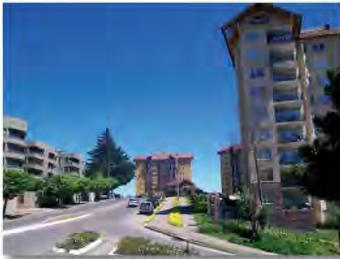
Andalú, un nuevo sector residencial en San Pedro de la Paz, comuna de creciente desarrollo y proyectado como barrio rico por el mercado inmobiliario.