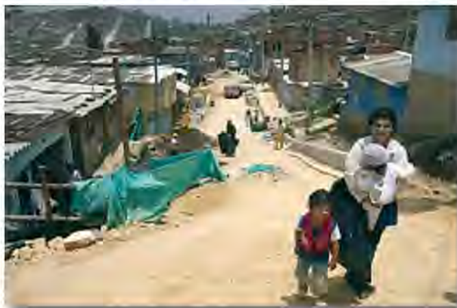
Los barrios pobres, por lo general, están poco cuidados por la administración, con degradación ambiental, servicios deficientes y mala accesibilidad.

Por un lado, el medio urbano del barrio influye en el declive de los más desfavorecidos a través de elementos como: la degradación de edificios, falta de locales, escasa apropiación de los espacios públicos por la vida local (consecuente vandalización e inseguridad), contaminación de suelo, agua o aire, escasez de atractivo del espacio