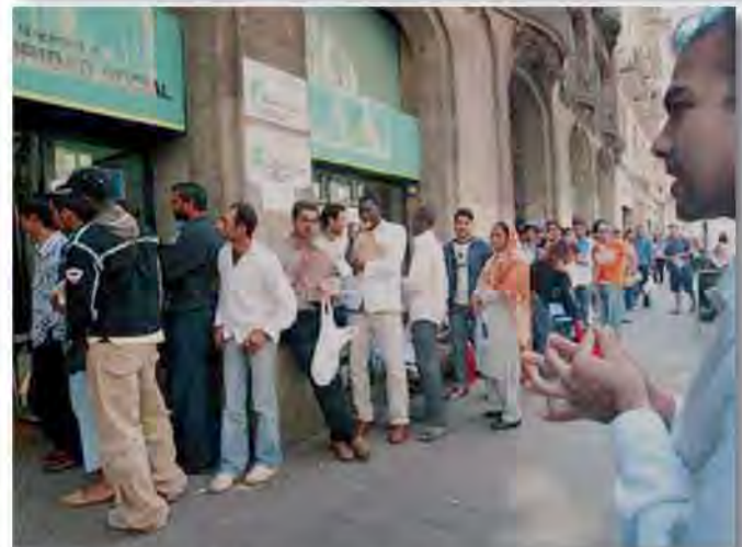
Imágenes de inmigrantes en el barrio El Rastro, en Madrid, de gran vulnerabilidad social y con serias disfunciones sociales y económicas.

alidad y difícil transformación, tienden a mantenerse como barrios desfavorecidos (algunas zonas de cascos y arrabales, casas bajas de zonas incorporadas a la ciudad, vivienda marginal periférica, etc.).