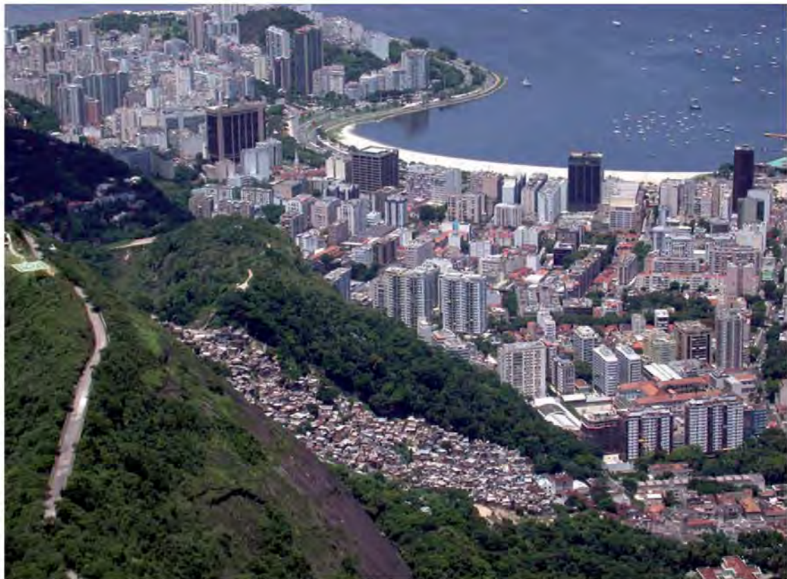
Los asentamientos irregulares de Río de Janeiro, llamados favelas, se ubican como telón de fondo de la zona turística de bordemar, revelando la gran desigualdad existente entre sus habitantes urbanos.

Keywords: inequality, social organization, society, urban community