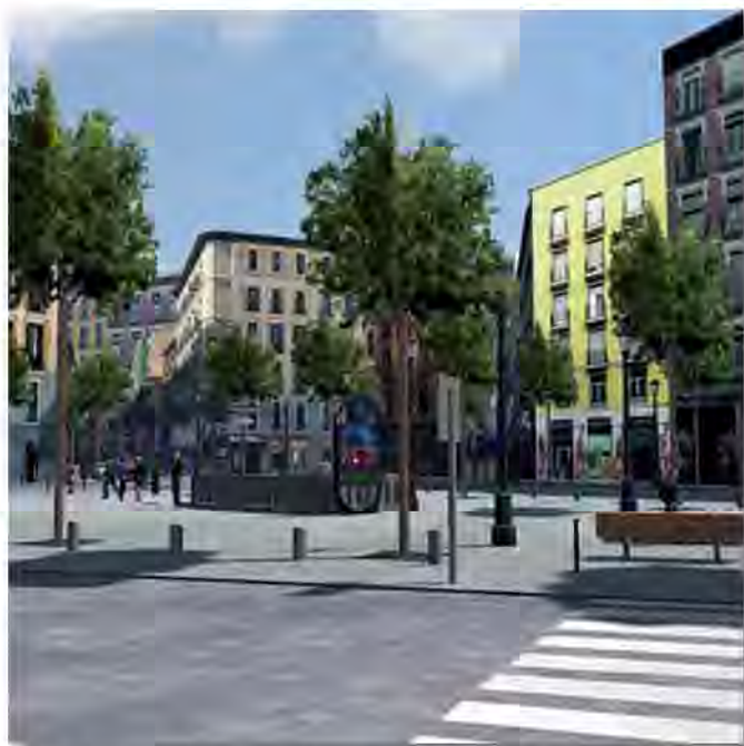
Obra del grupo Fiambrera Obrera que reconstruye el barrio madrileño de Lavapiés

El análisis cuantitativo del desfavorecimiento no se pretende llevar más allá de la localización de las zonas con mayor desigualdad en varios indicadores. Se trata de avanzar en el entendimiento de los