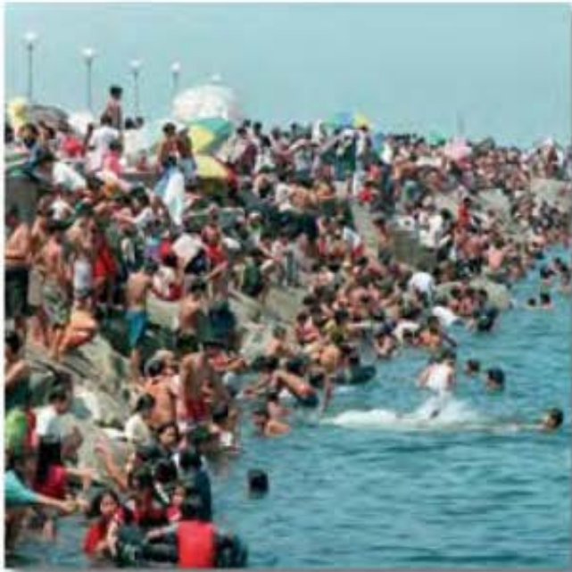
Aspectos de saturación de los espacios turísticos, no contribuyen a la sustentabilidad del turismo.

presente sin comprometer la capacidad de las generaciones futuras para atender las necesidades de ellas.