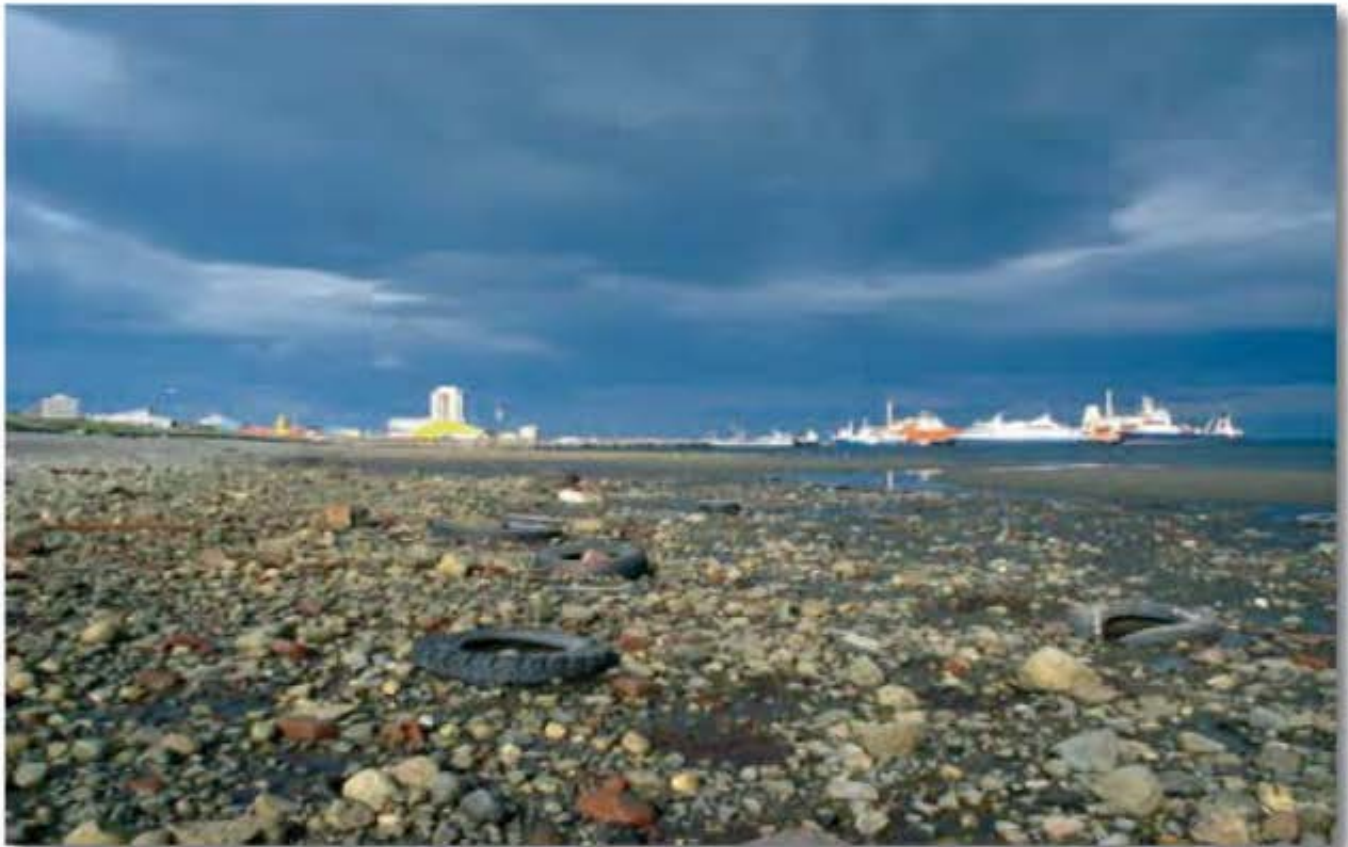
El Turismo de los grandes desarrollos de inversión, sufren grandes alteraciones sobre el ambiente cuando los entornos geográficos de las poblaciones residentes, no asumen responsablemente su propia sustentabilidad.

La definición de sustentabilidad provocó -y aún provoca- un gran debate académico. Algunos autores como Guimares (1997)