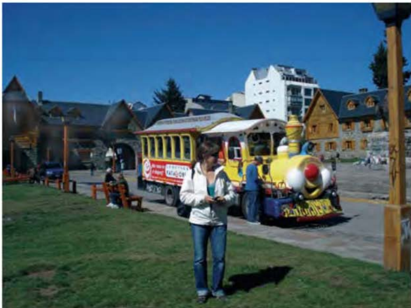
Actividades turísticas urbanas requieren para su sustentación el desarrollo de equipamientos e infraestructuras apropiadas, que no sólo satisfagan las necesidades externas del turismo, sino también de la población local. San Carlos de Bariloche, Centro Cívico.