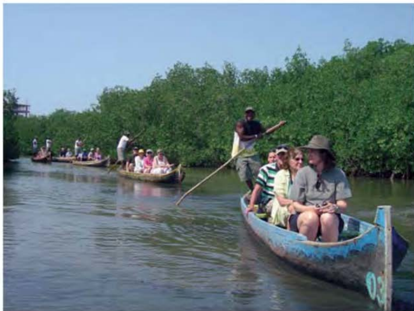
Ecoturismo en Cartagena de Indias-Colombia. Excursión en canoa por los Manglares de La Ciénaga de la Virgen de Cartagena de Indias.

Diversos estudios señalan que el desarrollo turístico con bases sustentables es una exigencia de la cual no se podrá escapar en un futuro próximo, ya que además de la cuestión ambiental que hace referencia a todo y a todos, es necesario para la supervivencia del turismo. Esos estudios comprueban que muchos emprendimientos turísticos implementados durante los últimos cuarenta años han ocasionado una serie de impactos ambientales, sociales, culturales y económicos en las regiones receptoras (Silveira 2002). Es en este contexto que está tomando fuerza la propuesta que defiende la promoción de un desarrollo turístico más sustentable. Sin embargo, en términos prácticos los principios básicos del turismo sustentable todavía están lejos de ser aplicados a la planificación y al del desarrollo turístico. Esto se debe a varios obstáculos que han dificultado la comprensión del verdadero significado del concepto por lo que se ha bloqueado su implementación en la práctica de manera más efectiva.