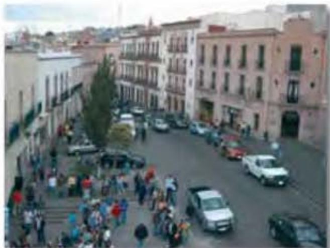
El turismo cultural, es también un escenario de gran proyección en la sustentabilidad del sector turístico.

Se señaló que hacia fines de la década de 1980 surgió la preocupación por los impactos ambientales y socioculturales negativos como consecuencia del crecimiento turístico y comenzó el debate sobre la sustentabilidad. El turismo sustentable presta una mayor atención a la vulnerabilidad del medio ambiente, es decir, a los impactos negativos ocasionados por el turismo en los destinos y la urgencia de considerar en el desarrollo turístico la preservación de los recursos naturales y culturales a mediano y largo plazo.