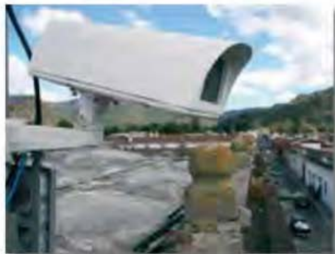
Cámaras de seguridad vigilan discretamente, la seguridad de los visitantes de Antigua, Guatemala.

Finalmente, hay que destacar el hecho de que los gobiernos, los agentes privados y las poblaciones locales están cada vez más conscientes de la extraordinaria capacidad del turismo para generar profundas transformaciones en la organización del territorio, principalmente en el ámbito regional y local. Transformaciones que provocan profundas modificaciones en el paisaje y causan impactos negativos en el medio ambiente. Esto demuestra la necesidad de