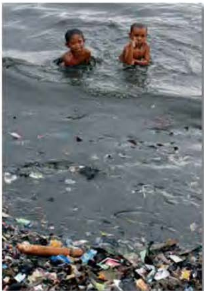
La pobreza, es y seguirá siendo, un obstáculo al logro de la sustentabilidad ambiental, urbana y turística.

argumentan que, si bien el concepto impulsado por el Informe Brundtland trajo algunos avances en comparación con otros documentos que trataron este tema con anterioridad, no llega a ser innovador o radical. La principal crítica está dirigida al carácter del concepto expresado por el Informe que al dejar oscuro su significado permite varias lecturas que van desde un significado avanzado de desarrollo asociado a la justicia social, la participación política y la preservación ecológica hasta una lectura conservadora que se asemeja al concepto de crecimiento económico al que solamente se agregó la variable ecológica.