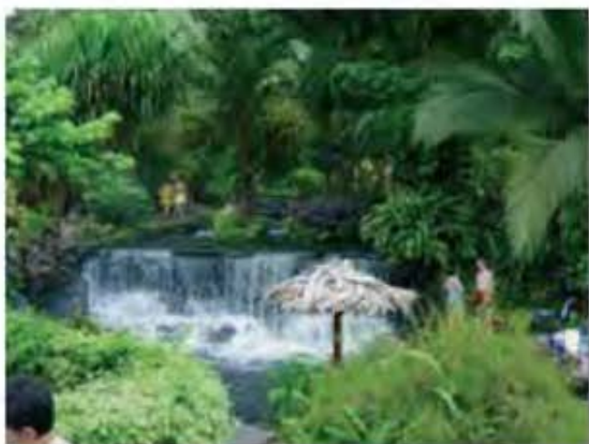
El concepto de turismo sustentable, derivación del Informe Brundtland, de 1987, se entiende como la atención de las necesidades turísticas presentes sin comprometer su capacidad en las generaciones futuras de atender las suyas.

Uno de los grandes desafíos en la actualidad para los gobiernos, instituciones privadas, investigadores y planificadores, es cómo promover el desarrollo del turismo evitando los impactos propios