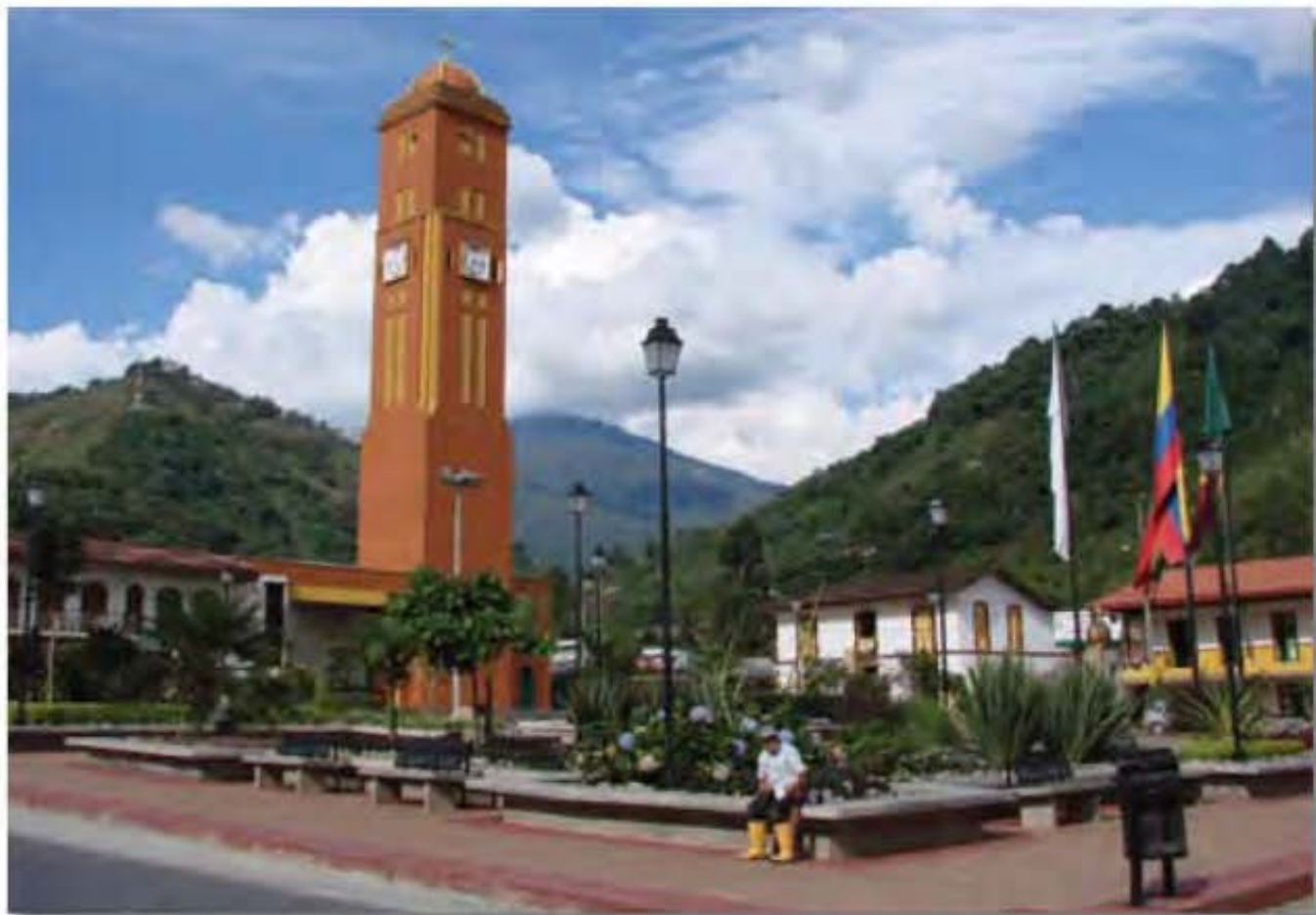
Programa Desarrollo Turístico Sostenible "Pijao Ciudad Sin Prisa", de Colombia, muestra algunas de las cruzadas urbanas destinadas a resaltar la sustentabilidad de su desarrollo local.

En síntesis, para que el desarrollo turístico sea sustentable debe ir al encuentro de las necesidades de la población local, garantizar la protección del medio ambiente, satisfacer la demanda turística actual y -haya o no incrementado el número de turistas- mantener la atracción del lugar al igual que su calidad ambiental. Por otra parte, para que la actividad turística sea sustentable debe tener eficiencia económica, condición necesaria para que se cumplan las finalidades anteriores. Es decir, al igual que para las demás actividades productivas, para el turismo el imperativo económico termina siendo un requisito indispensable en la búsqueda de la sustentabilidad.