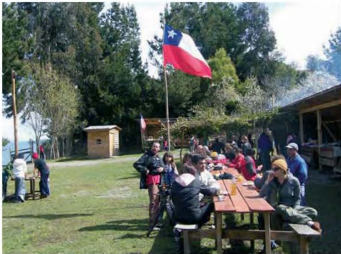
Nuevas modalidades del Turismo, surgen a partir de la sustentabilidad, siendo el turismo ambiental una de sus líneas de mayor expansión.

de la actividad. Es decir, desarrollar un turismo más sustentable en términos ambientales, socioculturales y económicos. Es en este contexto, que a partir de fines de la década de 1980 y principios de la década de 1990, se difundió la idea del desarrollo sustentable del turismo. La noción de sustentabilidad ganó un significado propio y dió origen el concepto turismo sustentable , expresión controvertida y abordada recientemente por diversos autores como Cater (1994), Inskeep (1991) Hall y Lew (1997), Wahab y Pigram (1997), Garrod y Fyall (1998), OMT (1998; 1999), Swarbrooke (2000), entre otros.