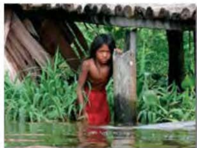
El Proyecto Amacayacu para salvar el Amazonas, una iniciativa que une a dos civilizaciones a través de la ciencia y del desarrollo sostenible, con el fin de hacer de los indígenas, auténticos "guardianes de la biodiversidad".