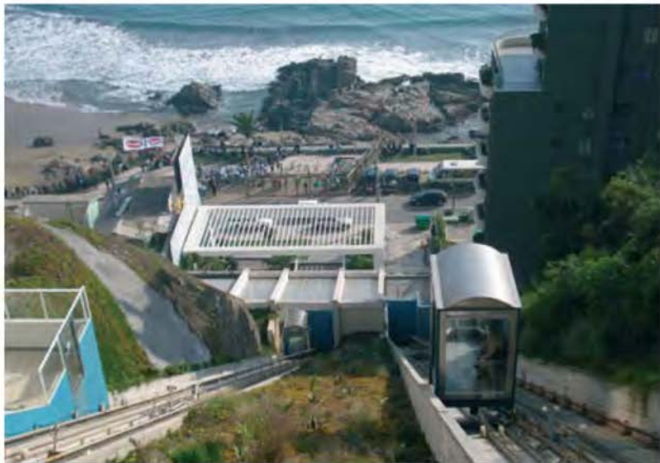
El desarrollo de los proyectos inmobiliarios en el borde costero debe considerar una óptima planificación de la infraestructura y edificación, respetuosa y no agresiva con el frágil medio ambiente de los entornos litorales.