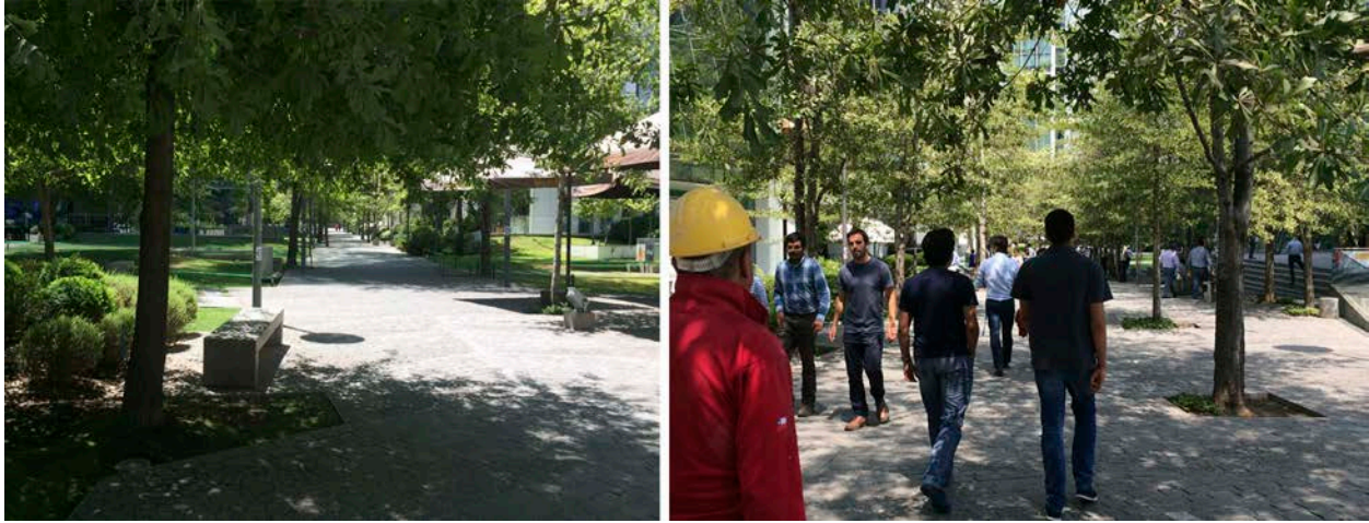
Figura 2. Uso del lugar en día laborable y en fin de semana, respectivamente. Registros del 6 y 10 de febrero de 2018.

como un “territorio social” (Lofland, 1998), uno que adquiere dominio público 4 cuando su espacio físico está dominado por relaciones entre personas que son extrañas entre sí. Jane Jacobs también describe ese tipo de relaciones, capaces de determinar el carácter público de las aceras, al señalar que “reúnen gente que no se relaciona de una forma íntima y privada y que, en la mayoría de los casos, no pretende llegar a hacerlo” (2011:83). Lofland (1998) observa, además, que los tipos de relaciones que las personas pueden establecer son fluidas y cambiantes, y que estas son capaces de transformar el carácter del espacio. De ello desprende, por ejemplo, que un parque público vacío no contiene dominio alguno pero, sobre todo, que un grupo considerable de personas tiene la capacidad de transformar el carácter del espacio en el que se encuentra. Este enfoque investigativo se recoge en el estudio de espacios comerciales de Schlack et al. (2017) y en el de Stillerman (2006) -del cual se referencia-, y orientan el análisis aquí expuesto para interrogarse en qué medida el espacio de propiedad privada estudiado presenta características que lo hacen participar del dominio público, y qué aspectos, tanto de su diseño, de la forma en que se utiliza, como de las características de sus usuarios, son relevantes para promover esa condición.