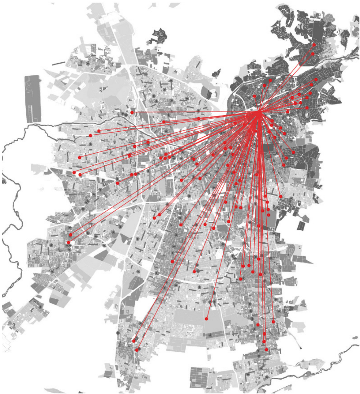
Figura 3. Comunas de procedencia de los encuestados sobre cartografía de grupo socioeconómico de Santiago.