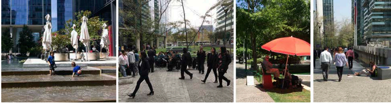
Figura 4. Actividades de permanencia y usos del espacio.

Las fachadas de primera planta incorporan comercio dedicado, en su mayoría, a cafés y restaurantes, más algunos servicios y abastecimientos básicos. Dichos comercios asumen la jerarquía en la oferta de actividades de permanencia desplegando terrazas que se vuelcan hacia el paseo central. Puntualmente, un centro cultural, un gimnasio y algunos locales del centro comercial componen los pocos destinos que atraen personas con fines recreativos.