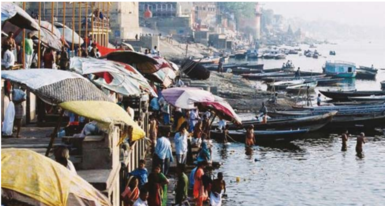
Escena urbana tradicional a orillas del sagrado río Ganges, característica del paisaje cultural y religioso hindú. En el Ganges se congregan tanto brahmanes, jóvenes haciendo yoga, mujeres bañándose, ancianos que vienen a morir a esta ciudad y mendigos, entre otros.