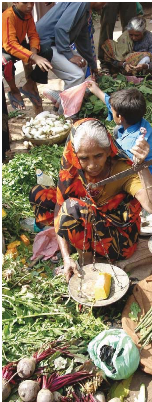
Imagen típica del comercio informal en la India, en los numerosos "mercados" públicos.

pografía y la geología de sus respectivos asentamientos, la trayectoria pasada de creación de infraestructuras, el tamaño de las poblaciones y otros factores económicos y políticos.