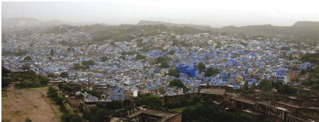
La ciudad azul de Jadhpur, que toma ese apodo de las paredes de las casas de los brahmanes, pintadas de añil para que todo el mundo sepa que allí vive una familia de la casta superior

Los Comités Financieros Estatales, constituidos mediante la Ley de Enmienda Constitucional número 74, están examinando actualmente los factores relevantes basados en la consideración de la capacidad fiscal de los organismos locales y de sus usuarios, la to-