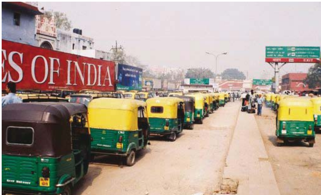
Imagen de un tipo de transporte público en un aparcamiento estatal, en una ciudad de la India.

Keywords: equity between men and women, legislation, local administration, regional planning, urban management