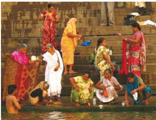
Práctica de lavado tradicional de mujeres indias con sus saris a orilla del río.

dado que la administración, a este nivel, se ocupa fundamentalmente de asuntos relativos a la calidad de vida, un tema en el que el papel de la mujer es relevante en cualquier sociedad.