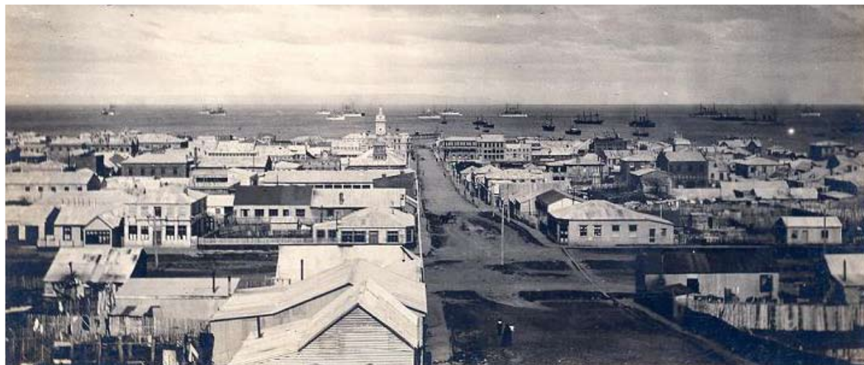
Vista de la Plaza Muñoz Gamero hacia 1910. El refinamiento de la clase burguesa, que impregnaba parte importante del cuerpo social, en su máximo esplendor.

producto de esta sociedad más diferenciada. Esta elite magallánica que gustaba de la elegancia, el lujo y la buena vida pronto comenzó a imprimir en los principales espacios urbanos este sello. Con un refinamiento propio de las clases burguesas que muy bien describe Chueca: