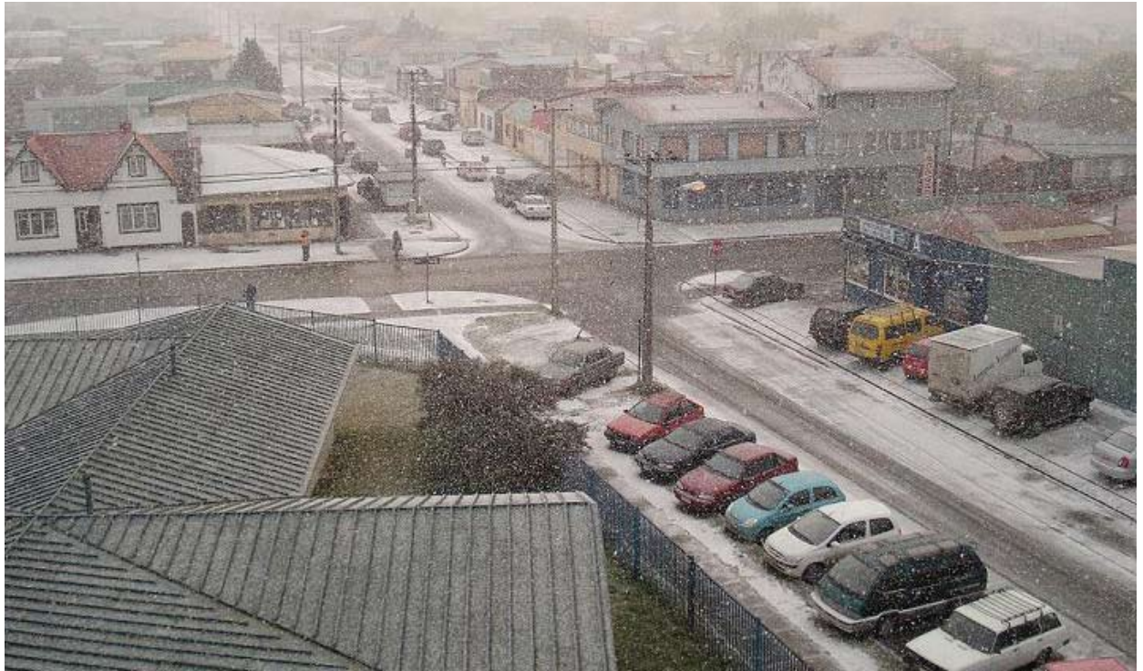
Visión de un paisaje invernal en la capital magallánica.

recalada obligada en la colonia, por otro lado las medidas de Puerto libre y de incentivo a la inmigración de colonos nacionales y extranjeros.