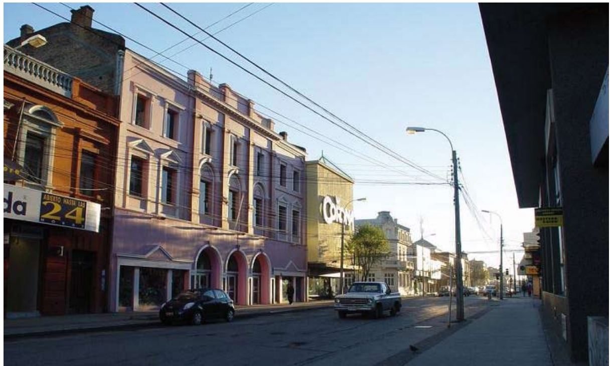
Paisaje urbano de Punta Arenas. Casco histórico central, calle Bosier.

KEYWORDS: social space, spacial occupation, pattern occupation