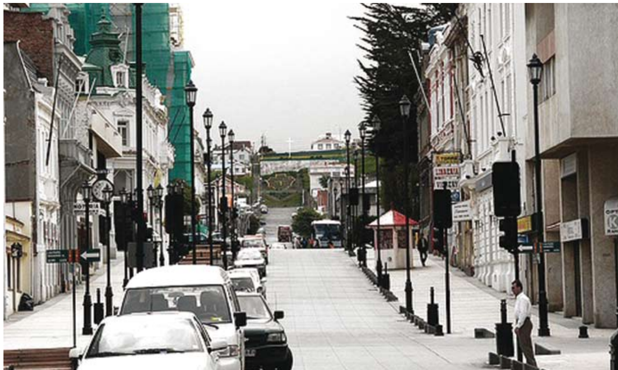
La riqueza arquitectónica de un pasado reciente en el centro puntarenense

ciudad: Punta Arenas. La estructura de ocupación territorial de la región aun hoy es funcional a esta forma de explotación económica del territorio, una gran ciudad que apoya una enorme extensión explotada extensivamente por la ganadería, actividad desarrollada en enclaves autosuficientes 16 que requieren marginal y concentradamente los servicios de una ciudad: el ecumene Magallánico. Enclaves que no propician el desarrollo de una estructura territorial robusta que permita ocupar un territorio, situación que se observa hasta hoy en día, donde antiguos cascos de estancias convertidos en municipios, no han dejado de ser caseríos. Hasta hoy el porcentaje de población rural de Magallanes es el más bajo de Chile. Esta forma de ocupación del territorio en grandes extensiones monopolizadas por un diminuto número de propietarios no permitió la diversificación de la base económica, consolidando fuertemente la economía regional sobre la ganadería lanar e impidiendo el desarrollo de otras actividades. Esta debilidad impondría otra tremenda inercia al desarrollo social de la región que se mantendrá fuertemente hasta nuestros días.