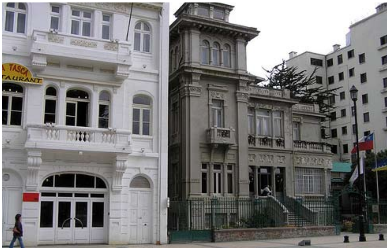
A la derecha el Palacio José Montes, otro hacendado ganadero. Diseñado por el arquitecto Miguel Bonifetti y construida en las postrimerías de la época de oro: 1923.

ducto de los factores descritos. No hay que olvidar el hecho que es el Estrecho de Magallanes, como hito geográfico mundial, el que determinó el desarrollo no sólo de Punta Arenas, sino también de la Patagonia e incluso, de alguna manera, de Chile. Nuestro País se inserta en el concierto mundial, en los flujos Marítimos de riqueza, a través del Estrecho. Esta situación explica, por ejemplo, el desarrollo de las ciudades-puerto, y su gran apogeo durante el siglo XIX: los casos de Valparaíso y Punta Arenas son elocuentes.