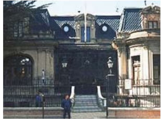
La casa de Mauricio Braun, obra del arquitecto francés Antoine Beaulier, uno de los mejores ejemplos del eclecticismo francés en la ciudad.

adquiridos, demasiado frescos. La nueva y poderosa burguesía los exhibió con esa falta de pudor y de medida propia de los nuevos ricos.” 7