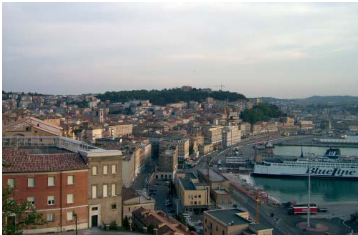
Ancona, Italia, reconocida como una importante ciudad educadora. Una entidad educadora es una ciudad visible con referencias físicas y simbólicas notables que ubiquen a su gente, como esta ciudad puerto.

es concebida esencialmente como de naturaleza civil. La ciudadanía política no es sólo de derechos formales, principalmente en cuanto al derecho a elegir y ser elegido; los derechos sociales no son demandables en un sentido positivo a menos que tengan una base contributiva.