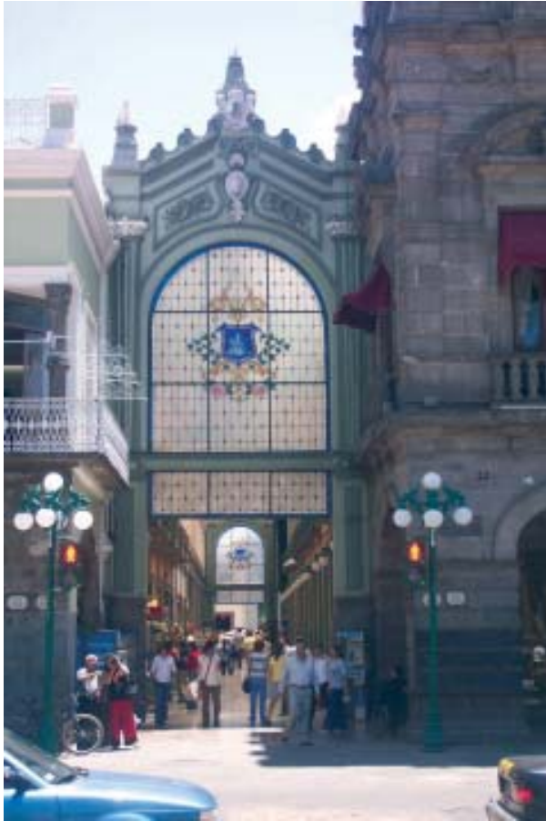
Puebla, ciudad mexicana de reconocido prestigio educacional, cultural y religioso. Su multifuncionalidad debe ser pensada dentro del esquema complejo que incluye la interacción de saberes y determinantes humanistas diversos

mocracia y la ciudadanía como un principio vital del hombre.