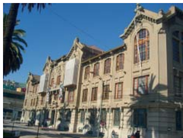
Frontis de la Universidad de Valparaíso, prestigiosa ciudad portuaria educacional, patrimonio de la humanidad de la Unesco.

Aunque el sistema jurídico las reconozca dondequiera, las situaciones para el ejercicio de la autorrealización humana encuentran en la ciudad la máxima intensidad. La