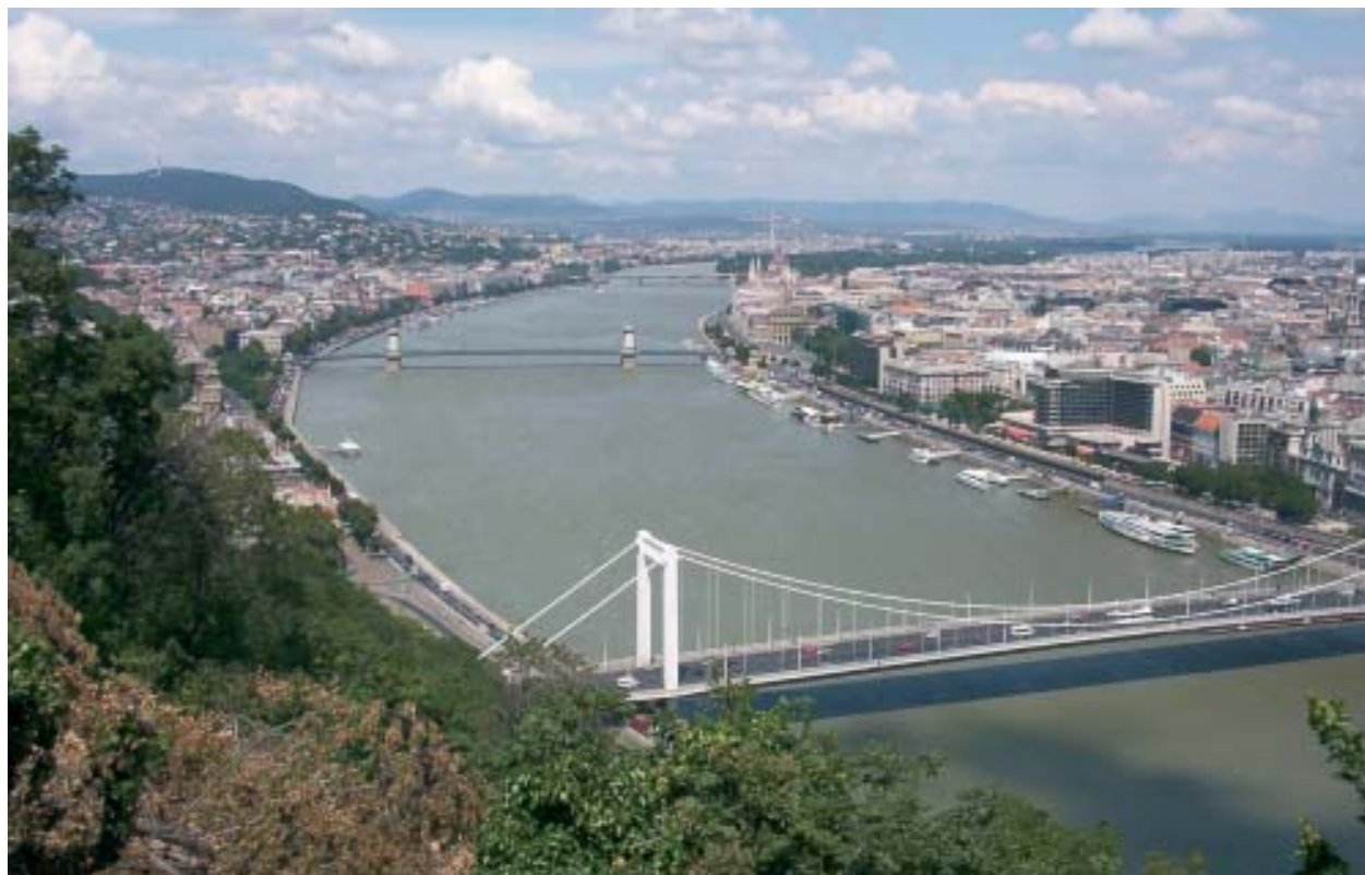
Budapest es reconocida como una de las más antiguas ciudades educadoras europeas. Los asentamientos históricos también constituyen una relación dialéctica entre el ser humano y el territorio.

políticas y administrativas que permitan un grado variable de autogobierno, algo que incluso puede hacerse por decreto. Y a renglón seguido conceptúa: “Construir socialmente una región (ciudad) es algo que debe hacerse desde y con la incipiente sociedad regional, toda vez que este proceso significa potenciar su capacidad de auto-organización, transformando una comunidad inanimada, segmentada por intereses sectoriales, poco perceptiva de su identificación territorial y en definitiva, pasiva, en otra organizada, cohesionada, consciente de la identidad sociedad-región, capaz de movilizarse tras proyectos colectivos, es decir, capaz de transformarse en sujeto de su propio desarrollo”. 24