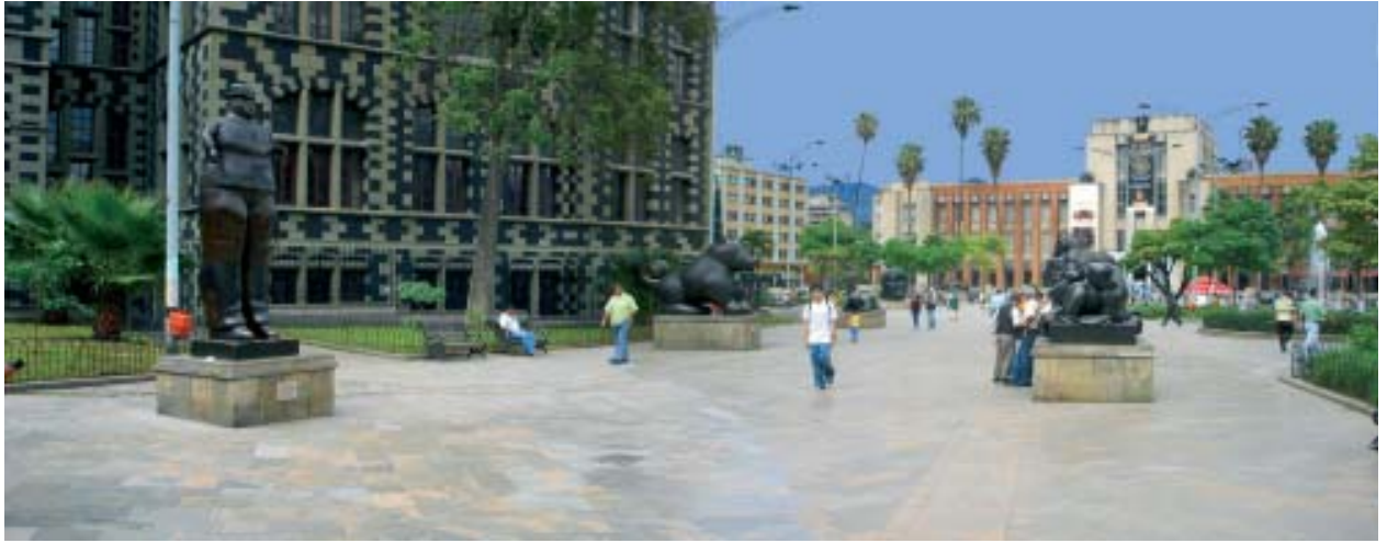
Plaza Botero en la ciudad de Medellín. Al fondo el Museo de Antioquia, Colombia. La ciudad educadora no es un fin predeterminado, sino una propuesta en continua construcción, una historia que permite avanzar por el camino que se ha de transitar.

permanencia placentera. Por eso se prodigaron tanto a partir del Renacimiento. Los edificios históricos, los barrios coloniales, que a veces se conservan con galantería de orfebre, son otra muestra del eclecticismo de esta cultura. Ella ya ha madurado lo suficiente como para respetar y convivir con las diferencias. La inserción de la historia en la ciudad, la asunción de su temporalidad, subraya, igualmente, el carácter relativista y fugitivo con que al nuevo ocupante le agrada plantear sus relaciones. La experiencia de la complejidad orienta naturalmente hacia la tolerancia.