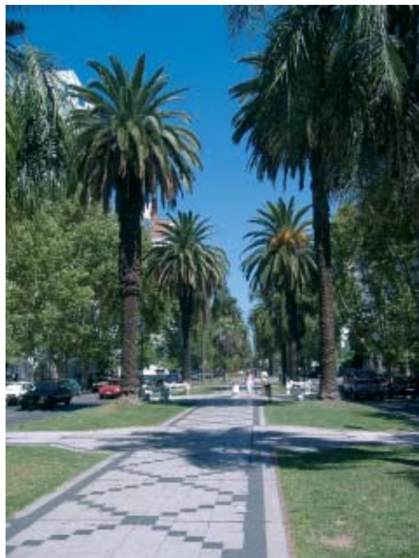
Una ciudad educadora no sólo requiere centros educativos, sino que exige aceleradamente servicios e información actualizada como componente básico de ese conocimiento. Bulevar Otoño, Rosario, Argentina.

Pero otro caso especial está en el pensamiento de Kant cuando describe su ciudad y la propone como ideal: «Una gran ciudad, el centro de un reino, en la que se encuentren los órganos del gobierno, que tenga una universidad (para el cultivo de las ciencias), y además una situación favorable para el comercio marítimo, que facilite un tráfico fluvial tanto con el interior del país como con otros países limítrofes y remotos de diferentes lenguas y costumbres, - una tal ciudad, como por ejemplo Kónisberg a la orilla del Pregel, puede ser considerada como un lugar adecuado para el