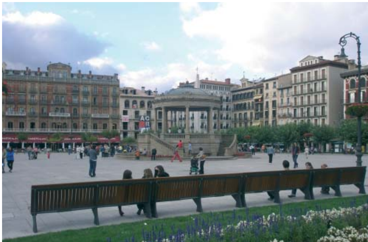
Pamplona, centro de la tradicional fiesta de San Fermin. Plaza Castillo. La ciudad actual es cuerpo y contexto de ciudadanías diversas y multiplicidad cultural siempre en movimiento.

La inclusión política está directamente ligada con lo que puede considerarse ciudadanía formal y con la participación o no como ciudadanos en la marcha de la sociedad. La política en el entendido de transformación del conflicto, donde el desarrollo político entra como parte del desarrollo social y el desarrollo de la democracia como parte del desarrollo político. La inclusión económica y la social están relacionadas con la participación de la vida colectiva y pueden distinguirse dos ejes: por un lado, el que se refiere al empleo y protección social y, por el otro, el que toma en cuenta las interrelaciones individuales y colectivas 36 , y que demarca la inclusión social. En este caso se incluye una serie de factores decisivos para el bienestar del ser humano en su vida individual, familiar, comunitaria y social.