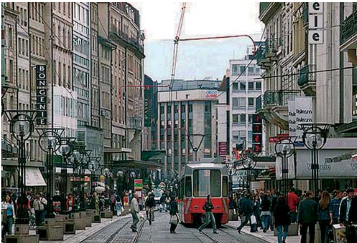
La ciudad de Ginebra es una de las más cosmopolitas del mundo y sede de numerosos organismos internacionales. En la actualidad la construcción de escenarios de encuentro internacional plantean nuevos tiempos, nuevas acciones y nuevas interpretaciones del mundo globalizado.

que de participación política. La gestión política local requiere hoy multiplicar la información, la comunicación, socializar las potencialidades de las nuevas tecnologías. La participación puede ser información, debate, negociación. También puede derivar en fórmulas de cooperación, de ejercicios o gestión por medio de la sociedad civil (asociaciones o colectivos, empresarios ciudadanos, organismos sindicales o profesionales, etc.).