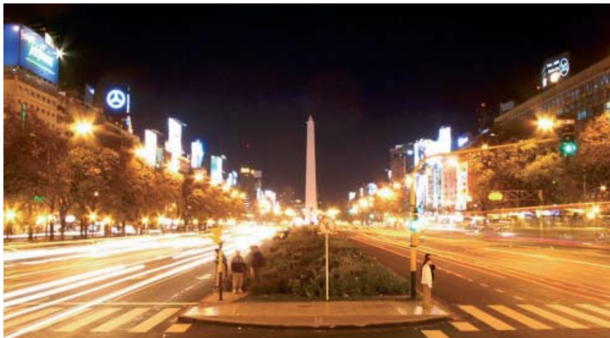
Buenos Aires, una de las más importantes ciudades culturales del mundo, que asume el pluralismo, cultiva la tolerancia y el principio de la concidadanía.

Heidegger la serenidad para con las cosas 10 , la cual conjuntamente con la apertura a lo desconocido nos permite mantener despierto el pensar reflexivo, clave para interpretar lo esencial de la ciudad que se encuentra oculta, sumergida y cubierta, que sale a la superficie y se deja ver como si flotase, llegando de este modo hacer evidente y percibida por todos 11 .