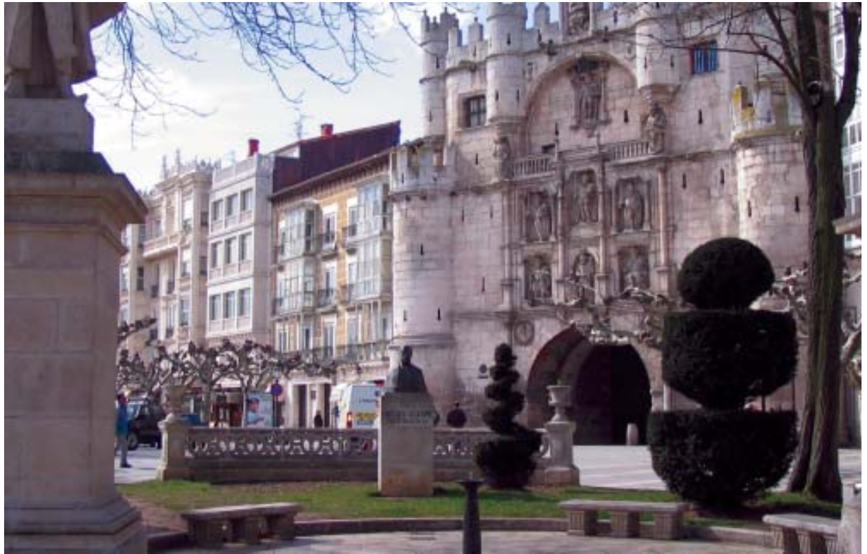
Burgos, Arco de Santa María. reconocida como una de las ciudades medievales características del semblante español. La identidad urbana es la práctica continua de los valores que el ciudadano encuentra en la ciudad que habita.

truye reinventando la ciudad del pasado y diseñando ciudad en las fronteras de la ciudad actual.