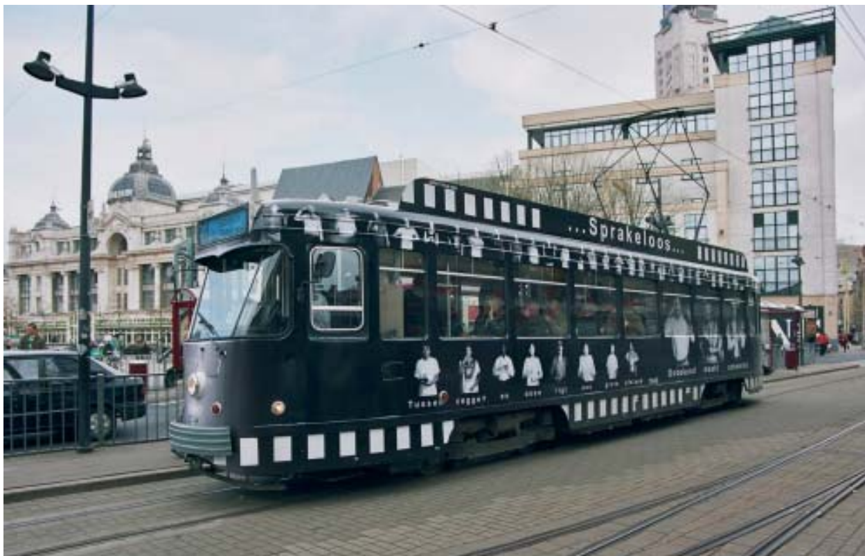
Una de las más importantes ciudades educadoras europeas lo constituye esta ciudad flamenca de Amberes en Bélgica.

Los gobiernos serán autónomos no sólo si están liberados de tutelas políticas en el ejercicio de sus competencias y funciones, sino también si disponen de la posibilidad formal y material de establecer normas y tomar decisiones y, además, de hacerlas ejecutar. Pero al mismo tiempo los gobiernos locales no pueden reproducir y ampliar los vicios de las administraciones públicas tradicionales, por lo cual es deseable introducir formas modernas de control del gasto público y practicar una política de austeras concepciones que les permitirá movilizar mayores recursos para el servicio a los ciudadanos.