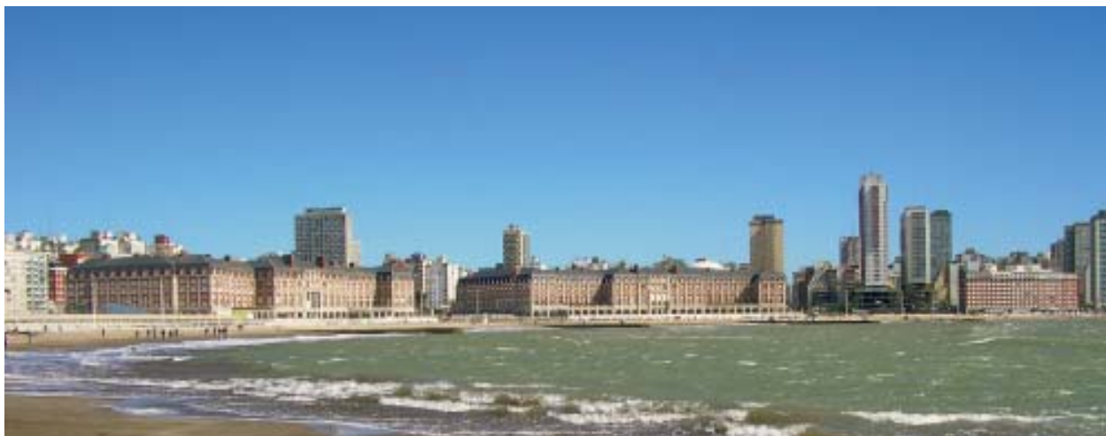
Mar del Plata. Panorámica del sector costero de esta importante urbe educadora argentina. La ciudad es un fenómeno que se abre en muchas dimensiones y que actúa en múltiples interacciones sociales e históricas.

delito, los signos comunicacionales y el dinero, los que flotan peligrosamente sin vincularse oficialmente con nada.