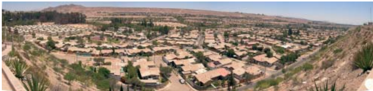
Valleñar, una de las ciudades educadoras de Chile, en plena región de transición entre el norte y el centro de Chile. Sector de Quinta Valle.

una adscripción consciente micro y macro-territorial que le permita exigir al Estado condiciones de vida dignas. Y sólo si se exigen como respuesta al conocimiento adquirido, podrán ser desarrolladas y puestas en función en su entorno y en su vida diaria. 31