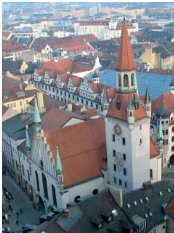
Munich, capital de Baviera, tradicional centro universitario en Alemania. Antiguo palacio del Ayuntamiento. Esta ciudad se constituye además como un importante centro político, con capacidad de autoorganización y movilización social.

el principal obstáculo para que florezcan alternativas políticas progresistas.