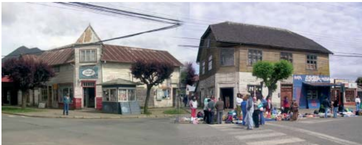
Purranque, pequeña ciudad de la Región de Los Lagos de Chile, centro de la actividad ganadera. Una ciudad educadora también es un ambiente y un contexto acotado de vida y de espíritu y no sólo la gran infraestructura urbana.

un factor, de tal manera que todo lo que esté relacionado con ella es político, excluyéndose rechaza entonces lo que no lo es; o como un dominio específico, es decir, una esfera o un sistema. En la época premoderna no hay concepto de lo político y se utiliza uno de carácter casi naturalista, según el cual políticos son sólo aquellos actos que deciden o realizan los miembros de la clase política. Los actos de las clases no políticas no son actos políticos. Las instituciones regidas por la clase política son políticas; las que no, no lo son. El concepto de lo político, tal y como lo sugiere la autora, vincula la política y la vida cotidiana de las personas. 30