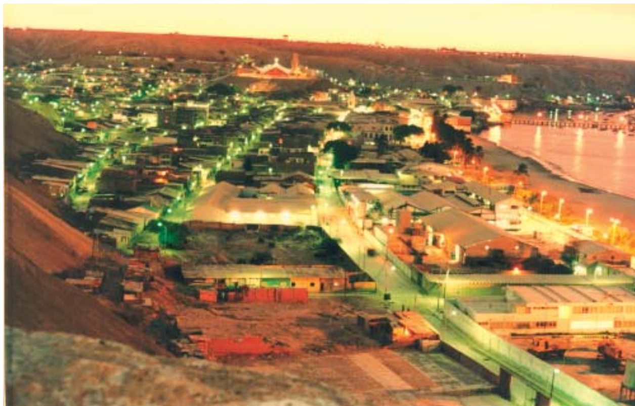
Ciudad latinoamericana reconocida dentro de las ciudades educadoras. Paiza, Perú. No siendo un gran conglomerado urbanístico, es una ciudad viva con identidad y cuerpo propio.

das lo son por su carácter propio y porque tienen el valor de avanzar unidas, de conversar y de componer música.