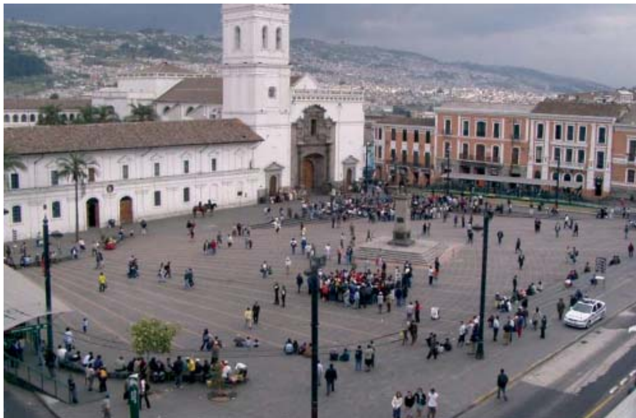
Quito, una de las ciudades coloniales más conocidas de iberoamérica, patrimonio de la humanidad de la Unesco. Sector de Quito antiguo. La ciudad como toda obra humana, es hija del tiempo y de la acción colectiva de muchas generaciones.

Marshall fue claro al afirmar que lo que distingue a la ciudadanía civil, política y principalmente la social –todas asociadas al principio de libertad– es su tensión respecto a su igualdad. La ciudadanía es esencialmente una relación de pertenencia a una comunidad en donde todos tienen un mismo estatus como miembros. Es, por lo tanto, en la política donde se define el avance o retroceso del proceso de ciudadanía. Y es por la razón de ser “sociales” y no individuales que la construcción de ciudadanía social es fundamentalmente lucha y por lo tanto, conquista política: “...el método normal de establecer los derechos sociales es a través del ejercicio del poder...” afirma Marshall.