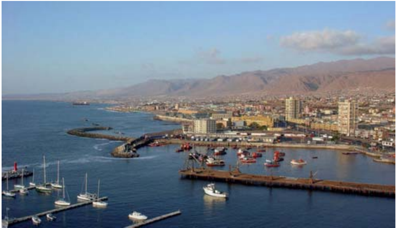
Sector del Club de Yates y borde costero con ausencia de playas naturales.

con un frente de playa de 80 metros y un área de arena solanera de 2400 m 2 con capacidad para recibir a 600 personas/día. El Plan Bicentenario contemplaba habilitar dos balnearios nuevos, uno en el sector norte (Trocadero) y uno en el sector central (El Carboncillo), y mejorar el existente en el sector sur (El Balneario Municipal). Con el proyecto de mejoramiento y habilitación de playas, la ciudad contará en su área urbana con 535 metros lineales de frente de playa, lo que implica un incremento de 6,7 veces lo disponible antes de la ejecución del Plan.