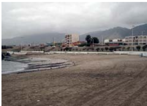
Playa Trocadero, visualizada como una de las playas artificiales del Proyecto Bicentenario.

Durante los años 1998 al 2003, se llevó a cabo el Plan de Saneamiento Ambiental del borde costero de la ciudad de Antofagasta, lo cual permitió eliminar los emisarios de aguas servidas que vertían directamente en la costa. Gracias a la