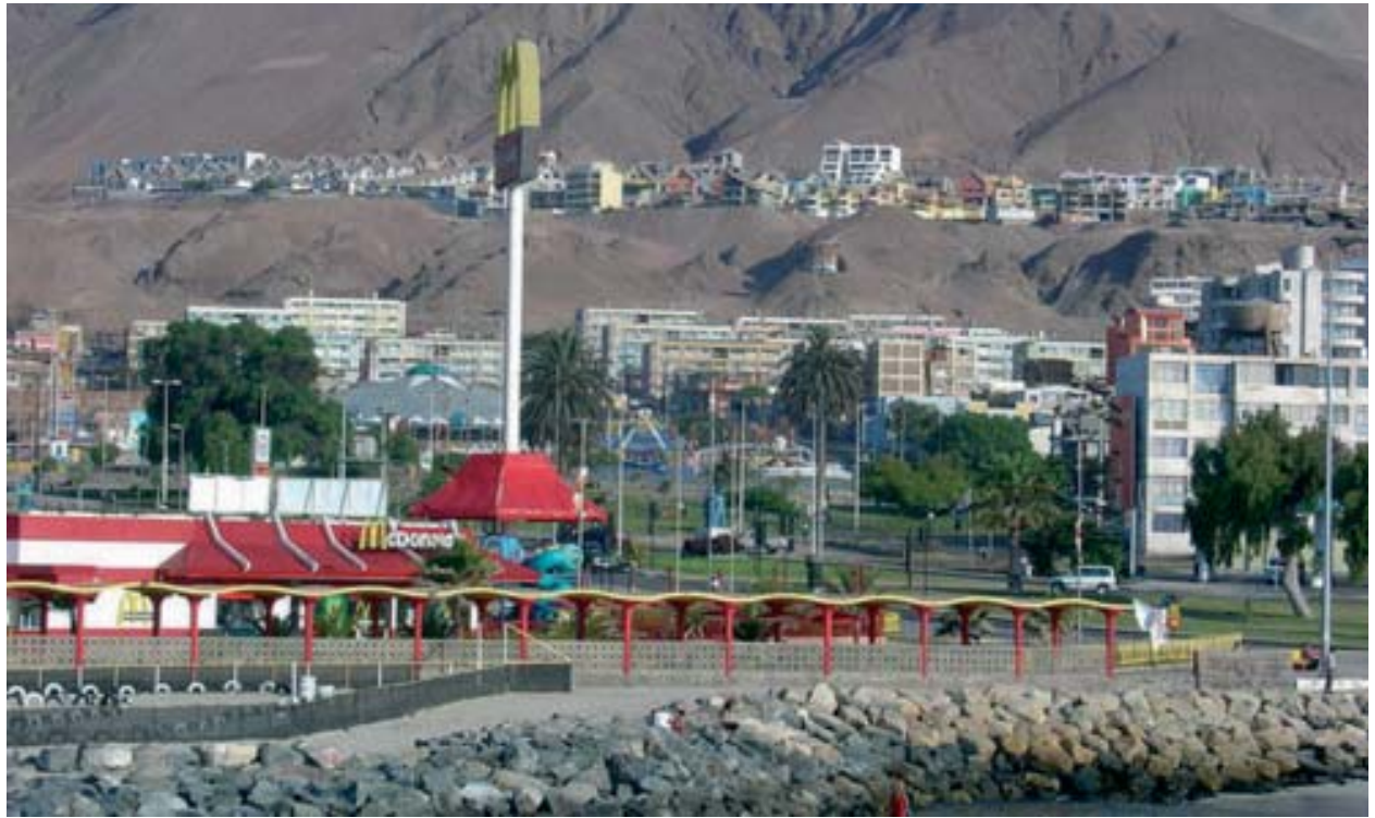
Equipamiento urbano de la costanera de Antofagasta, en su sector central, próximo al balneario municipal.

Es así como una de las iniciativas estrella para Antofagasta, fue la recuperación de los sectores dañados por la presencia de depósitos tóxicos en la costa y la descontaminación de las aguas circundantes a la ciudad.