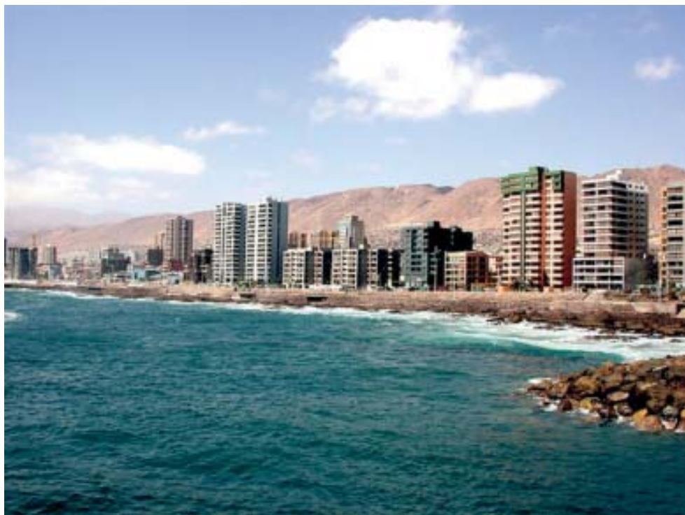
Panorámica del frente costero de Antofagasta, y que muestra escasez de sectores de playas naturales.

Keywords: artificial beaches, coastal border, urban renovation, Bicentenary.