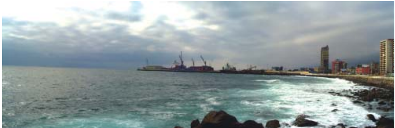
Panorámica global del borde costero de Antofagasta, principal ciudad del Norte Grande.