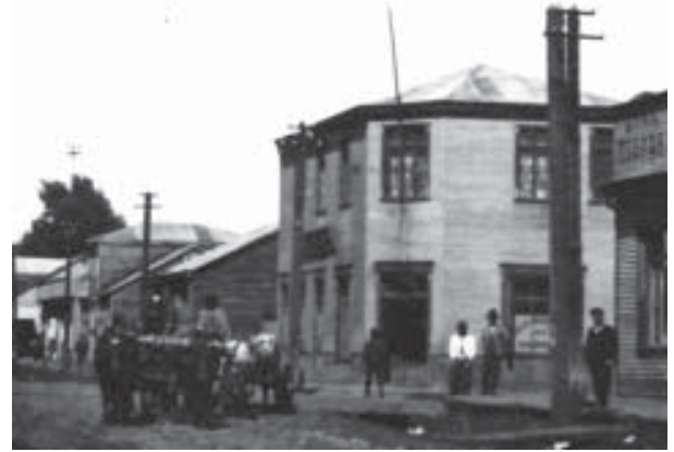
Centro urbano de Loncoche, a inicios del siglo XX, en pleno sector de fragmentación territorial.

Mirado con la perspectiva de la historia, nunca se entendió lo fragmentario como un contexto a ser respetado en su