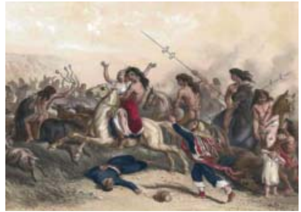
El Malón, pintura de Mauricio Rugendas que ilustra el ataque de indígenas a los poblados y estancias rurales de la Frontera.

Las construcciones de conquista territorial, tenían un carácter de campamento y radicación precaria, muy rápida para consolidar una ocupación, y hacer sentir en forma inmediata, que ese terreno incorporado tenía destino y dueño. El carácter defensivo y de campamento, le otorgaba a