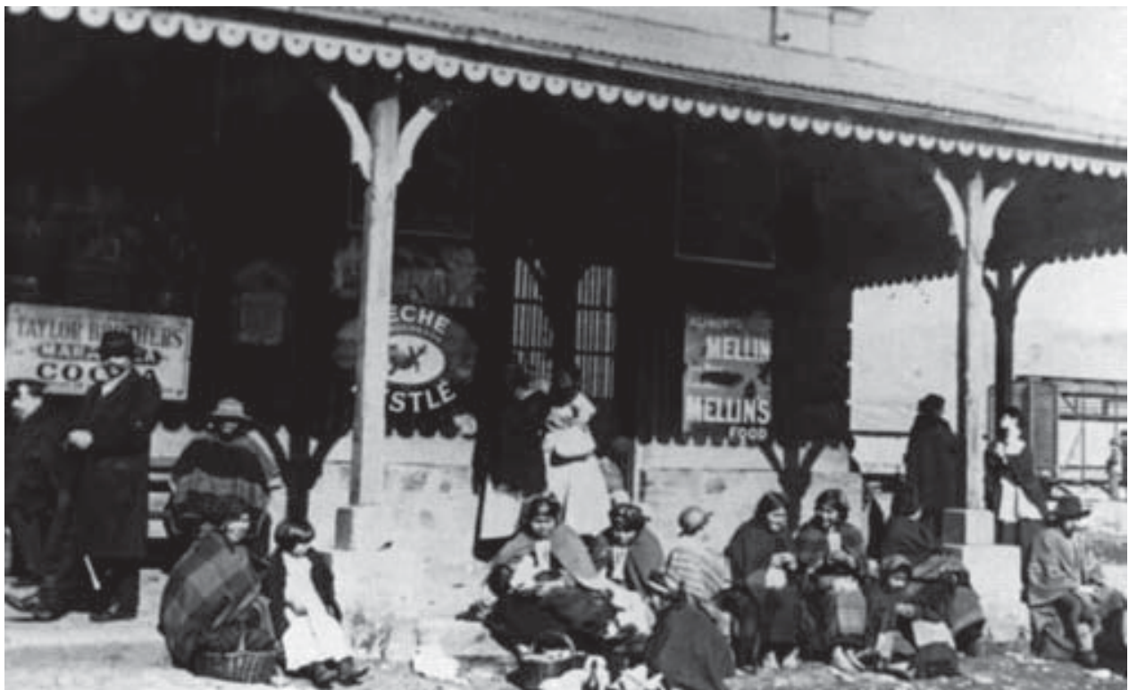
Grupo de mapuches en estación ferroviaria de Temuco, 1892.

Si bien el Chile fundacional comporta un paisaje natural semejante con una geografía fragmentaria que va cortando la continuidad del largo cuerpo del país, es el uso geográfico de esta cualidad, o mejor dicho, la manera tan diferente de usar el espacio como elemento estratégico de invasión o de defensa ya sea para la cultura aborígen o la invasora, lo que provocó una ocupación del espacio singular. En otras palabras, si bien es la actitud humana de utilidad del paisaje y de la tierra la que define cómo lo uso y con qué fines, es también al revés en el sentido de cómo el paisaje