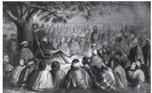
Parlamento de Cornelio Saavedra con los mapuches en momentos de la pacificación de la Araucanía.

Recordemos, además, que una geografía de semiselva impenetrable, fuera de producir el escondite que servía a ambos bandos, generaba una espacialidad saturada de cobertura vegetal que debía ser despejada para su control. La tala de bosques para incorporar tierras cultivables, generará abundancia de madera que permitirá usarla como material constructivo inmediato para ser explotado simultáneamente con la incipiente ocupación.