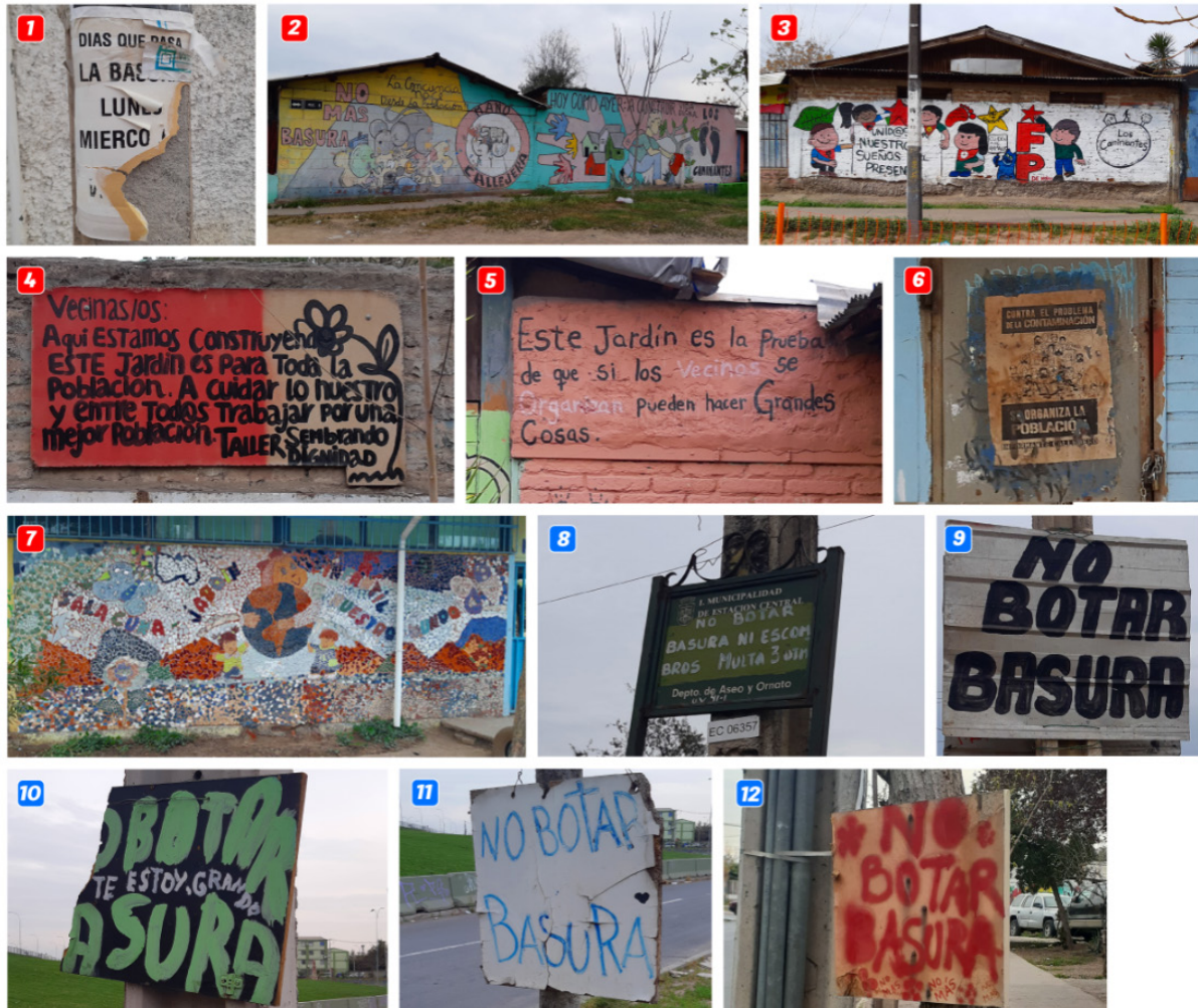
Figura 4 Imágenes de cada una de las inscripciones gráficas analizadas.

mientras que en el sector este predominan aquellas de factura simple y de contenido textual poco elaborado. Según se aprecia en la Figura 3, las inscripciones del sector este se sitúan casi en su totalidad en vías de circulación importantes, en las que transita una importante cantidad de vehículos y las que disponen de aceras de grandes dimensiones y de condición deteriorada. A todo ello debe añadirse, en el caso de la Avenida Ferrocarril, que una de las aceras no tiene ocupación definida y, por lo tanto, no dispone de habitantes para su control visual y su ocupación.