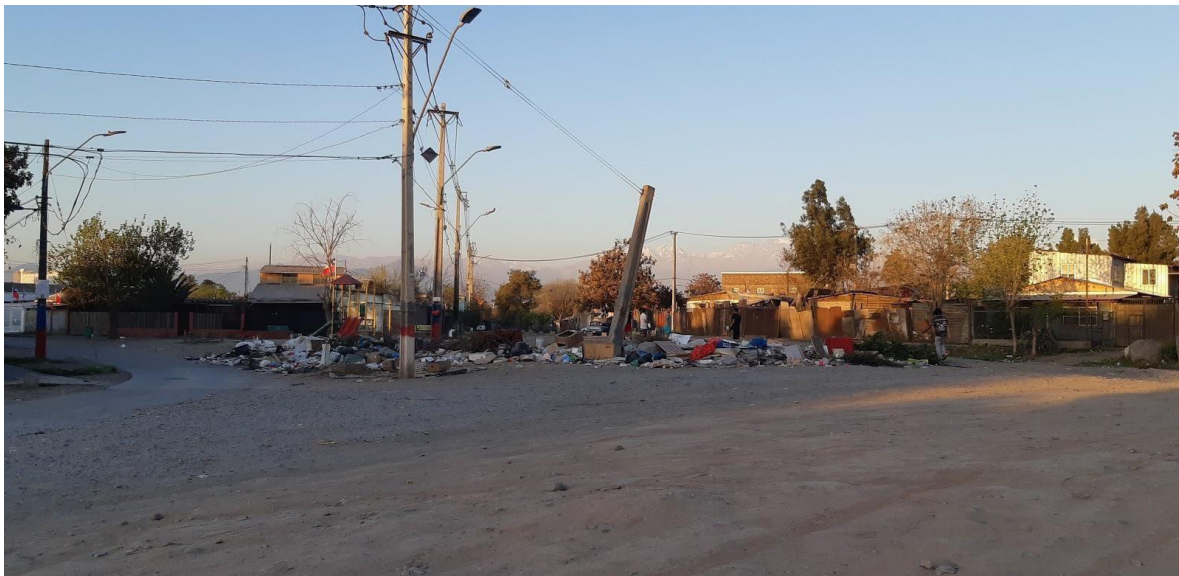
Figura 2. Micro-basura en la intersección de Calle 2 y calle Guillermo Franke, en la población Santiago (22/09/2019). Fuente: Elaboración de los autores.