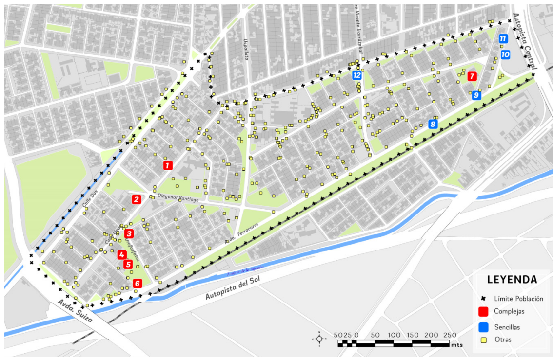
Figura 3. Mapa con la distribución territorial de las inscripciones gráficas en la población Santiago.