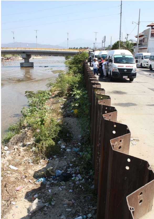
Figura 3. Cortina de protección y Punto Coyoaca I en abril de 2017.

y evaluación, atención y remediación de daños en viviendas e infraestructura (DOF, 2015).