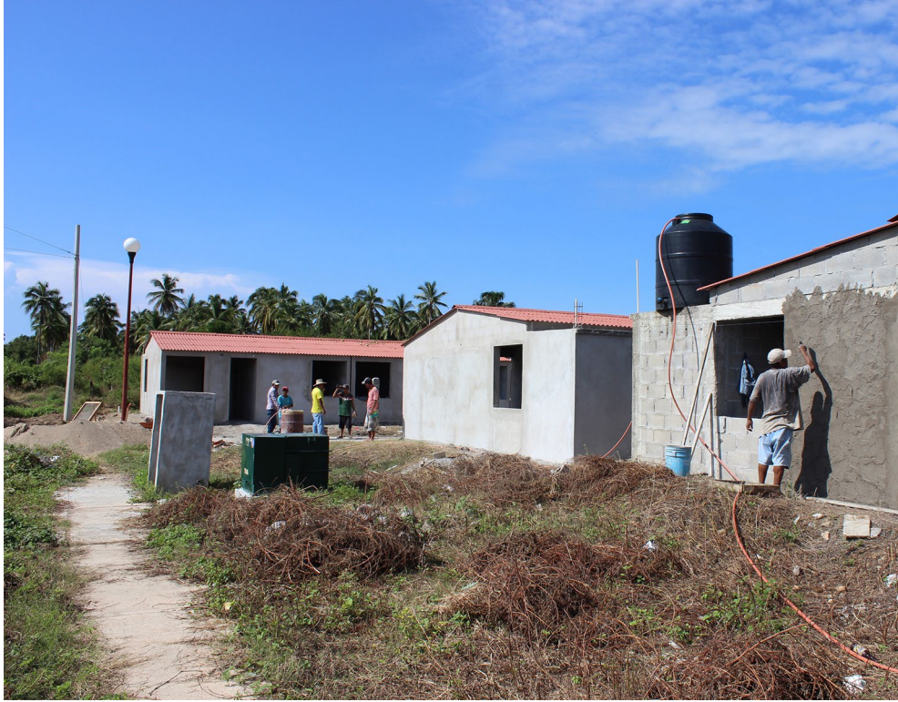
Figura 4. Viviendas para damnificados en septiembre de 2018.