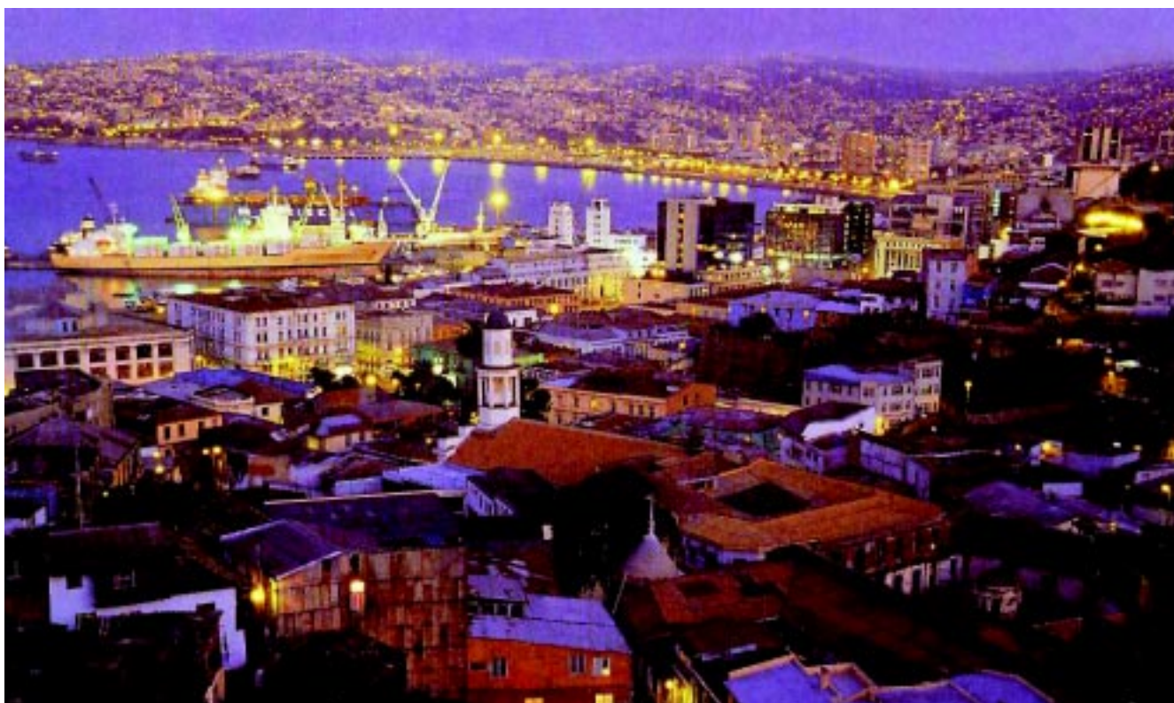
Imagen de la quebrada San Francisco del Puerto, lugar de asiento de la primera población de Valparaíso en torno al centro religioso de la iglesia matriz (Siglo XVI)

dos. Así, en los inicios de la República la ciudad experimenta notables cambios urbanos, extensión de la superficie ocupada, rellenos de playa, apertura de nuevos caminos y la erección de edificios públicos de mayor jerarquía, especialmente dedicados al naciente comercio portuario-internacional, así como residencias permanentes ocupadas por la burguesía.