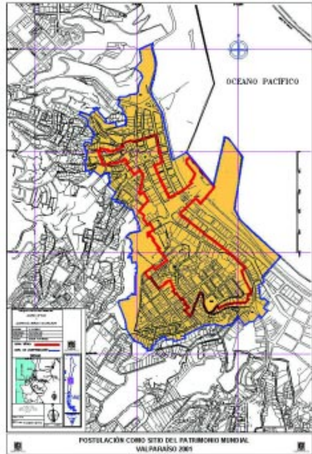
Plano Area Histórica Unesco, título otorgado a la ciudad el 2 de julio de 2003.

Las tipologías arquitectónicas en Valparaíso cumplen un rol documental como reflejo de la época en que fueron construidas, pero también dan cuenta sintética de procesos de configuración de la forma (sus durabilidades, persistencias y adjetividades), incubando las variables o "genomas" de ulteriores desarrollos arquitectónicos, abriendo interesantes vínculos con criterios de diseño e intervención contemporánea sobre un área histórico patrimonial.