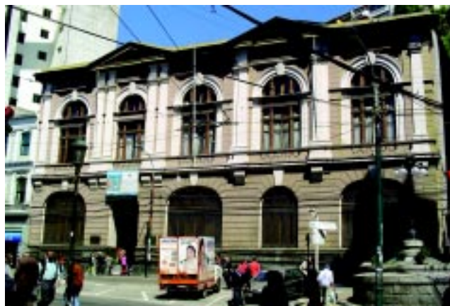
Vista del edificio del Registro Civil e Identificación, antiguo Banco Alemán Transatlántico. Este inmueble de arquitectura tardeolectica da su respaldo sur a la plazuela Turri, encrucijada de las calles Prat, Esmeralda y Cochrane.

Desde el punto de vista documental, los 4 grupos tipológicos registran la identidad social, urbana, arquitectónica y cultural de Valparaíso en un proceso sedimentado de 470 años, donde es recurrente la noción de adaptación de patrones foráneos (estético-funcionales-constructivos) a las demandas ambientales que impone el paisaje, geografía, topografía y situación portuario-sísmico. De este encuentro intercultural va surgiendo una arquitectura particular y apropiada, netamente portuaria a la realidad de Valparaíso, en cuyo camino van consolidándose los esquemas espaciales, funcionales y constructivos profundos, a la vez que se experimenta con la eliminación de aspectos disociados con el proceso.