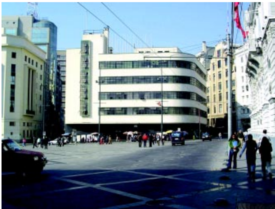
Perspectiva de la plaza Sotomayor desde calle Serrano, al fondo el edificio de ex Correos, actual Palacio de la Cultura, que constituye un sobresaliente ejemplo de arquitectura moderna.

Esta diversidad constructiva, sin duda han contribuido a una clara identidad patrimonial y arquitectónica de la ciudad puerto de Valparaíso.