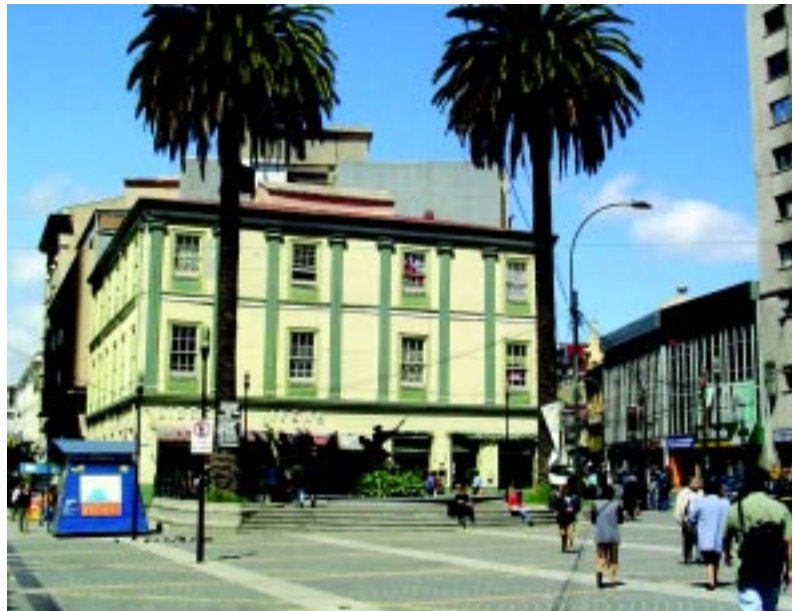
Perspectiva del edificio Ivens, límite oriente de la plaza Aníbal Pinto, en pleno centro cívico de Valparaíso, inmediato a sitios de gran interés turístico

Los valores del patrimonio arquitectónico en el área histórica se ordenan en jerarquías diver-