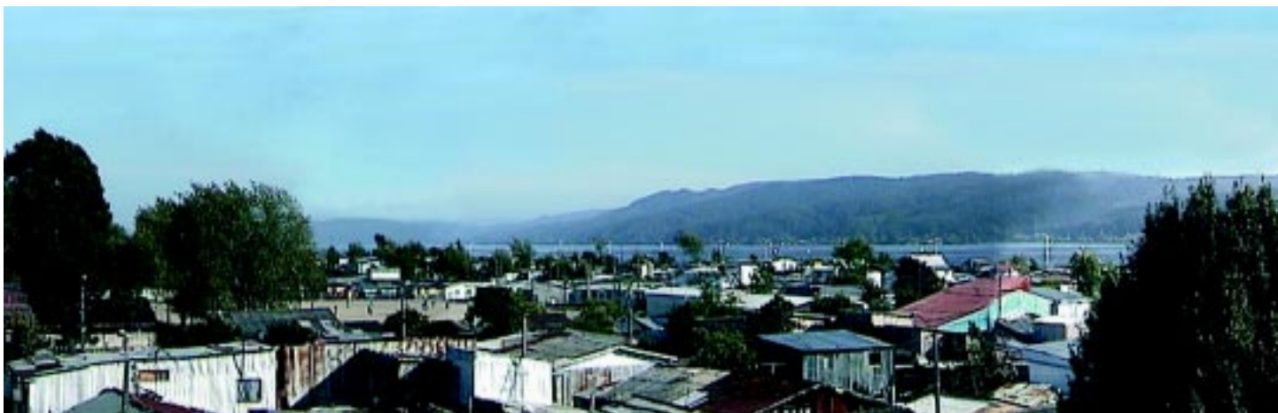
Vista hacia el cauce del río Bío Bío, arriba.

Mercociudades es la principal red de municipios del Mercosur y fue fundada a partir de la iniciativa de los principales alcaldes de la región, con el propósito "de favorecer la participación de las entidades edilicias en el proceso de integración regional, promoviendo la creación de un ámbito institucional para las ciudades del bloque sudamericano y desarrollar el intercambio y la cooperación horizontal entre las municipalidades de la región". En estas Mercociudades, participan un total de 138 comunas de países del cono sur, tanto de Argentina, Brasil, Paraguay, Uruguay, Chile y Bolivia y entre las que Concepción tiene una gran presencia y referencia de