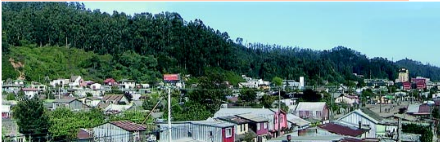
Pedro de Valdivia Bajo, caso emblemático en la ciudad de Concepción, del “Programa 200 Barrios”. Vista hacia el cordón de cerros costeros, arriba.