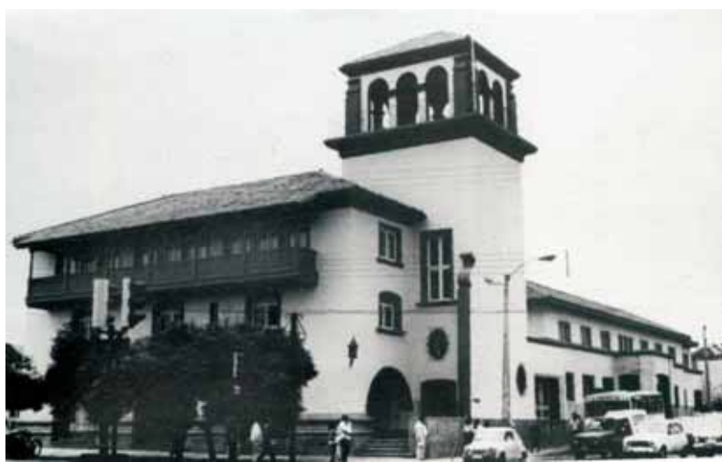
Arquitectura patrimonial de La Serena de gran dimensión, con notable representatividad y morfología armónica y bella.

Es entendible que los gestores del plan asignaran a la ciudad la necesidad de tener un espacio y un ambiente claramente identificable. Fue así que surgió una condición propia del plan que fue la de otorgar a la ciudad una identificación y homogeneidad basada en el estilo.