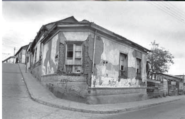
Arquitectura patrimonial de La Serena de menor dimensión pero gran singularidad y morfología de notable composición y estética.

tejido -ya sea aislado o integrado a él- y de gran significación arquitectónica y simbología a nivel ciudadano, como los casos del Liceo de Hombres o la Escuela de Minas, entre otros.