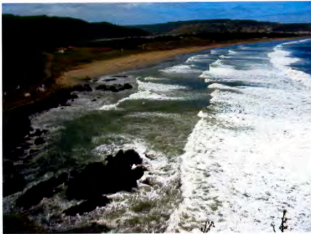
Playa de Lebu.

cundada por enormes tilos, cedros, ulmos y araucarias con carteles indicando sus nombres, y se levanta a un costado la escultura del primer alcalde y un monolito recordatorio del gobernador Iriarte, quien gestionó la venida de los colonos alemanes a la región. La ubicación de esta comuna entre los ejes lacustres de Lanalhue y Lleu Lleu, le dan una clara connotación turística a su desarrollo, que se complementa perfectamente con la presencia de comunidades mapuches que han participado enéste.