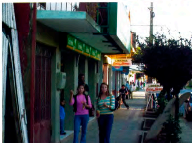
Arauco, en dos dimensiones urbanas.