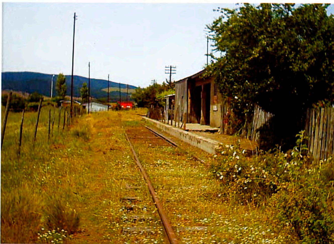
Antigua estación Los Sauces, Lebu.

Esta comuna, asentada en plena Cordillera de Nahuelbuta y a orillas del lago Lanalhue, se caracteriza por la influencia alemana que se denota claramente en la arquitectura de la comuna, su gastronomía y sus costumbres. La plaza está cir-