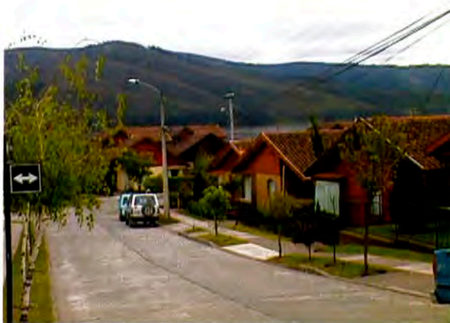
Áreas residenciales y espacios urbanos planificados.

Aún cuando no existe un pronunciamiento explícito sobre su contenido y alcances, diversas disposiciones legales hacen referencia a la obligatoriedad de contar con Planes de Desarrollo Comunal debidamente aprobados, como marco de referencia necesario para la formulación de los programas y presupuestos anuales.