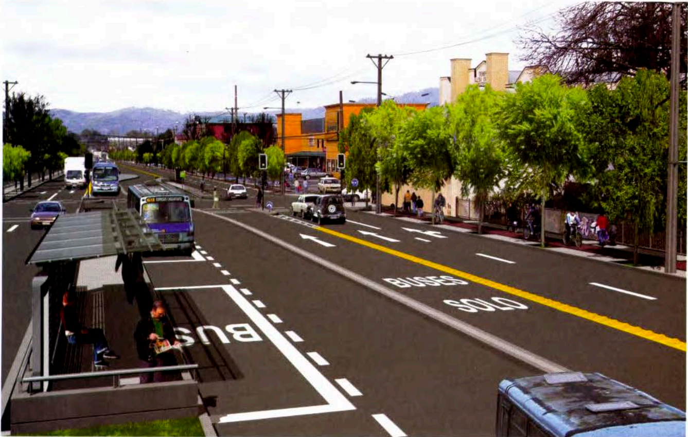
Proyecto Bío Bío, planificación de ejes de crecimiento vial y de áreas de expansión urbana.

En el esquema de la siguiente página - "Materias y Temas que incluye un Plan de Desarrollo Comunal" - se sugiere el nivel de profundidad con que debería ser tratado cada tema para cumplir cabalmente con las exigencias técnicas de la planificación y aportar elementos suficientes para una gestión institucional adecuada. Dicho esquema, además, puede ser utilizado como guía para la elaboración del documento final del PLADeco.