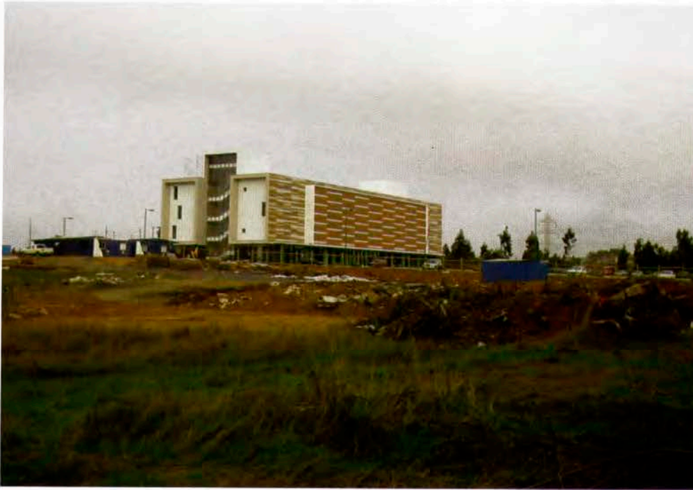
Espacios culturales planificados que se insertan dentro de las nuevas áreas urbanas. Universidad Las Américas en el sector del camino al aeropuerto Carriel Sur, de Concepción.

territorial que se postula para la región y la comuna; los propósitos gubernamentales relacionados con una moderna gestión administrativa, mayor autonomía de decisiones y una eficiente coordinación de los servicios públicos.