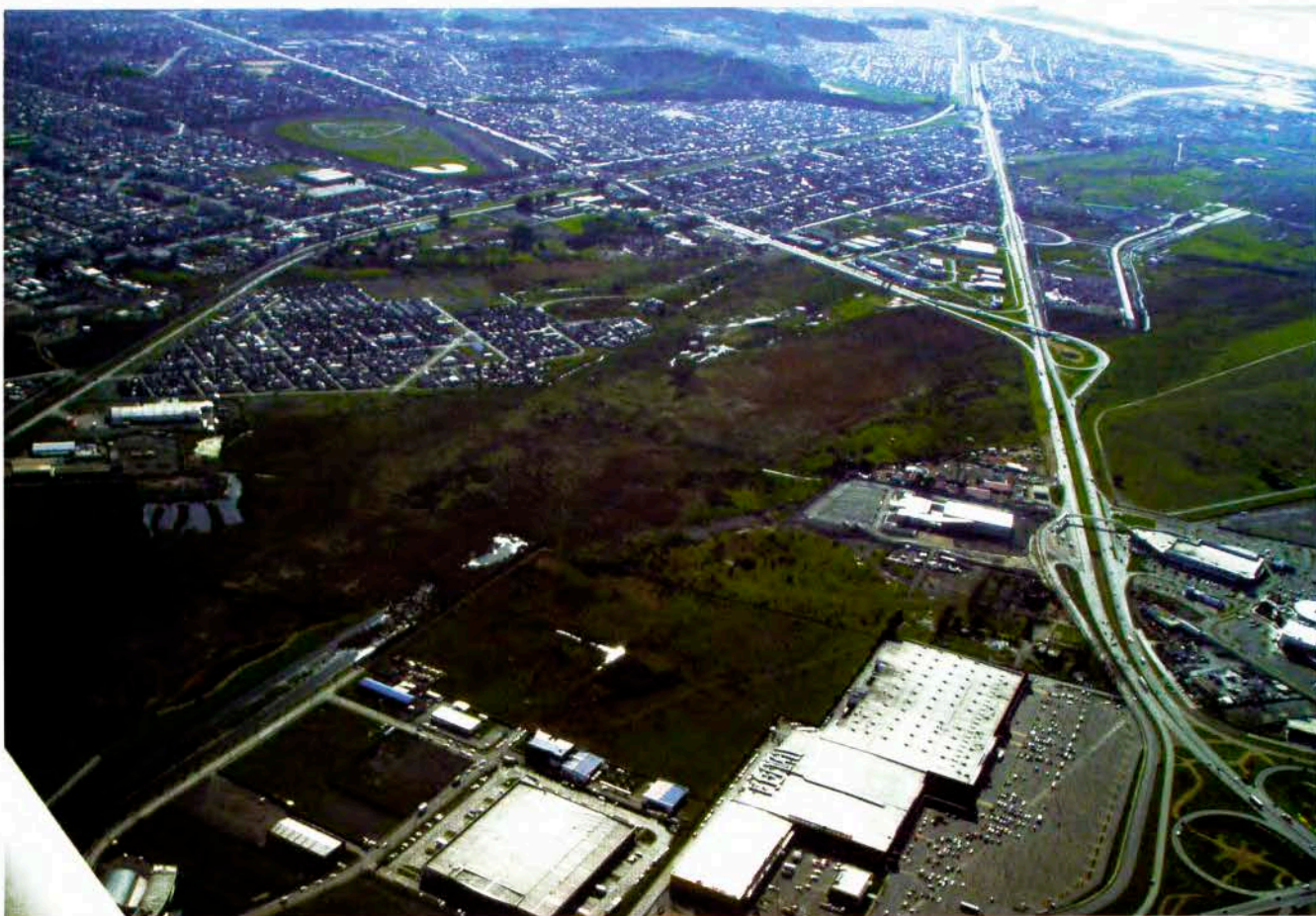
Panorámica de una ciudad que privilegia la estructura de la red vial urbana e interurbana.