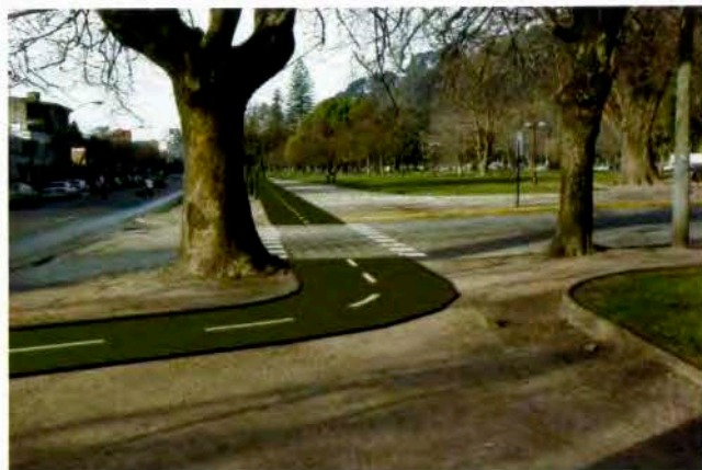
Propuesta de ciclovías del Proyecto Biovías, parque Ecuador, Concepción.

cias de coordinación. De este modo, constituyen una herramienta importante del proceso de planificación y una de las formas concretas y específicas para llegar a materializar la propuesta general de desarrollo.