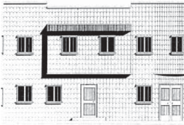
Fachada Pedro Montt 498. Castro

Lo singular de estos procesos en los nuevos entornos urbanos del sur del país, es que la Arquitectura Moderna no se reproduce en forma ortodoxa, tal cual su fuente original, sino reinterpretada, tamizada por la cultura local. Los modelos originales, prototipos del modernismo emergente por esos años, son reelaborados por la mano de obra local, con los materiales locales, utilizando una mano de obra ya experta en el trabajo de la madera, material tradicional de la zona sur del país. De este modo, de una rica tradición arquitectónica y constructiva en madera, expresada en viviendas, iglesias, estaciones ferroviarias y bodegas de madera, el sur ve surgir la arquitectura moderna en madera entre una conjunción de su propia tradición constructiva, la madera y la nueva arquitectura que irrumpe, como es la arquitectura moderna.