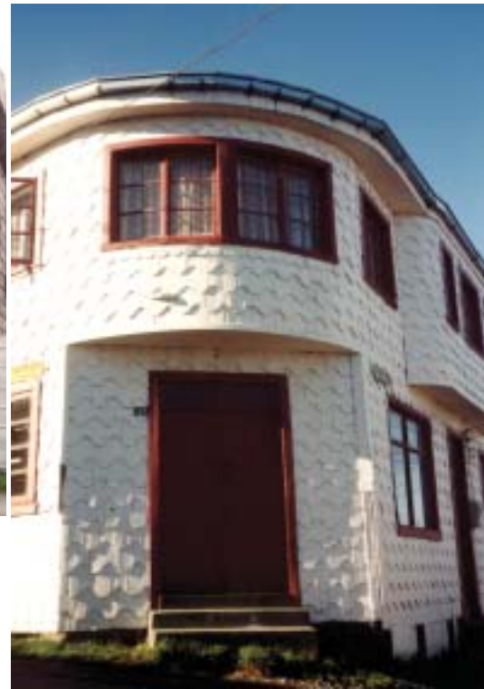
Thompson 106, Castro.

-Las diversas sub-regiones del sur aportan particularidades y especificidades al desarrollo de la Arquitectura Moderna,