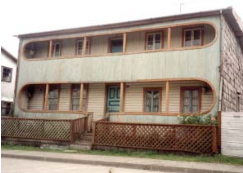
Libertad 41, Quemchi, Chiloé.

-Entre la arquitectura tradicional del siglo XIX y la arquitectura Moderna de los años 1930 hay una diferencia de tensiones: En la primera, éstas son verticales, mientras que en la segunda son horizontales.