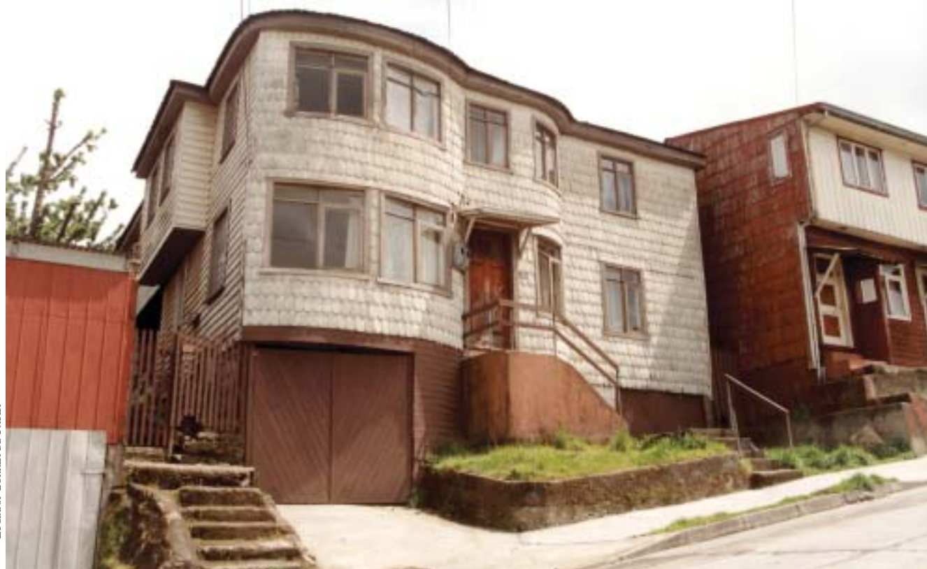
Casa Los Guindos, Angelmó, Puerto Montt.

En madera, no se independiza la estructura del paramento. sino esta se inscribe en el mismo plano ocultándose y disi-