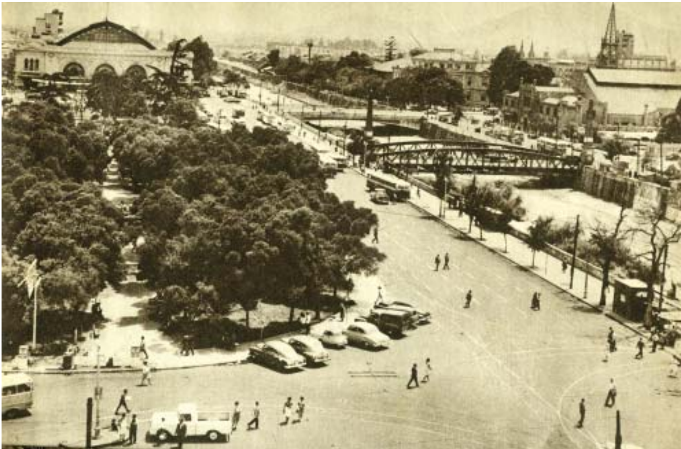
Walter Benjamín por los años 30 del siglo XX se preocupó de la «reproducción fotográfica» de la obra de arte. Sus ideas son importantes para entender el rol de la imagen en el rescate de memorias urbanas significativas. Santiago y el río Mapocho, año 60 del siglo XX.

nos importa es que un millar de imágenes urbanas «copias» pueden articularse entre sí a partir de unos pocos signos reconocidamente intersubjetivos, que entonces sí representan para la sociedad elementos comunes de identidad cultural. Por tanto la imagen urbana no interesa como «obra original» sino más bien como obra colectiva intersubjetiva mil veces repetible. Para Walter Benjamín la imagen urbana de un espacio urbano común y corriente refuerza una «habitualidad» cada vez menos trascendente. Para Lynch la imagen urbana se puede pasar de lo intrascendente a lo trascendente, cuando comienza a producir intersubjetividades a partir de determinados signos que transforman en «signos marcadores» que construyen referentes culturales comunes, por tanto socialmente transversales para los ciudadanos.