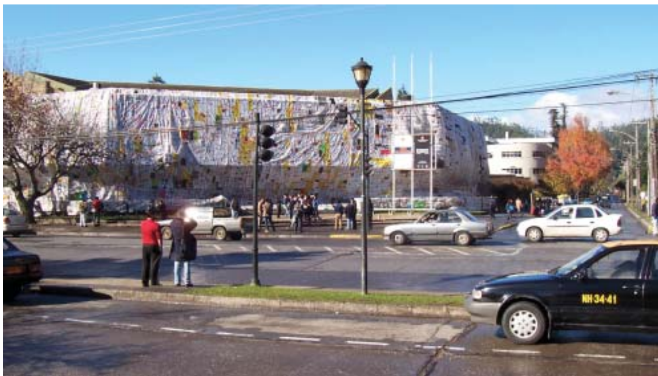
Construcción de significados en la imagen urbana. Frontis de la Casa del Arte, Universidad de Concepción

Se pretende dar algunas luces respecto de los mecanismos conducentes a rescatar «memorias urbanas trascendentes» en aquellos espacios urbanos en los cuales en el pasado ocurrieron hechos sociales relevantes, pero que han perdido los signos, las funciones y gran parte de la configuración de los tiempos históricos cruciales. Nos referimos aquí a memorias relacionadas con hechos y circunstancias que en su momento fueron sucesos sociales o políticos extraordinarios. Muchos espacios urbanos en nuestras ciudades han perdido las «huellas» de los