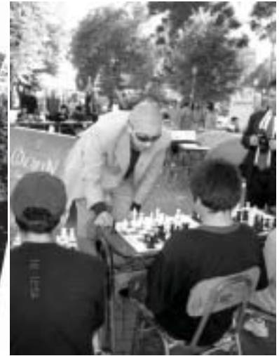
Visiones de una misma identidad urbana. Plaza de Armas de Concepción.

Anthony Giddens en dos de sus obras más recientes, examina las consecuencias de la modernidad avanzada y la globalización que afectan crecientemente una serie de dimensiones de la vida social, como así también las relaciones entre sujeto y ciudad, por lo tanto entre usuario y espacio urbano y con ello la relación entre usuario e imagen urbana. El autor nos habla de la necesidad de rescatar una «relación pura», para referirse a aquellas basadas en la comunicación emocional directa y sin intermediación entre sujeto y ciudad. En la cual reconocemos que «los otros ciudadanos» también se emocionan a partir de las mismas formas y signos y usos en el espacio urbano público. Lo importante aquí es reconocer la necesidad de configurar imágenes urbanas cargadas con potentes valores de identidad para los ciudadanos. Llamaremos a esto una «reestructuración semántica intersubjetiva» de las imágenes urbanas. Porque es esto lo que construye y refuerza los sistemas culturales transversales en la sociedad.