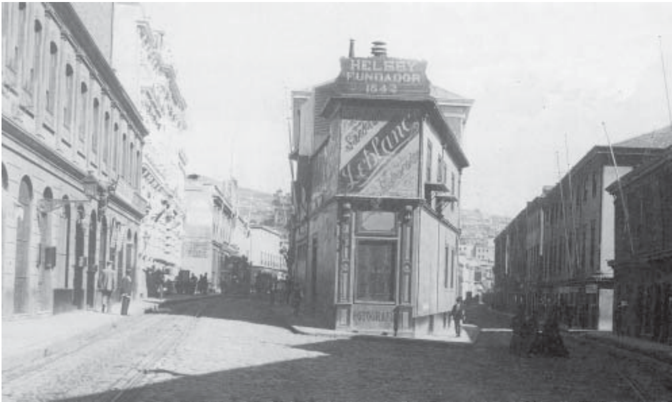
Punto central del casco histórico de Valparaíso en el estrecho plano del emplazamiento urbano inicial, en dos vistas distanciadas en el tiempo.

sucesos que fueron relevantes social y políticamente en los procesos de la formación de la democracia. Consecuentemente una tarea importante para el Diseño Urbano contemporáneo es el rescatar memorias urbanas trascendentales para generar aquellas nuevas asociaciones de identidad a partir de otros signos y de otras configuraciones.