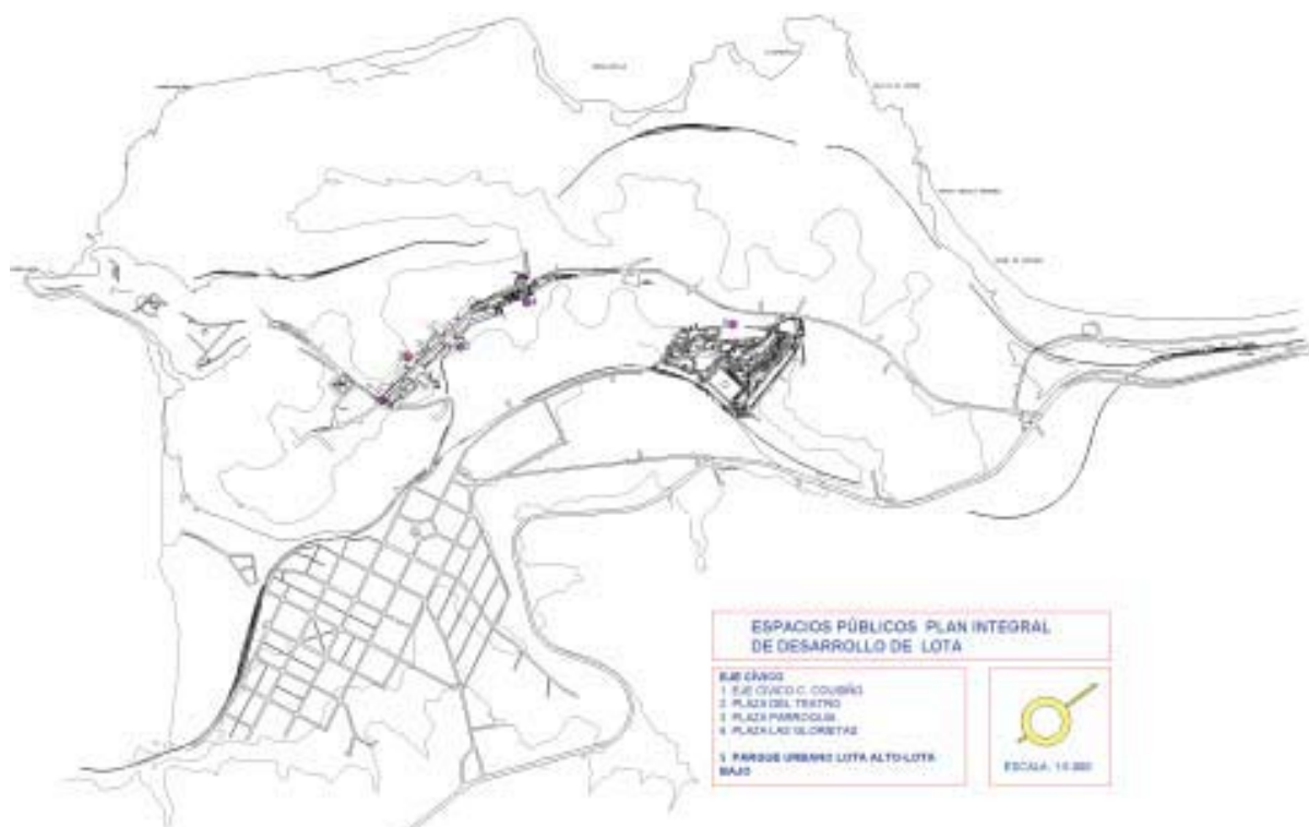
Area de espacios públicos: Plan Integral de Desarrollo de Lota, Corfo 1997.

Especialmente, se ha planteado como un proyecto urbano construido por piezas y estas a su vez por partes. En concreto, se configura en tres grandes piezas urbanas que reconocen las grandes áreas homo-