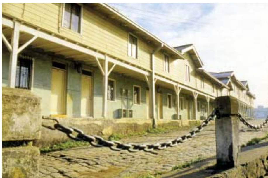
Pabellón restaurado. Minvu, 2002.

industriales y tecnológicas heredadas de la industria carbonífera, es tal vez una de las mayores contribuciones del plan.