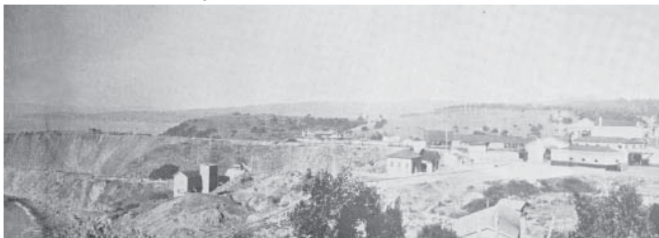
Panorámica del chiflón Carlos.

En eso transcurrieron las obras. Entre quienes querían mantener las estructuras lo más fieles al original que fuera posible y sus habitantes, que vieron en la restauración la posibilidad de mejorar