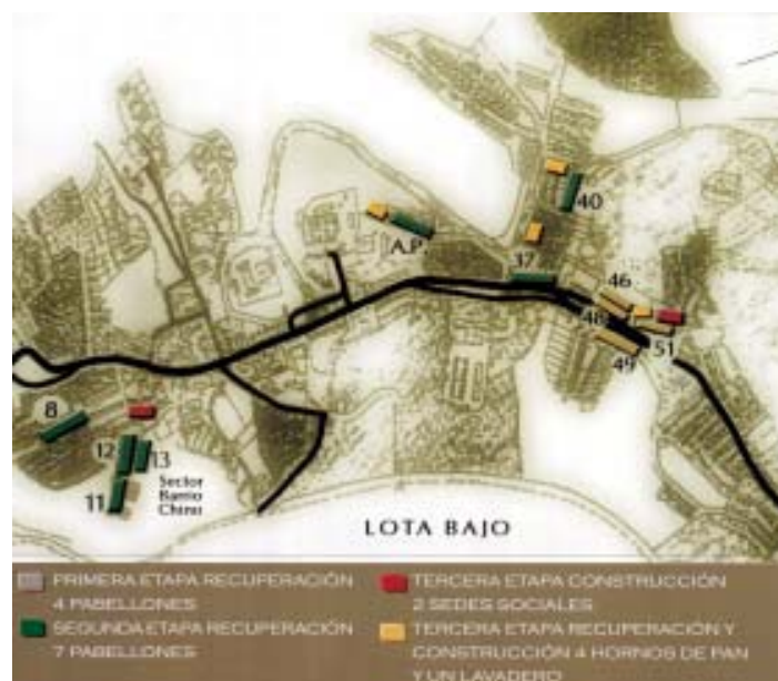
Plano ubicación proyectos de recuperación de Lota.

En tanto, para Lota Bajo, el proyecto de Reordenamiento urbano contemplaba su desarrollo como centro de comercio “a escala