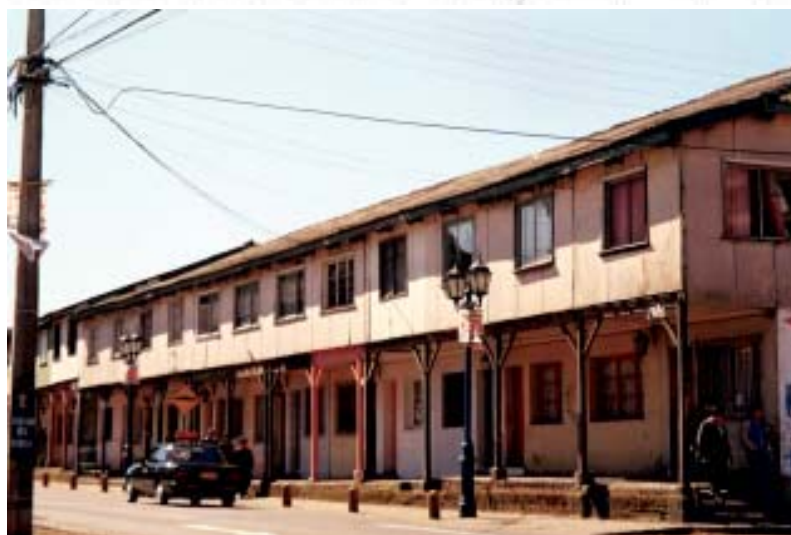
Viviendas obreras de Lota (ayer y hoy), verdaderos patrimonios arquitectónicos.