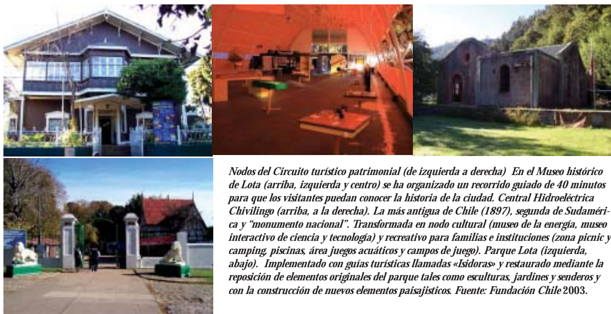
Nodos del Circuito turístico patrimonial (de izquierda a derecha) En el Museo histórico de Lota (arriba, izquierda y centro) se ha organizado un recorrido guiado de 40 minutos para que los visitantes puedan conocer la historia de la ciudad. Central Hidroeléctrica Chivilingo (arriba, a la derecha). La más antigua de Chile (1897), segunda de Sudamérica y "monumento nacional". Transformada en nodo cultural (museo de la energía, museo interactivo de ciencia y tecnología) y recreativo para familias e instituciones (zona picnic y camping, piscinas, área juegos acuáticos y campos de juego). Parque Lota (izquierda, abajo). Implementado con guías turísticas llamadas «Isidoras» y restaurado mediante la reposición de elementos originales del parque tales como esculturas, jardines y senderos y con la construcción de nuevos elementos paisajísticos.

privados crearon un cambio en la fachada tradicional, adoptando un estilo que marca el inicio de la arquitectura actual. Pese a que estos cambios mejoraron la calidad de vida de las personas, no contenía la riqueza pedagógica de anteriores estilos que reflejaban claramente el modo de vida de los mineros.