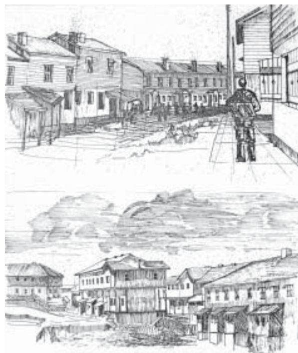
Iconografía del campamento minero de Lota.

El Museo ha reunido e incorporado una serie de objetos y fotografías de los siglos XIX y XX, que son testigos del apogeo del carbón en la ciudad, gracias al esfuerzo compartido entre los ideales de la familia Cousiño y el trabajo de los propios mineros.