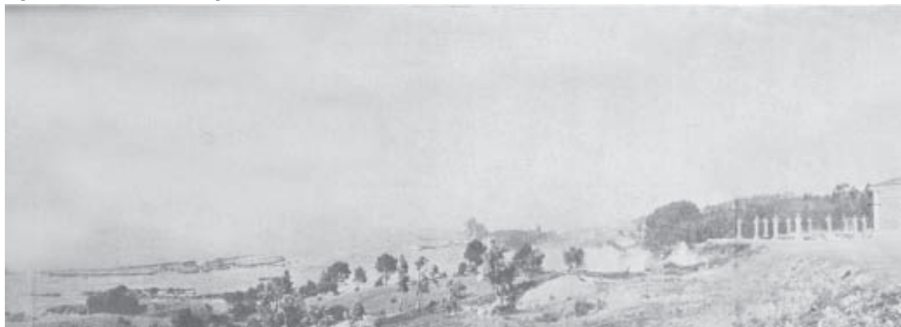
Pique Grande, Lota.

Parece indudable que de todos estos proyectos que contempla el Plan Integral de Desarrollo, aquellos que efectivamente fueron llevados a cabo (rehabilitación del teatro, museo histórico) han contribuido a reconstruir y mejorar el paisaje urbano irradiando a toda la ciudad. Esta reconstrucción de su imagen, íntimamente ligada a su historia mediante la preservación y nuevos usos para las edificaciones