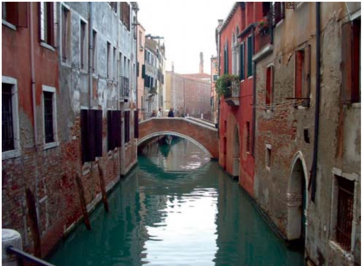
“Vialidad” en los antiguos canales de Venecia.

Abordar la problemática local desde «su dimensión internacional» parecía no tener sentido hasta hace poco tiempo, acostumbrados a un sistema internacional donde los únicos actores públicos globales eran los