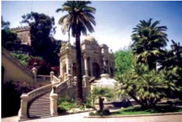
Frontis del cerro Santa Lucía, Santiago de Chile.