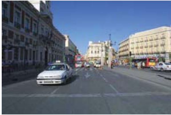
Madrid, ciudad sede del Proyecto URB-AL "La ciudad como promotora económico".

cionales que facilitan otras iniciativas conjuntas, etc.