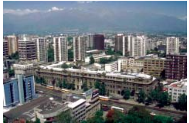
Vista de Santiago desde el cerro Santa Lucía.

implica), se podría argumentar que existen cuatro lecturas de la cooperación descentralizada. Cada una de ellas enfatiza un aspecto del fenómeno y en cada una conviven posturas (teóricas y prácticas) diferentes.