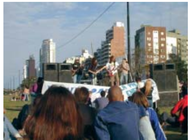
Meeting urbano en el centro de la ciudad de Rosario, Argentina, en relación al derecho al agua. Ciudad sede del proyecto URB-AL "Gestión y control de la urbanización"

7. Gestión y Control de la urbanización (Rosario, Argentina)