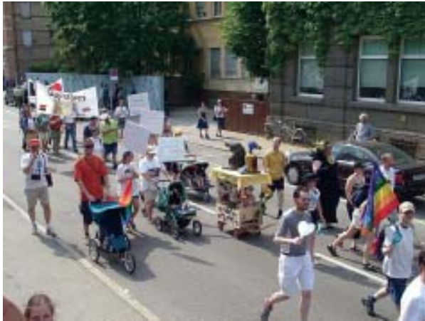
Stuttgart, ciudad sede del proyecto URB-AL "Control de la movilidad urbana".

URB-AL; relación entre gobiernos subnacionales