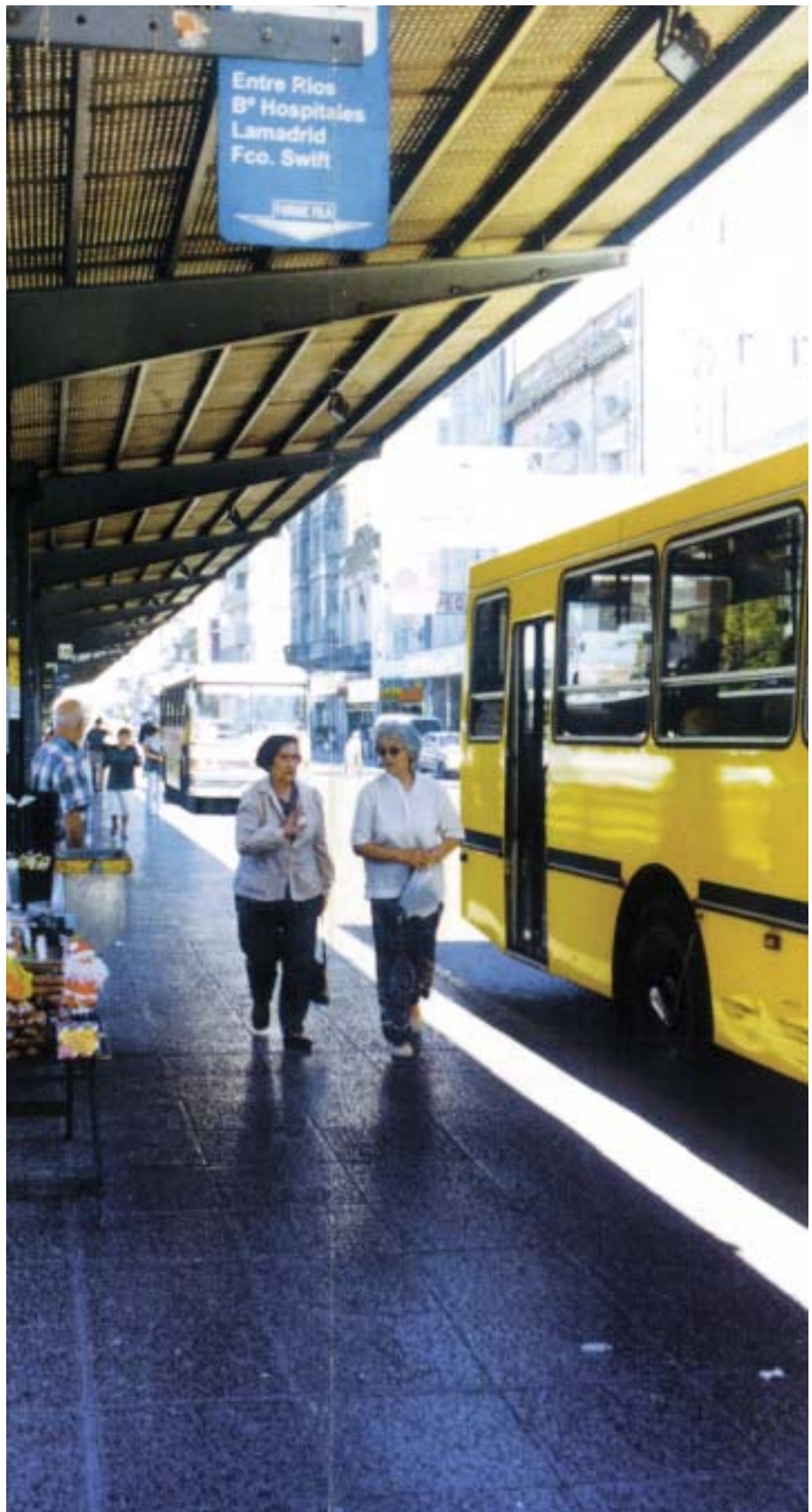
Centro de Rosario, donde se constituye la red temática de "Gestión y control de la urbanización" del proyecto URB-AL Argentina, Rosario.

Con el propósito analítico de intentar explicar las características del Programa URB-AL en el marco del nuevo enfoque de la cooperación (y con los riesgos que toda simplificación