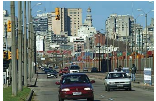
Montevideo, ciudad sede del Proyecto URB-AL "Políticas sociales urbanas".

* No menos importantes son los problemas de acceso a la información, capacitación y capacidad de ejecución, que suelen ser más pronunciados en los niveles locales.